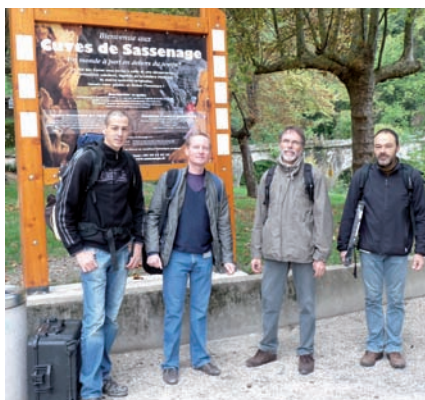
▲ Scientifiques et ingénieurs avant la montée aux Cuves

Aussi, c'est dans les Cuves de Sassenage que scientifiques et ingénieurs se