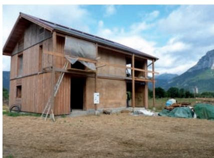
▲ Le bâtiment agricole en éco-construction