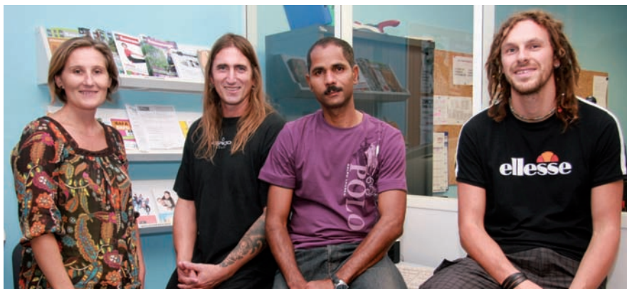
▲ L'équipe du service jeunesse vous accueille dans ses nouveaux locaux

Les jeunes Sassenageois ne boudent pas leur plaisir de profiter d'un nouvel Espace jeunesse. « Ça l'a fait ! », disent-ils !