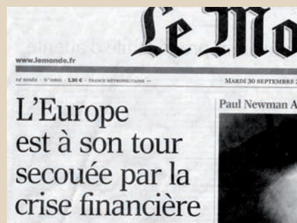
▲ Une crise financière tentaculaire

« Une gestion active pour trouver des solutions, dans une démarche constructive, sans a priori idéologique »