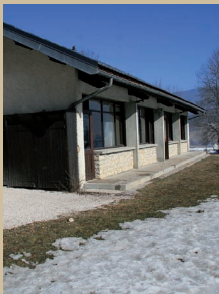
▲ Ne pas s'interdire de vendre

L'effet ciseaux induit une réduction des investissements, malgré des besoins importants.