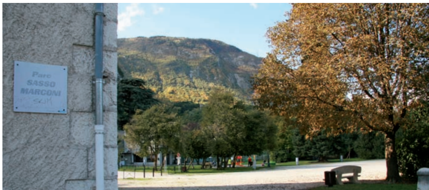
▲ Le parc Sasso Marconi, « hub » de la fibre optique à Sassenage

La liaison par fibre optique de la Malle Poste est en passe d'être achevée. Pour ce faire, un fourreau et des chambres de tirage sont mis en place dans le parc Sasso Marconi. Ils relient pour le moment le conservatoire à rayonnement communal à la Malle Poste. Une deuxième tranche sera réalisée prochainement, entre le conservatoire et le centre associatif Saint-Exupéry. Par ailleurs, quatre puits perdus sont réalisés aux points bas du parc Sasso Marconi afin d'évacuer les flaques d'eau qui se créaient et gênaient régulièrement