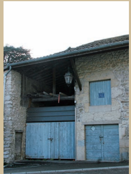
▲ La vieille grange du Bourg a trouvé acquéreur

« Avoir une vision globale plutôt que tirer des conclusions à l'emporte-pièce »