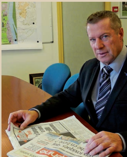
▲ Poursuivre la maîtrise des dépenses