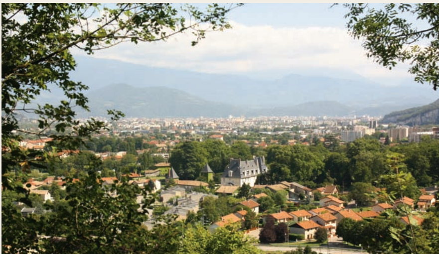
▲ Appréhender l'avenir de Sassenage dans une globalité de territoire et en protégeant la qualité de vie des Sassenageois

« Il faut proposer et innover, agir et réagir, plutôt que subir et se lamenter »