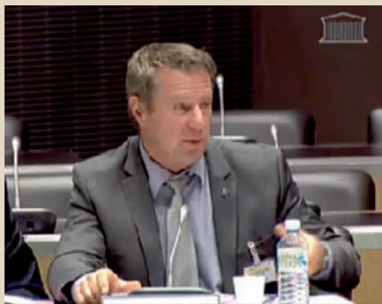
▲ Le maire lors de son audition par la commission parlementaire

Que dans d'autres villes, tous les élus, majorité et opposition, travaillent ensemble pour trouver des solutions, alors qu'à Sassenage, on politise, on prétend qu'on ne serait pas « tombé dans le panneau »... il n'y avait pas de panneau, mais un besoin, pour les collectivités, de financer des investissements.