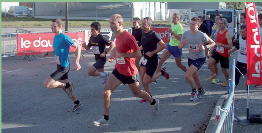
▲ L'édition 2010 de la Corrida