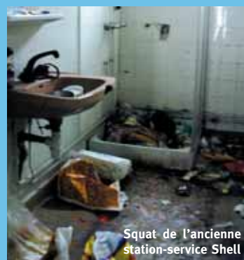
Squat de l'ancienne station-service Shell