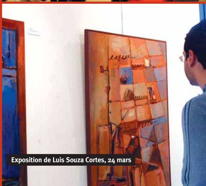
Exposition de Luis Souza Cortes, 24 mars