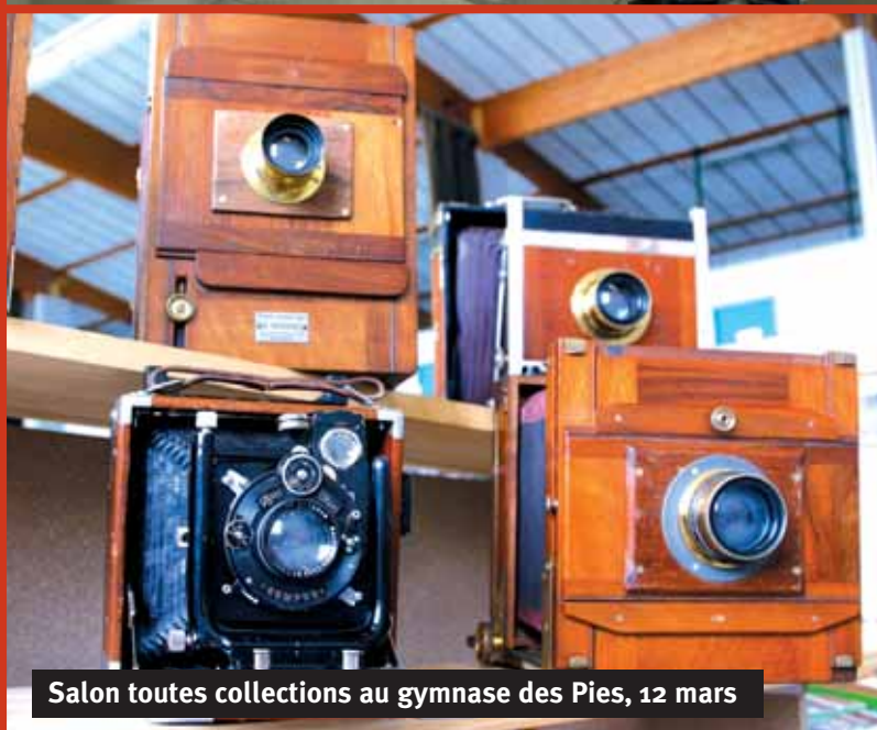
Salon toutes collections au gymnase des Pies, 12 mars