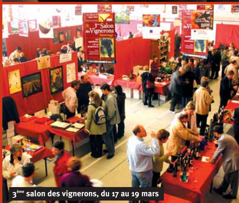
3 ème salon des vignerons, du 17 au 19 mars