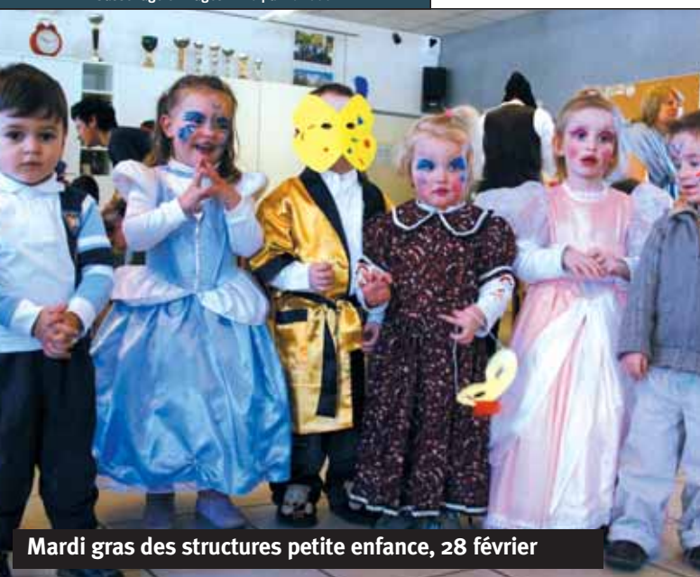
Mardi gras des structures petite enfance, 28 février