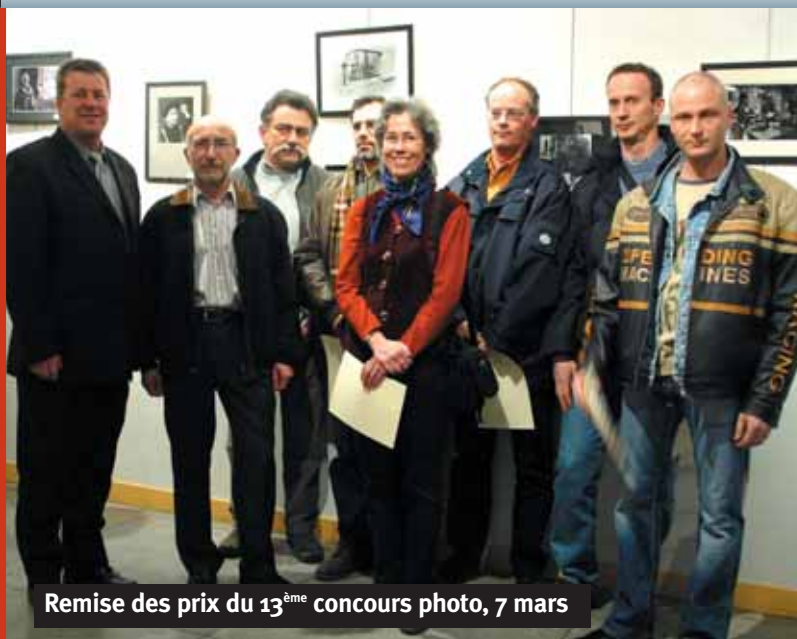
Remise des prix du 13 ème concours photo, 7 mars