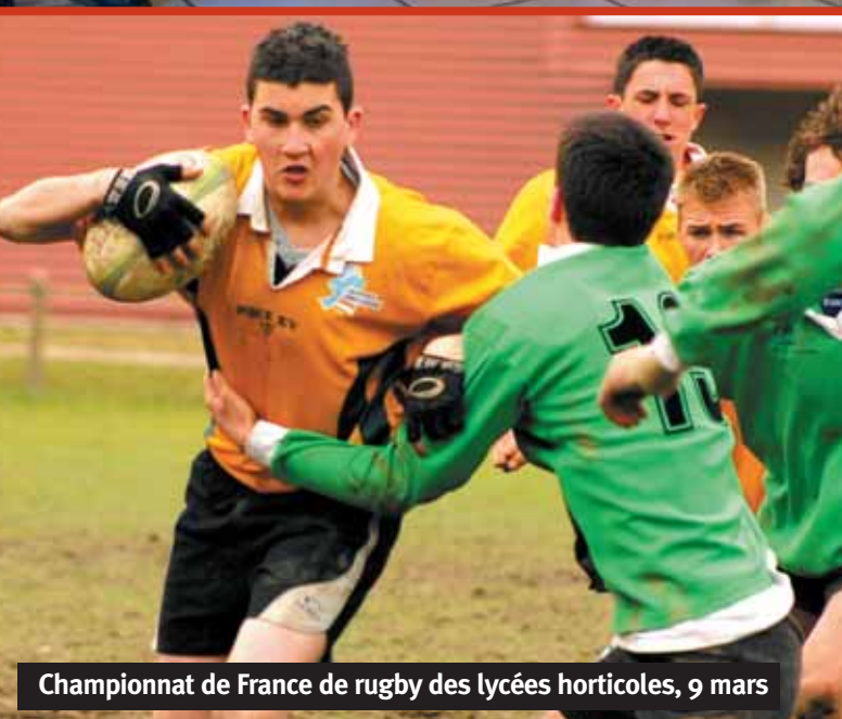
Championnat de France de rugby des lycées horticoles, 9 mars