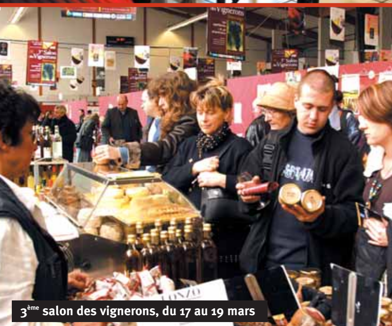
3 ème salon des vignerons, du 17 au 19 mars