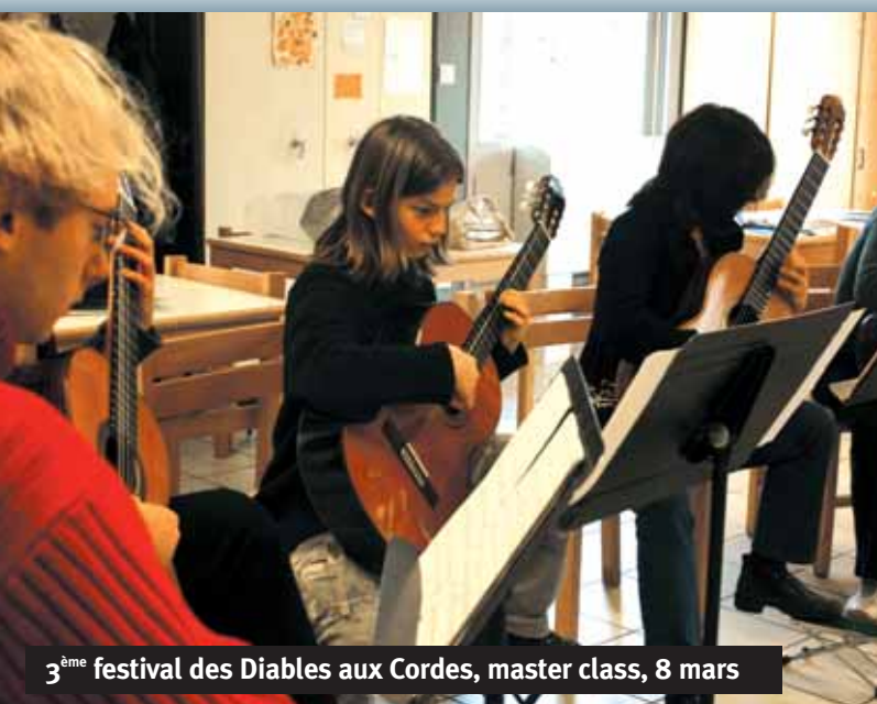
3 ème festival des Diables aux Cordes, master class, 8 mars