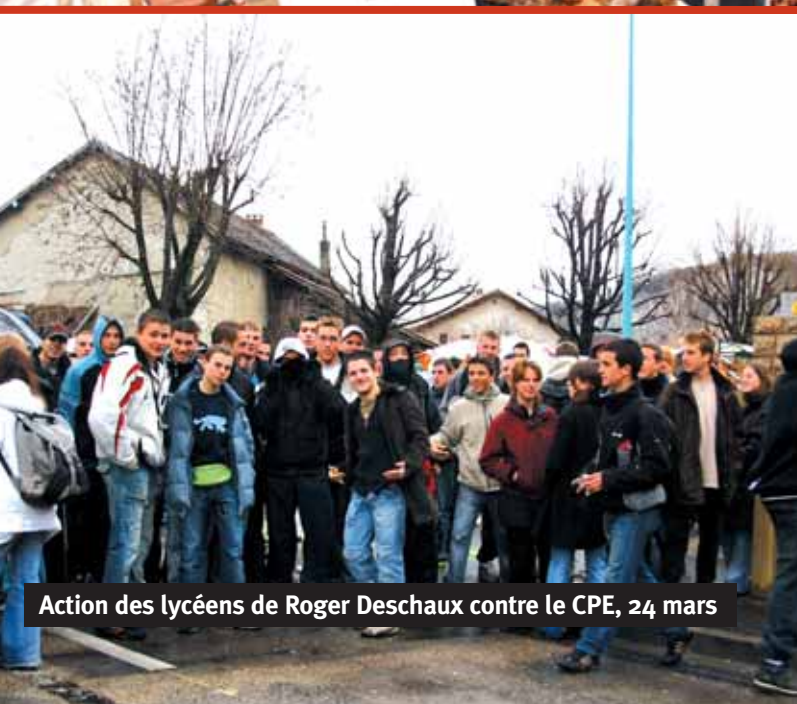
Action des lycéens de Roger Deschaux contre le CPE, 24 mars