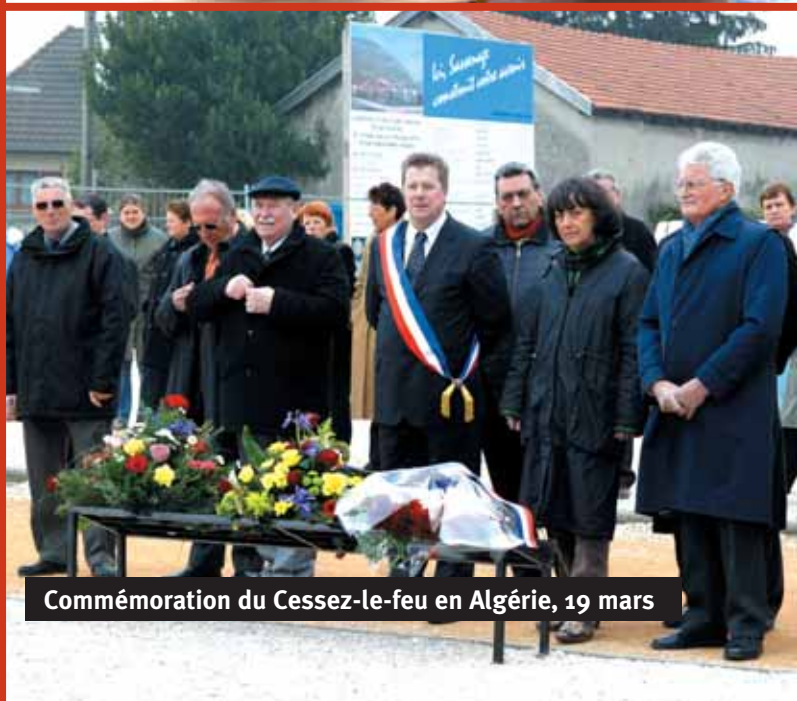
Commémoration du Cessez-le-feu en Algérie, 19 mars