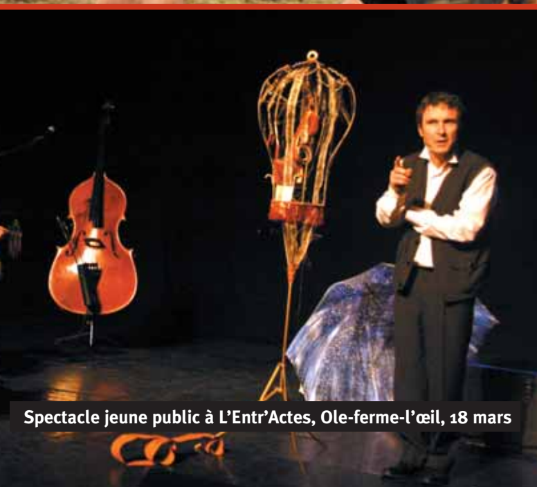
Spectacle jeune public à L'Entr'Actes, Ole-ferme-l'œil, 18 mars