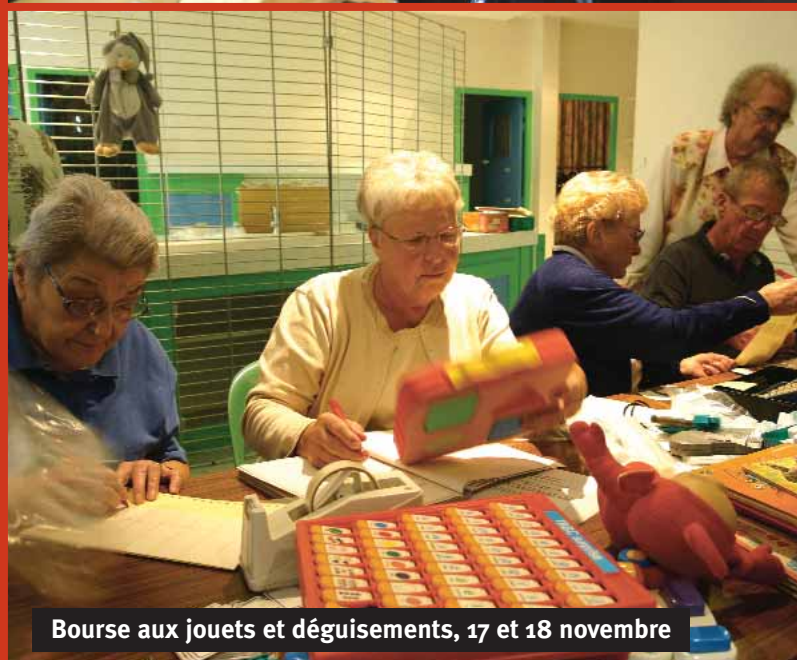
Bourse aux jouets et déguisements, 17 et 18 novembre