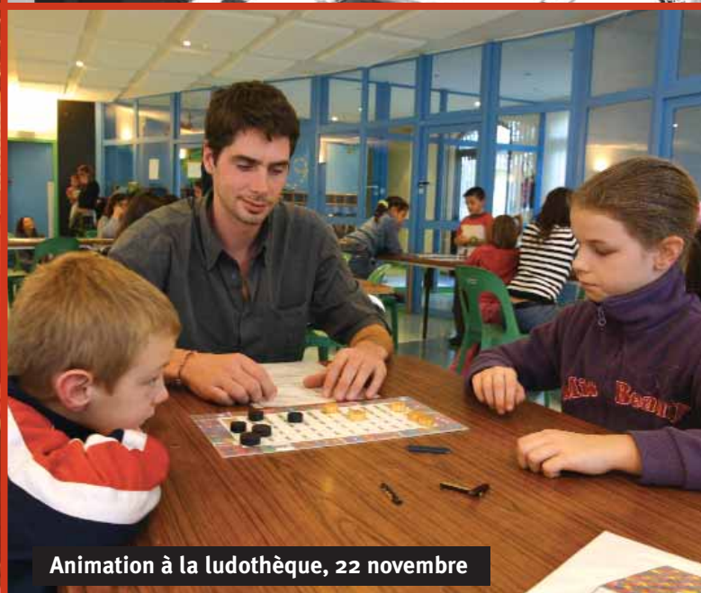
Animation à la ludothèque, 22 novembre