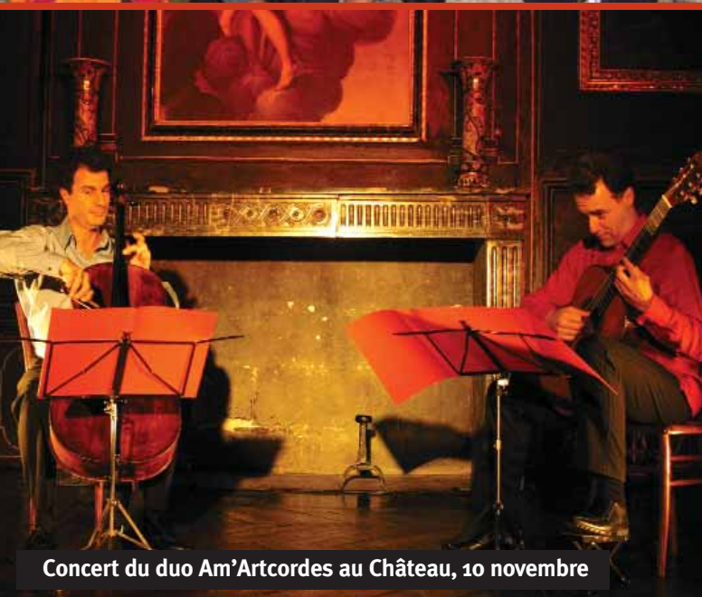
Concert du duo Am'Artcordes au Château, 10 novembre