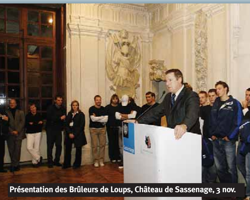
Présentation des Brûleurs de Loups, Château de Sassenage, 3 nov.