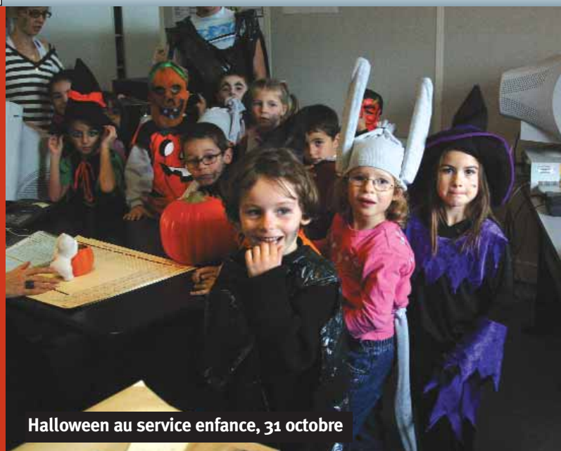
Halloween au service enfance, 31 octobre