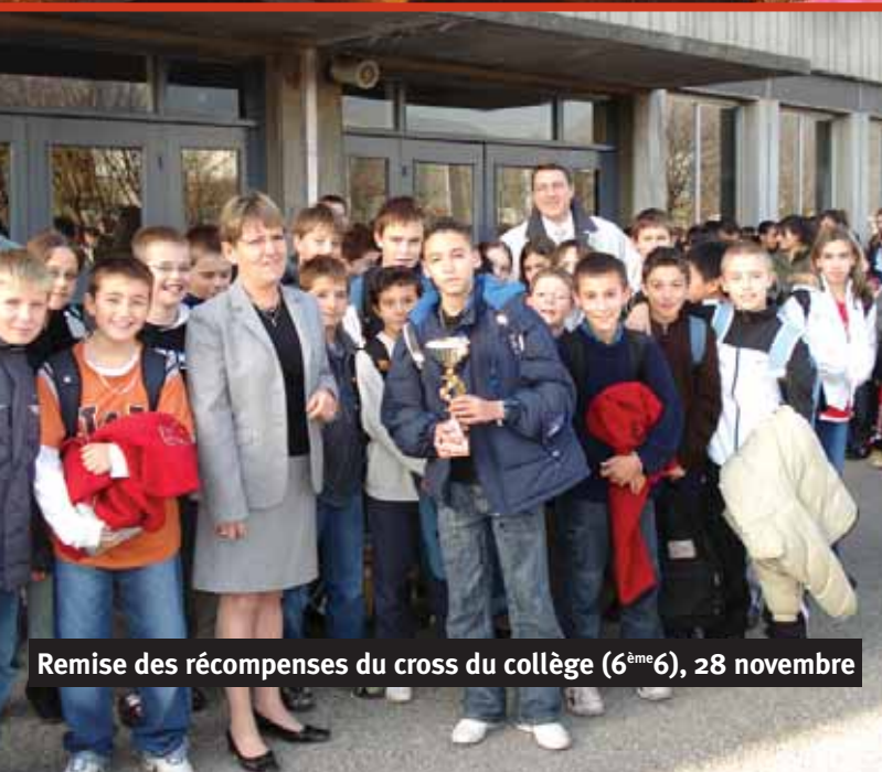
Remise des récompenses du cross du collège (6 ème 6), 28 novembre