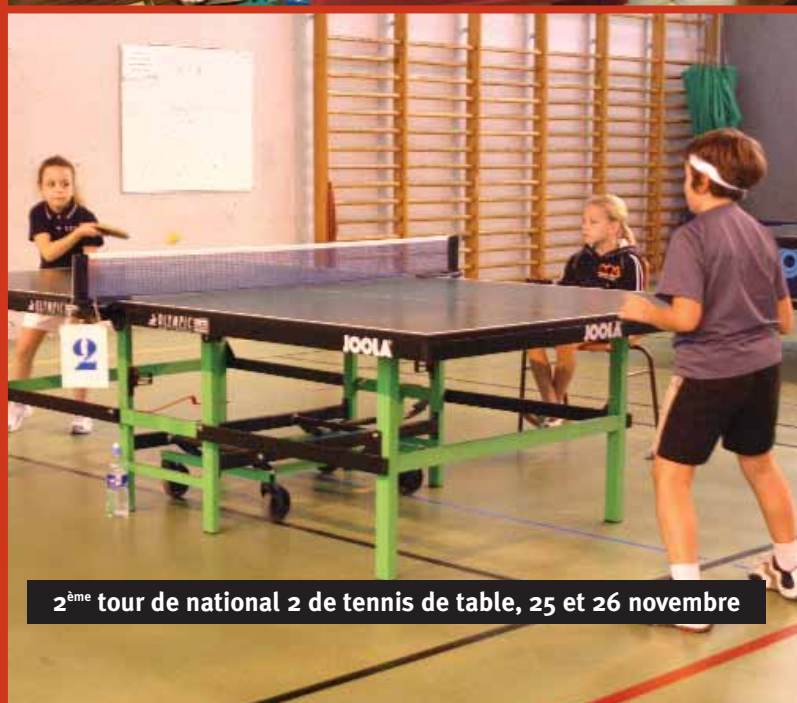
2 ème tour de national 2 de tennis de table, 25 et 26 novembre