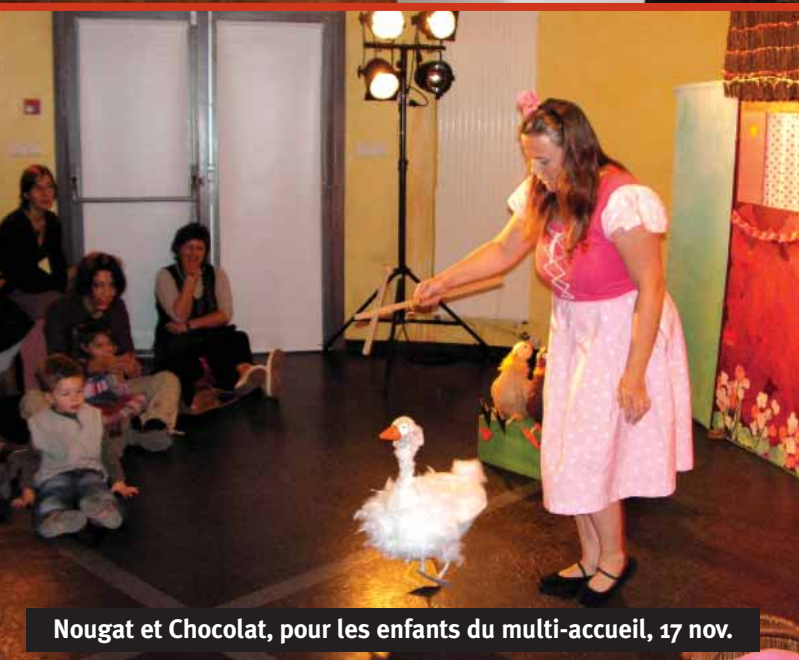
Nougat et Chocolat, pour les enfants du multi-accueil, 17 nov.