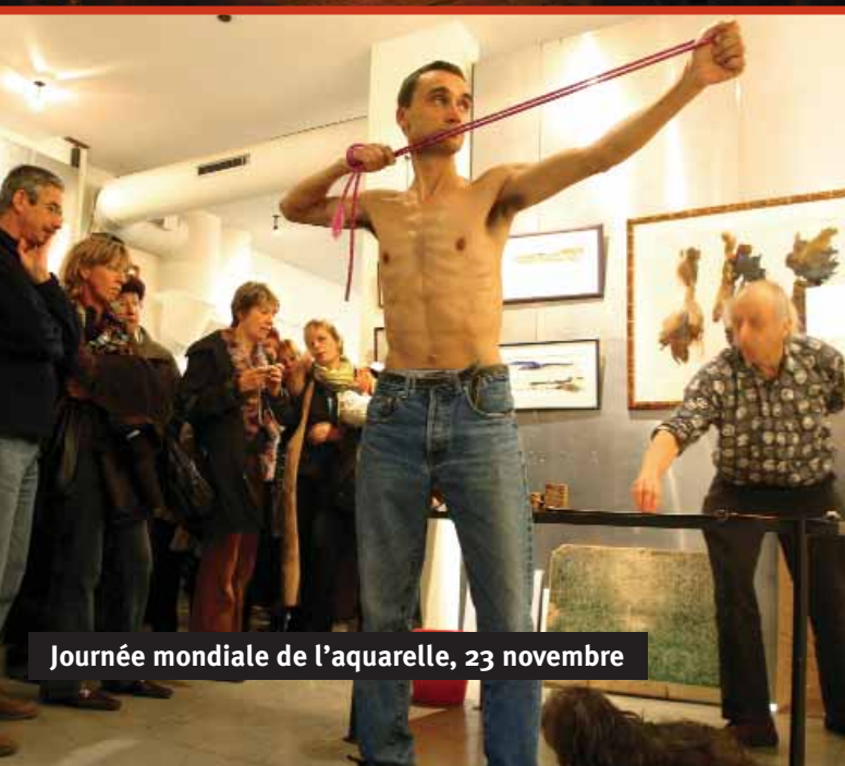
Journée mondiale de l'aquarelle, 23 novembre