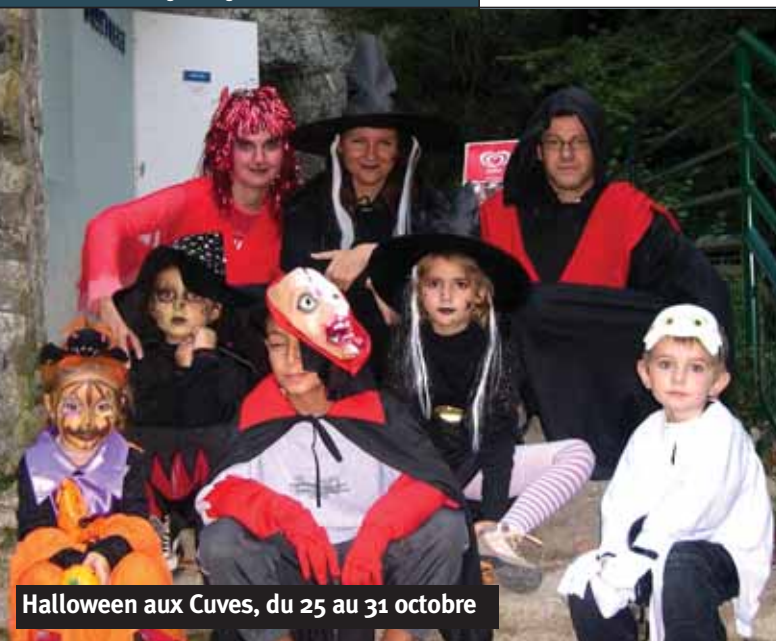
Halloween aux Cuves, du 25 au 31 octobre