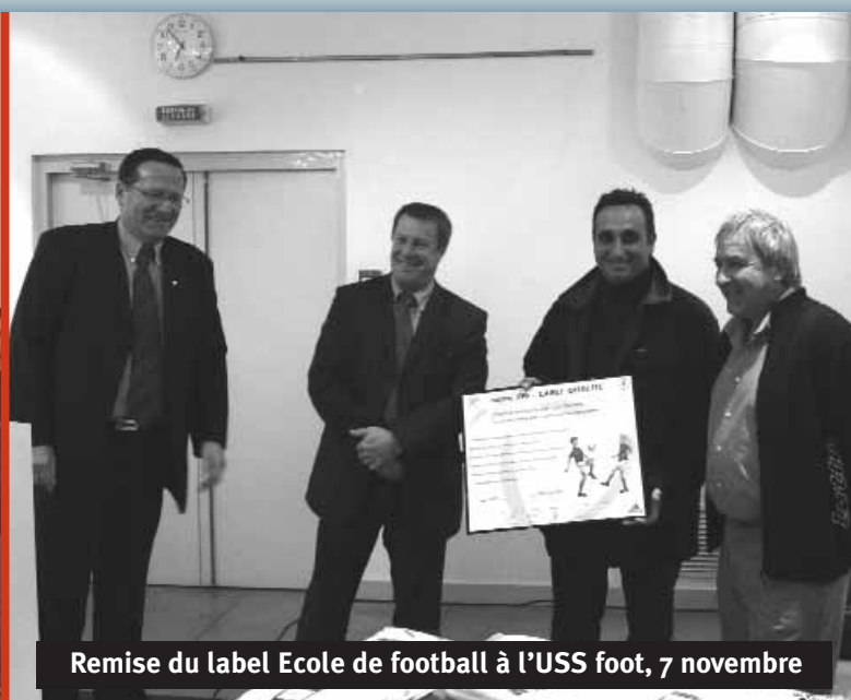
Remise du label Ecole de football à l'USS foot, 7 novembre