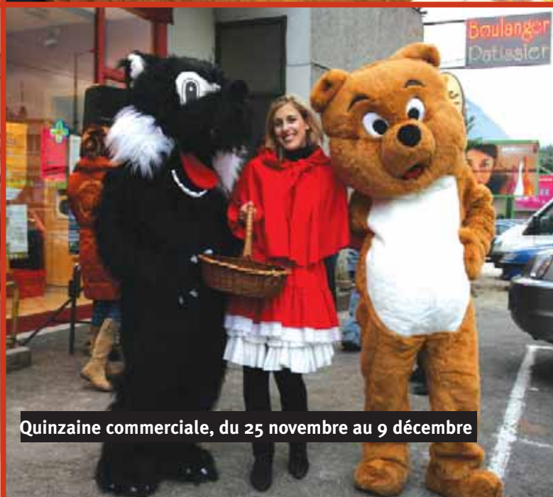
Quinzaine commerciale, du 25 novembre au 9 décembre