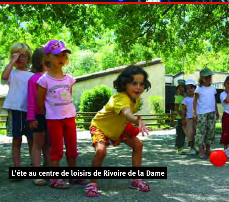
L'été au centre de loisirs de Rivoire de la Dame