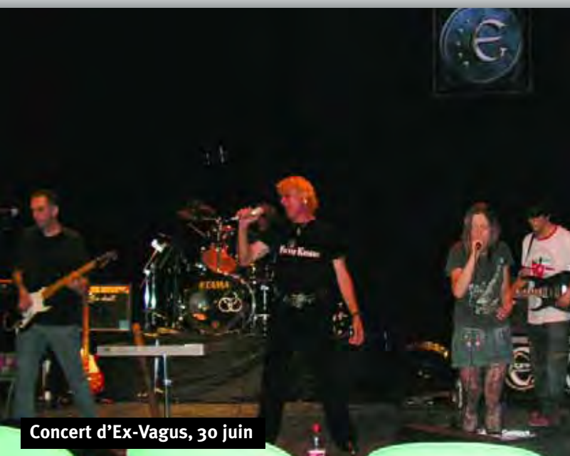
Concert d'Ex-Vagus, 30 juin