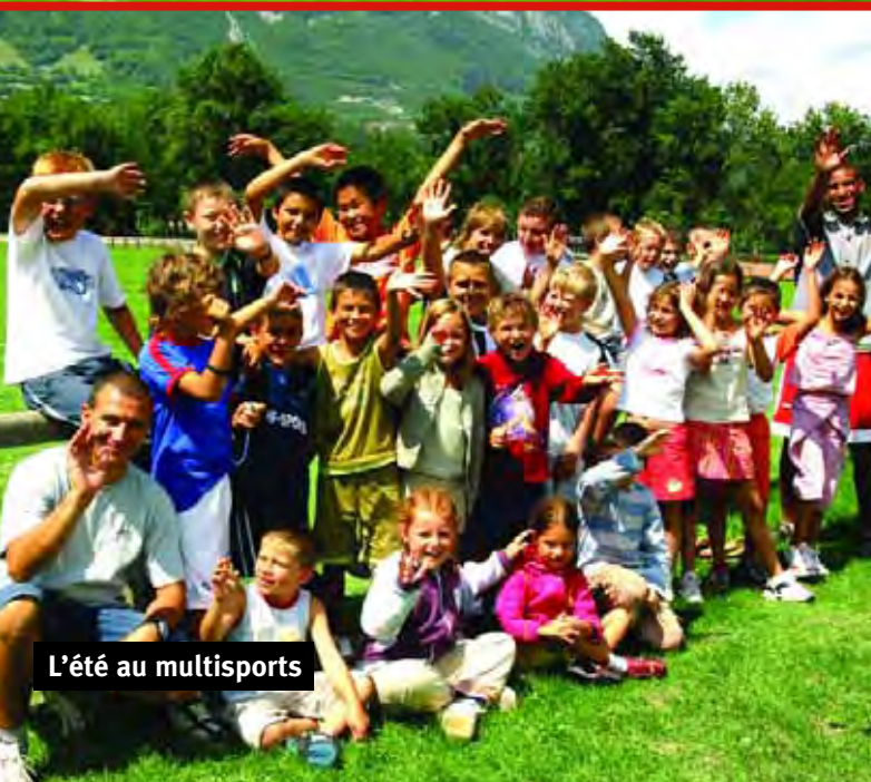
L'été au multisports