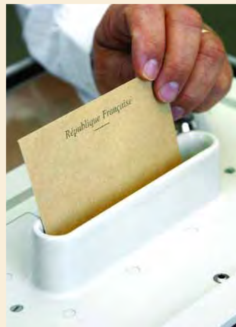
Une solution qui devrait sans doute voir le jour en 2008...

Pour autant, cette solution représente un coût non négligeable pour la commune — 50 000 euros environ — et si l'organisation des élections fait partie des compétences obligatoires d'une ville, cet investissement n'apparaît pas comme une priorité immédiate. Par ailleurs, le changement des habitudes nécessite des actions pédagogiques, notamment de terrain. Solution difficilement envisageable compte tenu de l'incertitude du calendrier électoral. Des élections municipales à l'automne 2007 par exemple laisseraient en effet trop peu de temps à l'information nécessaire.