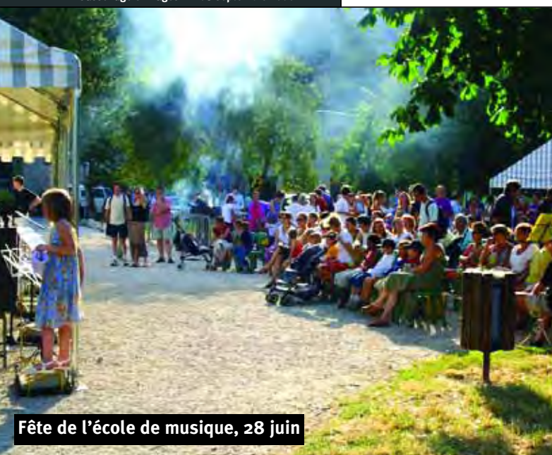
Fête de l'école de musique, 28 juin

Sassenage en Pages n° 108 septembre 2006