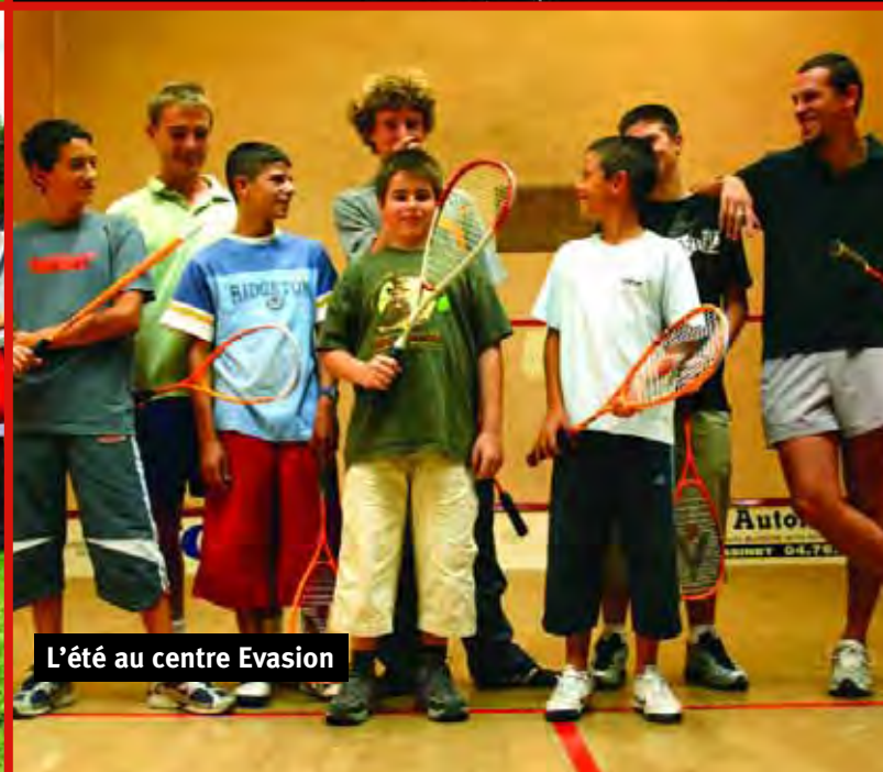
L'été au centre Evasion