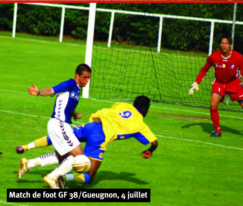
Match de foot GF 38/Gueugnon, 4 juillet