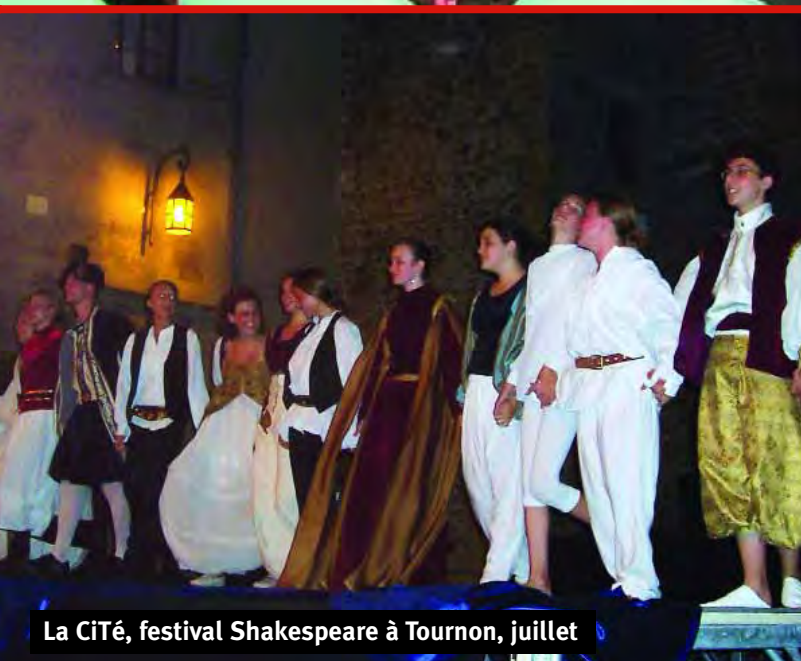
La CiTé, festival Shakespeare à Tournon, juillet