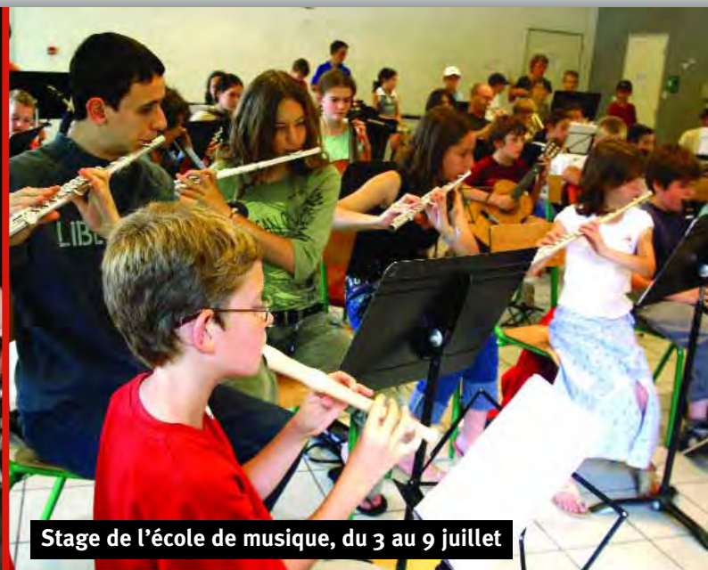
Stage de l'école de musique, du 3 au 9 juillet