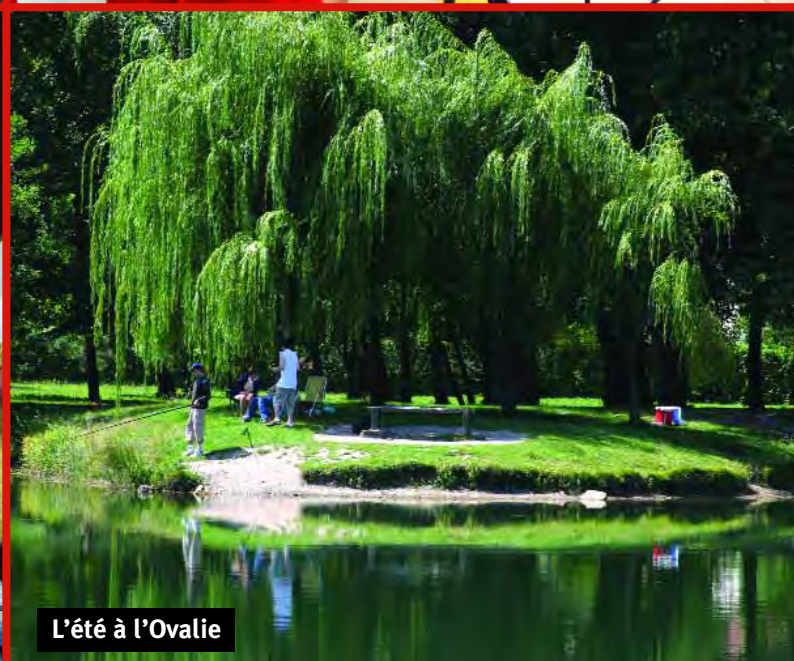
L'été à l'Ovalie