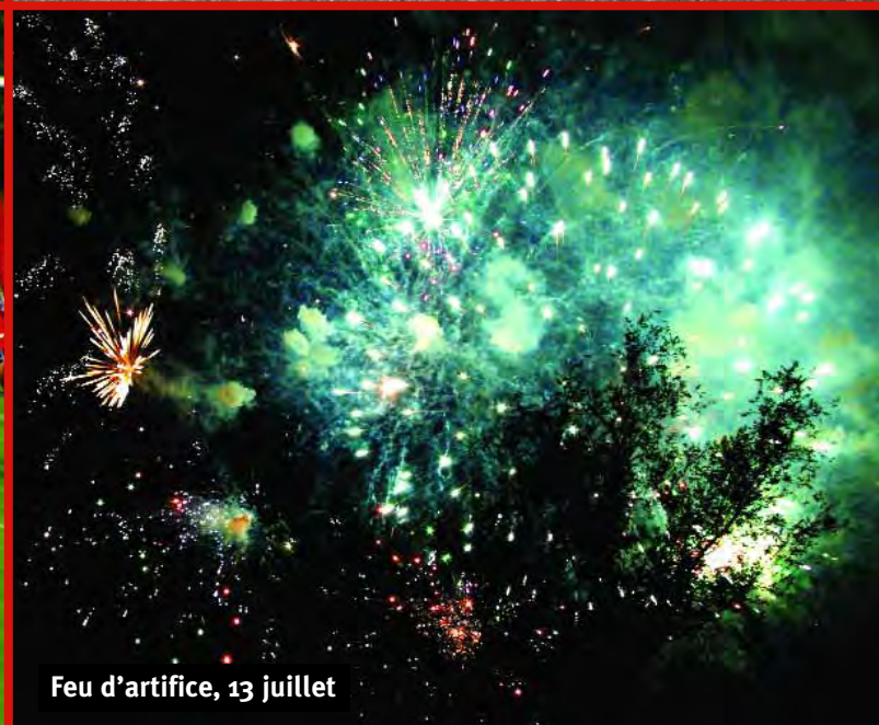
Feu d'artifice, 13 juillet