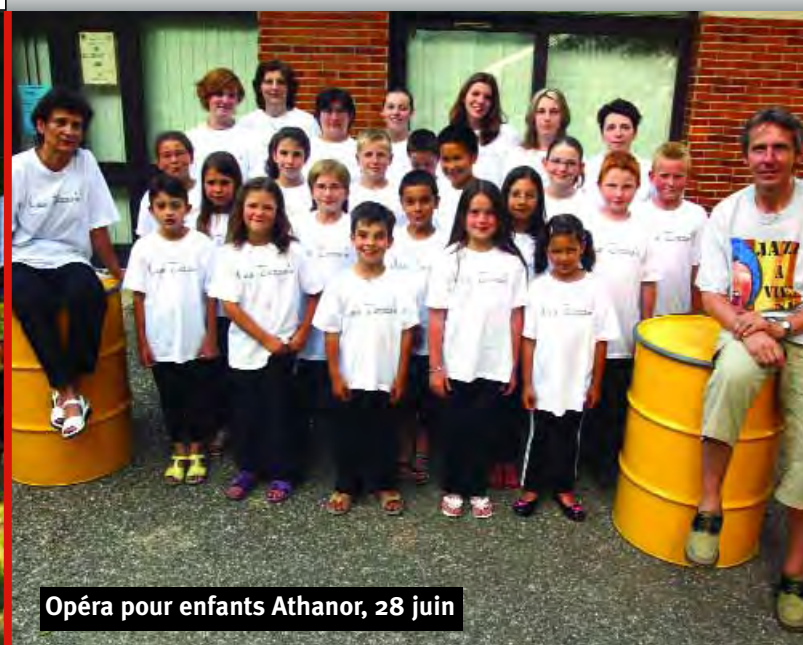
Opéra pour enfants Athanor, 28 juin