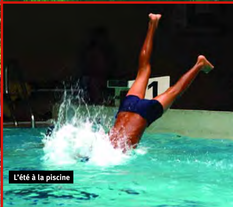
L'été à la piscine