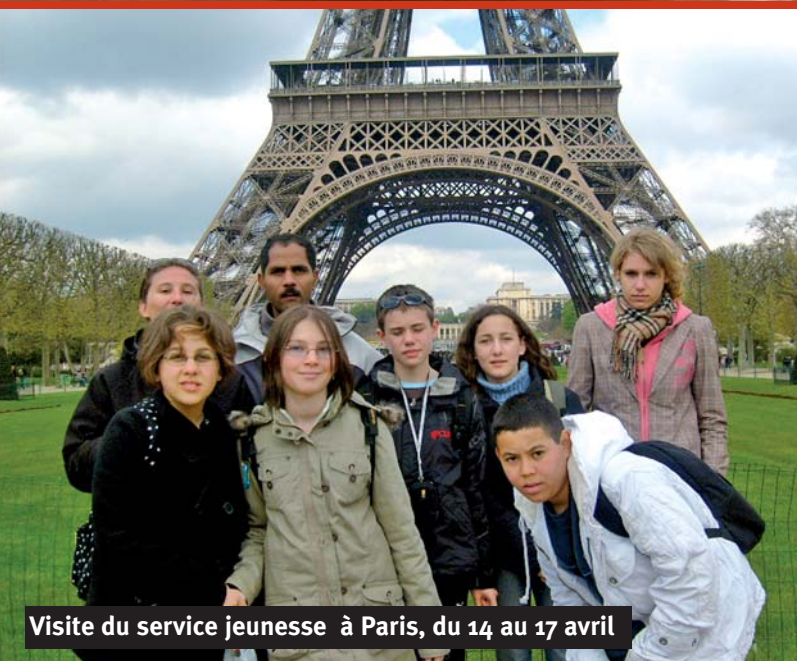
Visite du service jeunesse à Paris, du 14 au 17 avril