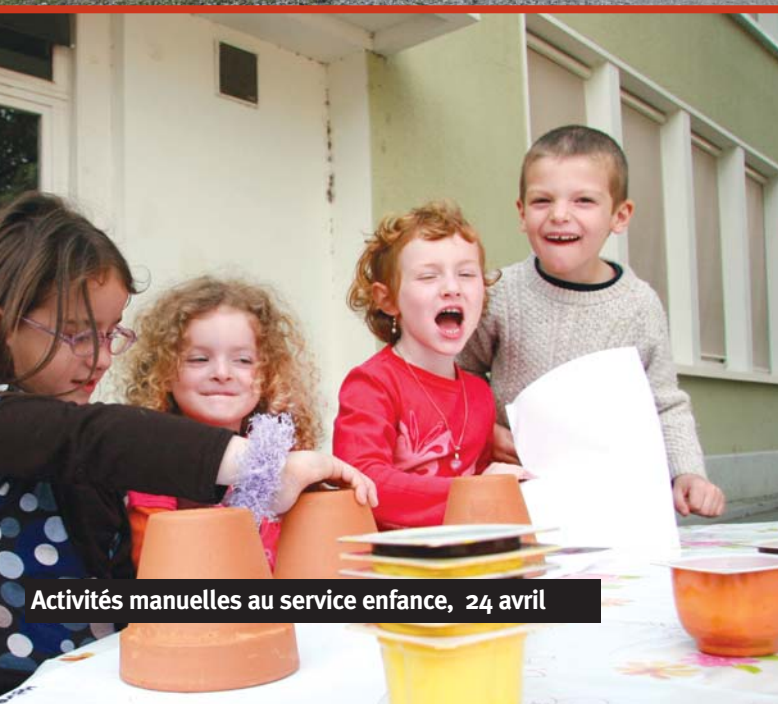
Activités manuelles au service enfance, 24 avril