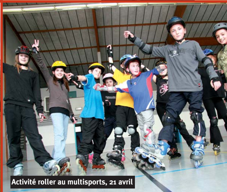
Activité roller au multisports, 21 avril