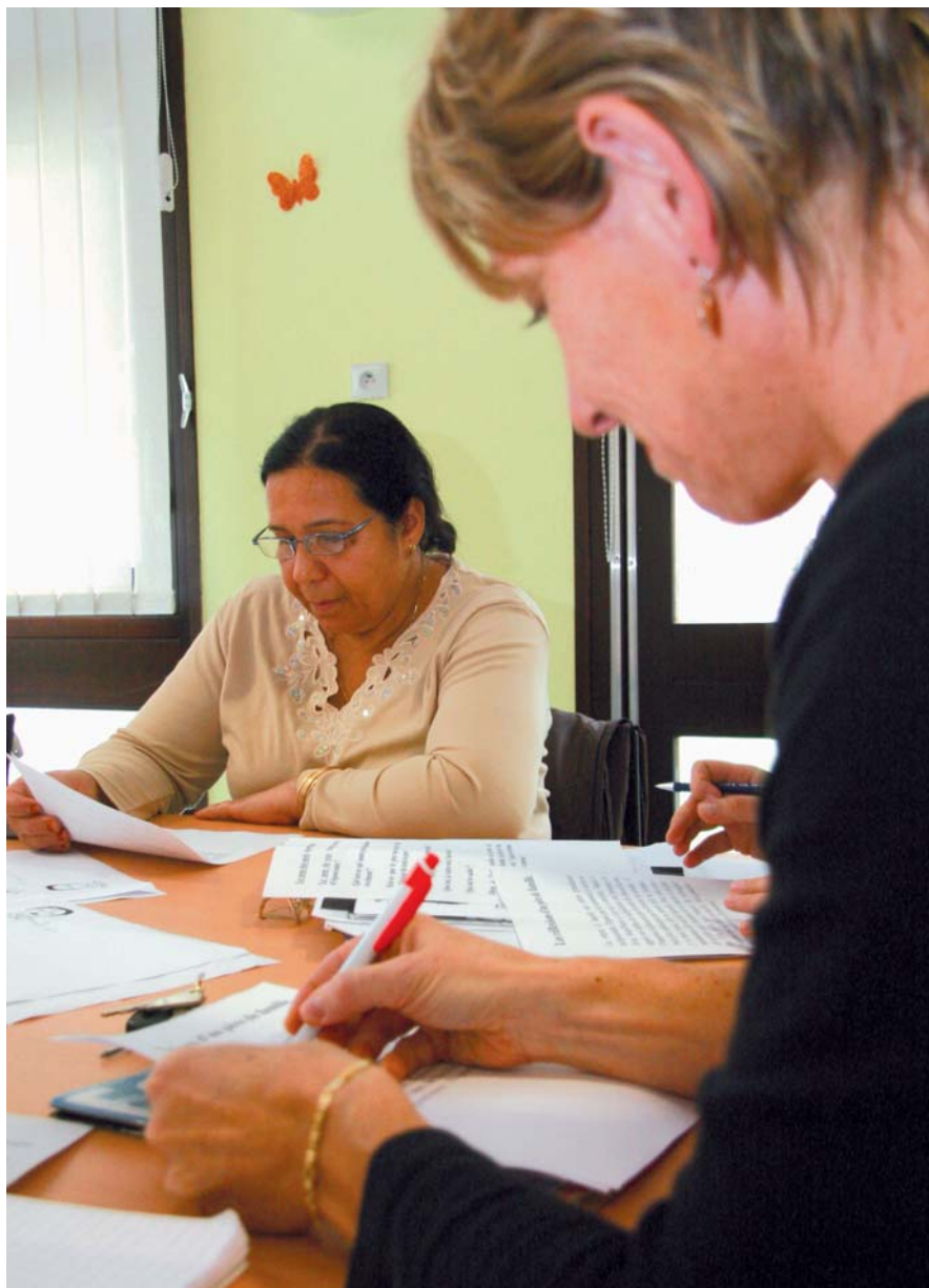
▲ Atelier de français à l'Espace familles

« La solidarité est ce sentiment qui pousse les hommes à s'apporter une aide mutuelle »