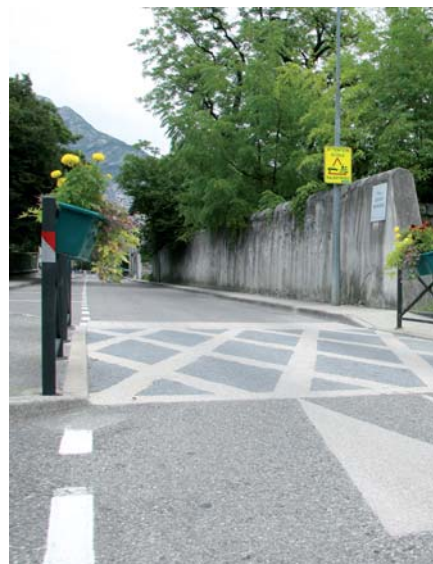
▲ Rue François Gerin

Des aménagements qui devaient toutefois être modifiables dans un premier temps au regard de l'expérience au quotidien des riverains, et après l'évaluation des effets du dispositif ; dispositif qui, dans un second temps, pourra être renforcé par des aménagements durables (bordures, mobilier définitif), voire dissuasifs (plateaux surélevés qui causent néanmoins des nuisances sonores importantes).