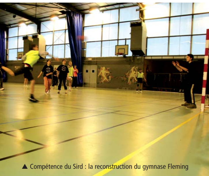
▲ Compétence du Sird : la reconstruction du gymnase Fleming