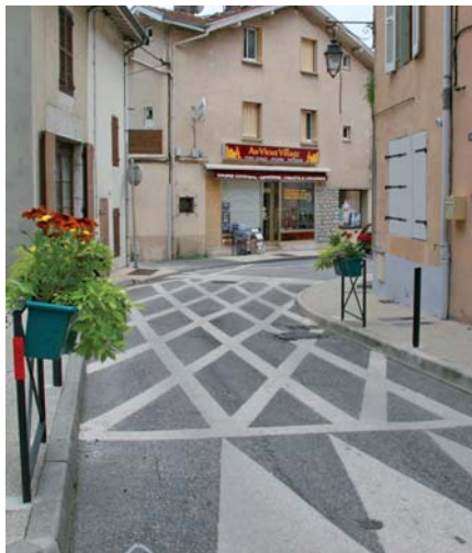
▲ Rue du Vercors

solutions leur étaient rapidement soumises lors d'une réunion publique en date du 21 janvier dernier : allonger de façon significative la durée du feu rouge de la rue François Gerin afin de ralentir le passage des conducteurs, mais aussi réduire ponctuellement des largeurs de chaussée par du mobilier urbain, et renforcer la signalisation au sol et verticale... Autant d'éléments censés obliger les conducteurs à lever le pied et peut-être même à reprendre le grand axe routier, à savoir l'avenue de Valence.