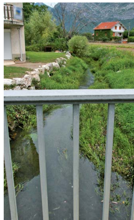
▲ La Petite Saône au niveau de la rue du Vinay, sujette à un épisode de pollution.

L undi 11 août, un habitant du quartier de l'Ovalie signalait de fortes odeurs d'hydrocarbure. Vérification faite, le ruisseau la Petite Saône présentait effectivement en plusieurs points des traces d'irisation en surface, preuve d'une pollution. Un barrage flottant était rapidement installé au niveau du pont du chemin du Vinay. Par ailleurs, la régie d'assainissement de La Métro recherchait la cause de cette pollution. Après enquête, aucune source industrielle, domestique ou agricole n'a été incriminée. Les « fautifs » seraient à la fois un orage soutenu ayant lessivé les routes communales de la ville de Fontaine, ainsi que des hydrocarbures passés par-dessus les barrages flottants. Plusieurs pompages en surface ont eu raison de cette alerte.