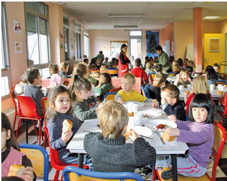
▲ HAMEAU DU CHÂTEAU La cantine au moment du déjeuner.

Changement de fenêtres en maternelle (économies d'énergie). Ouverture de classe en élémentaire et donc nouveau mobilier.