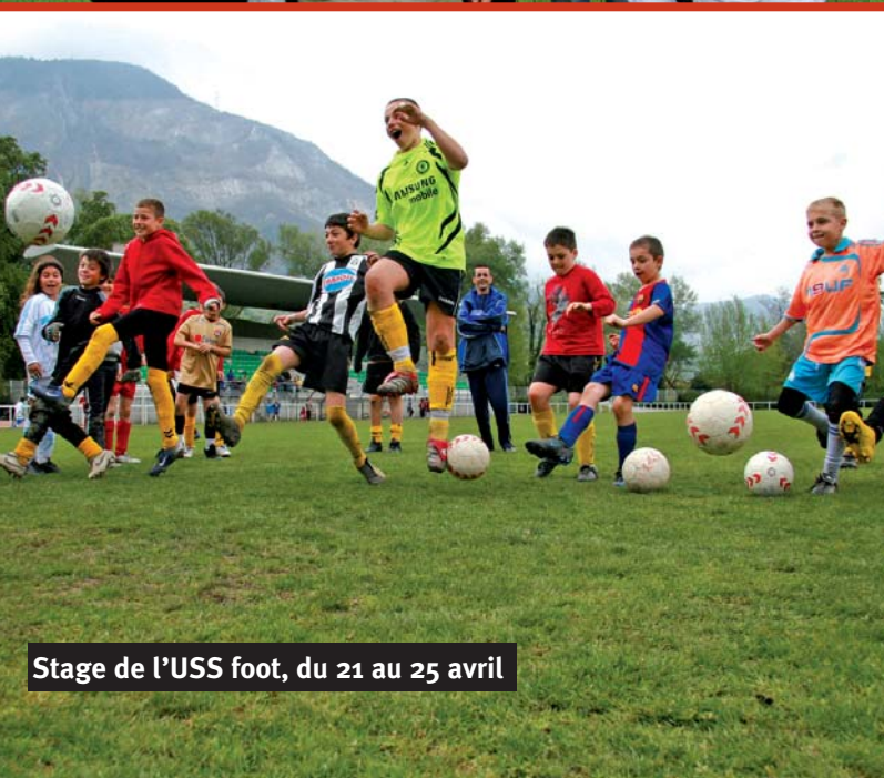
Stage de l'USS foot, du 21 au 25 avril