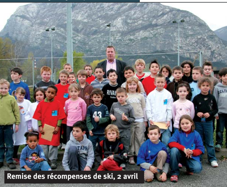
Remise des récompenses de ski, 2 avril