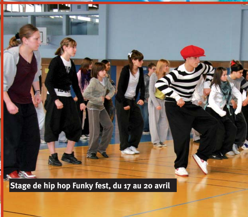
Stage de hip hop Funky fest, du 17 au 20 avril