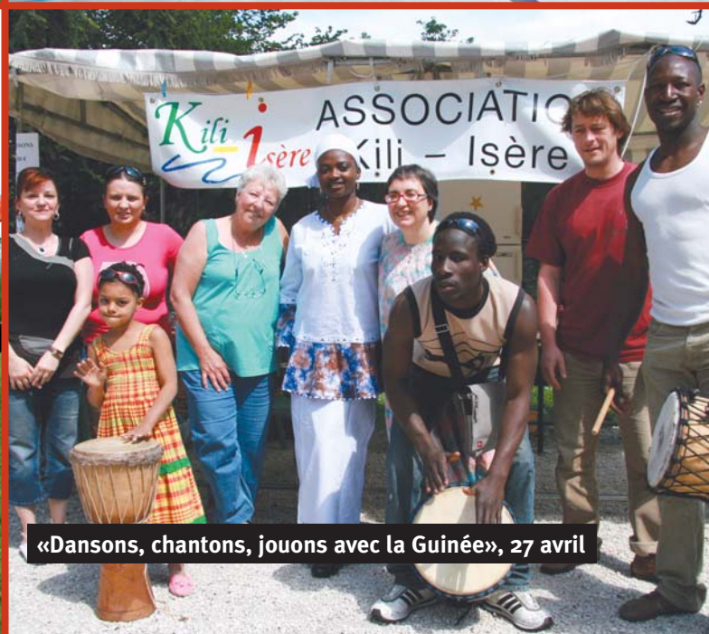
«Dansons, chantons, jouons avec la Guinée», 27 avril