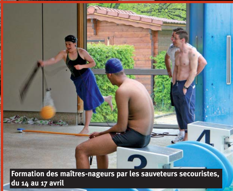
Formation des maîtres-nageurs par les sauveteurs secouristes, du 14 au 17 avril