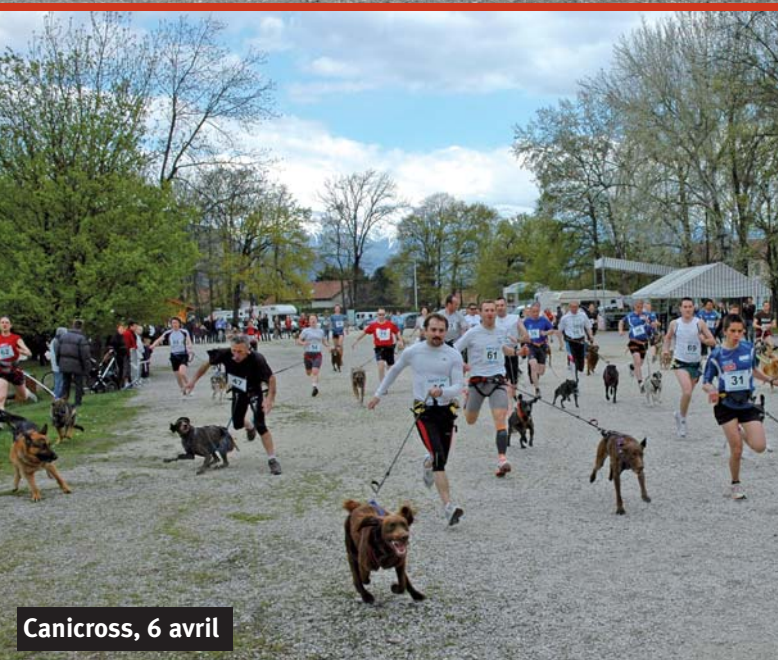
Canicross, 6 avril