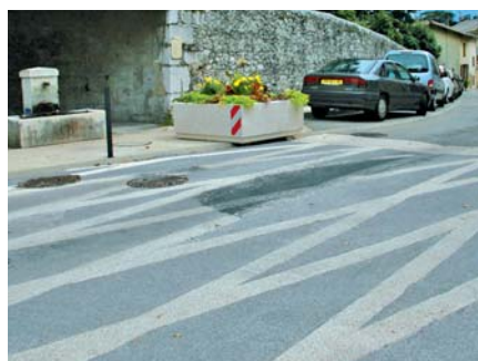
▲ Rue du Vercors, la résine sera reprise.

aux riverains puisque la résine est remontée, occasionnant des odeurs fort désagréables. Elle sera donc prochainement reprise, nécessitant la fermeture ponctuelle de la rue, à une date encore inconnue à ce jour.