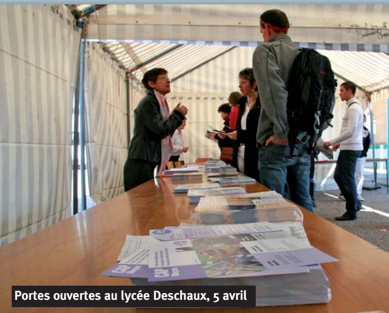
Portes ouvertes au lycée Deschaux, 5 avril