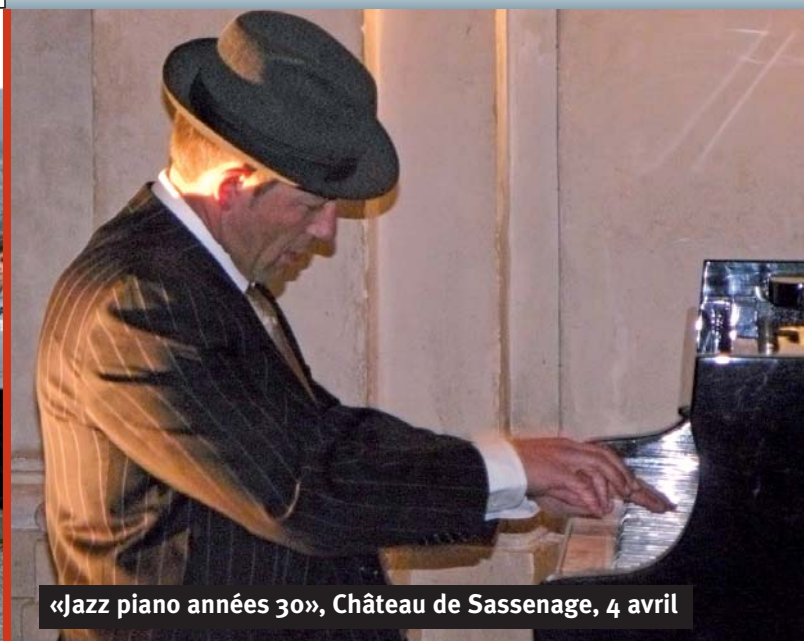
«Jazz piano années 30», Château de Sassenage, 4 avril