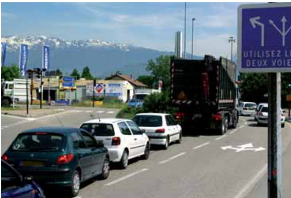
▲ La création d'un parc-relais permettra de désengorger les voiries communales en favorisant le covoiturage.