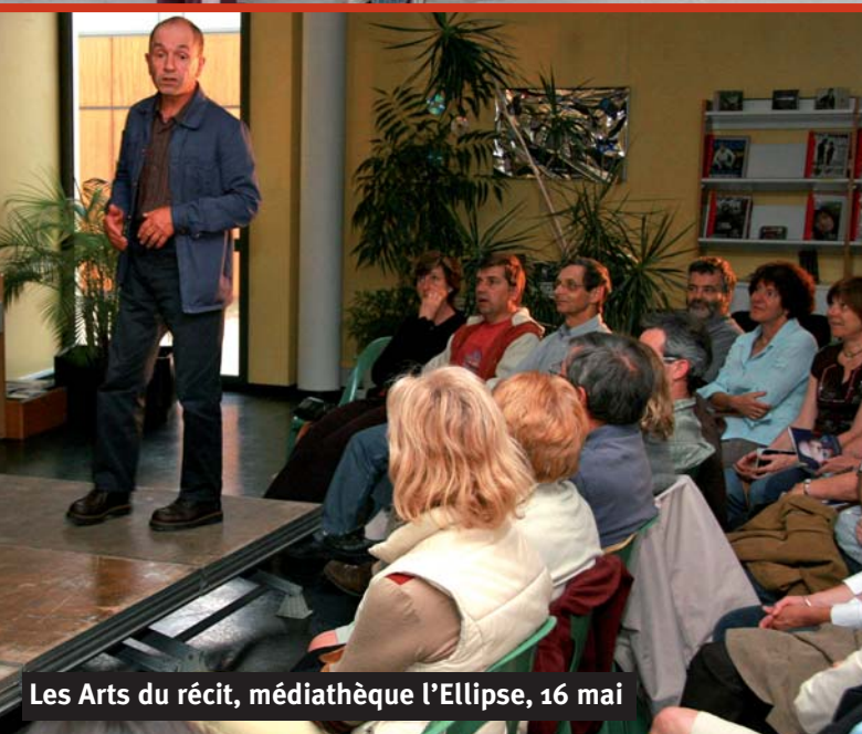
Les Arts du récit, médiathèque l'Ellipse, 16 mai