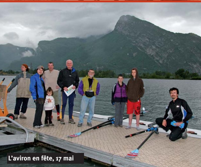
L'aviron en fête, 17 mai