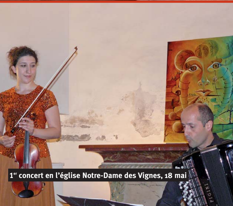
1 er concert en l'église Notre-Dame des Vignes, 18 mai