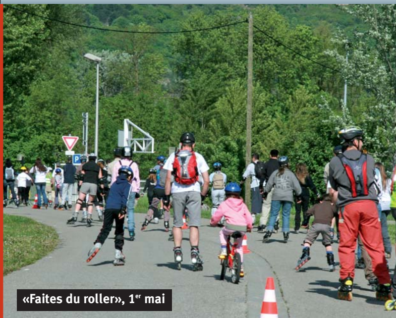
«Faites du roller», 1 er mai