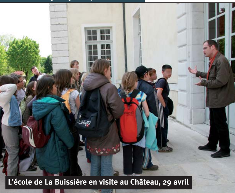
L'école de La Buissière en visite au Château, 29 avril