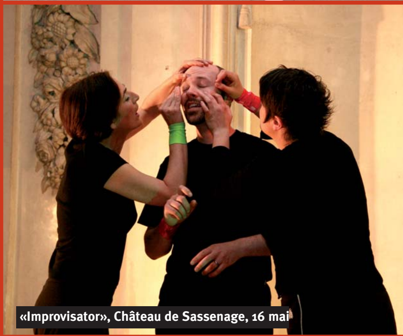
«Improvisator», Château de Sassenage, 16 mai