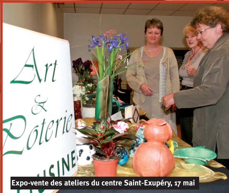
Expo-vente des ateliers du centre Saint-Exupéry, 17 mai