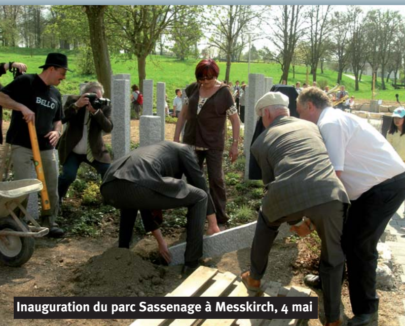
Inauguration du parc Sassenage à Messkirch, 4 mai