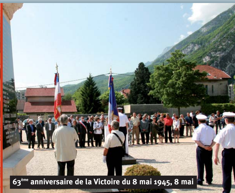
63 ème anniversaire de la Victoire du 8 mai 1945, 8 mai