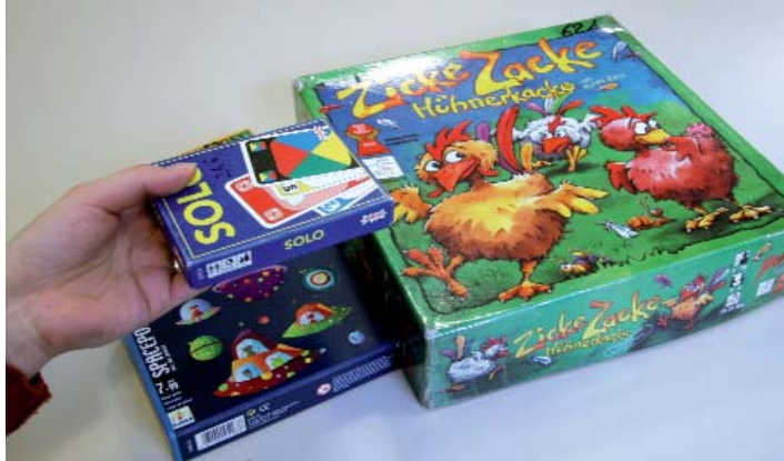
Exemple de jeux présents à la ludothèque et qui seront prêtés

enfants de cycle 2 (grande section de maternelle, CP et CE1) et qui pourrait intéresser le temps scolaire, sous conditions. En somme, les idées ne manquent pas. Il reste encore un certain nombre de projets à mettre en place ou à améliorer, notamment grâce à l'expérience des différents acteurs.