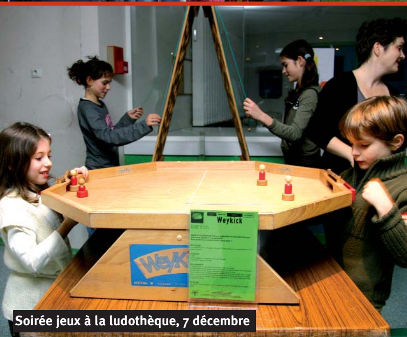
Soirée jeux à la ludothèque, 7 décembre