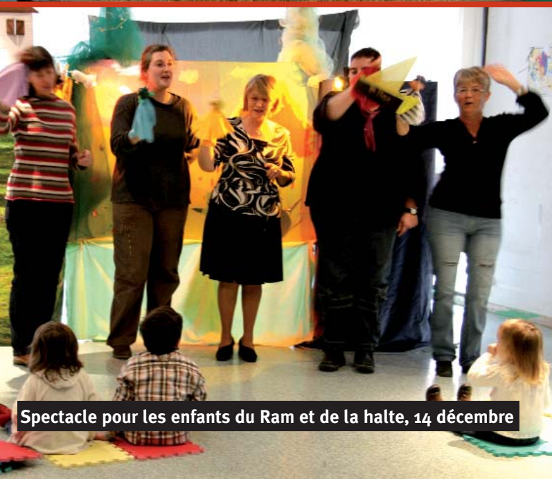
Spectacle pour les enfants du Ram et de la halte, 14 décembre