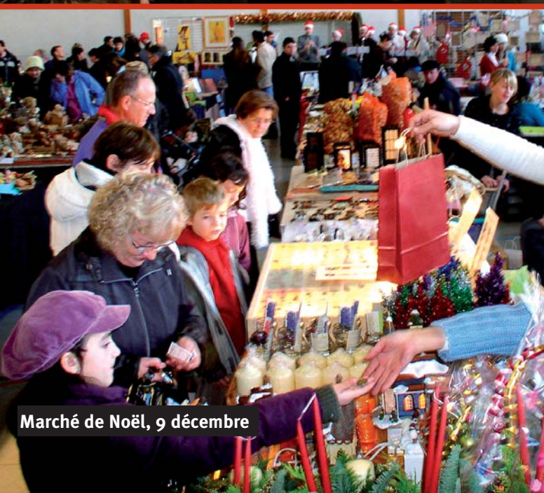
Marché de Noël, 9 décembre