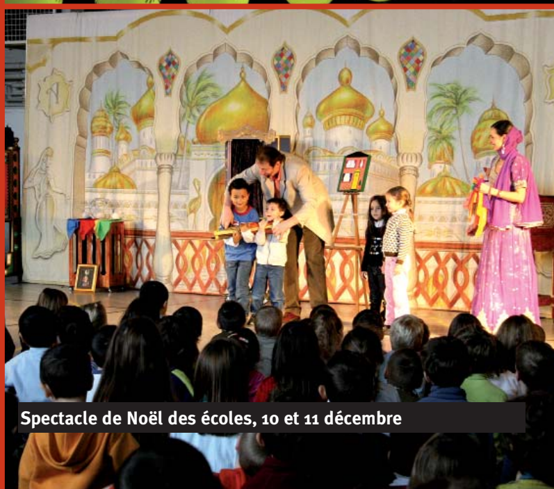
Spectacle de Noël des écoles, 10 et 11 décembre