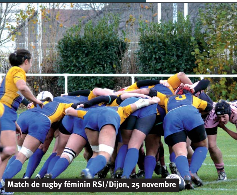
Match de rugby féminin RSI/Dijon, 25 novembre