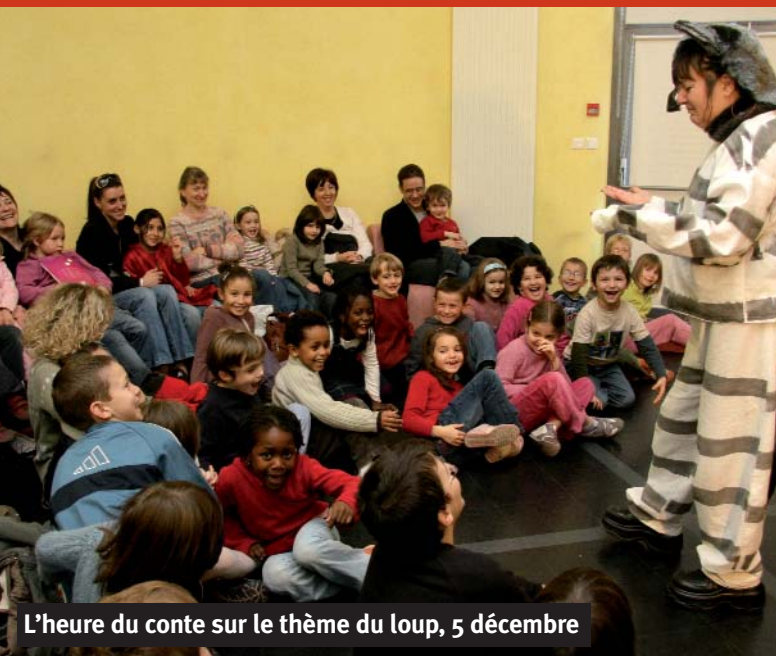
L'heure du conte sur le thème du loup, 5 décembre