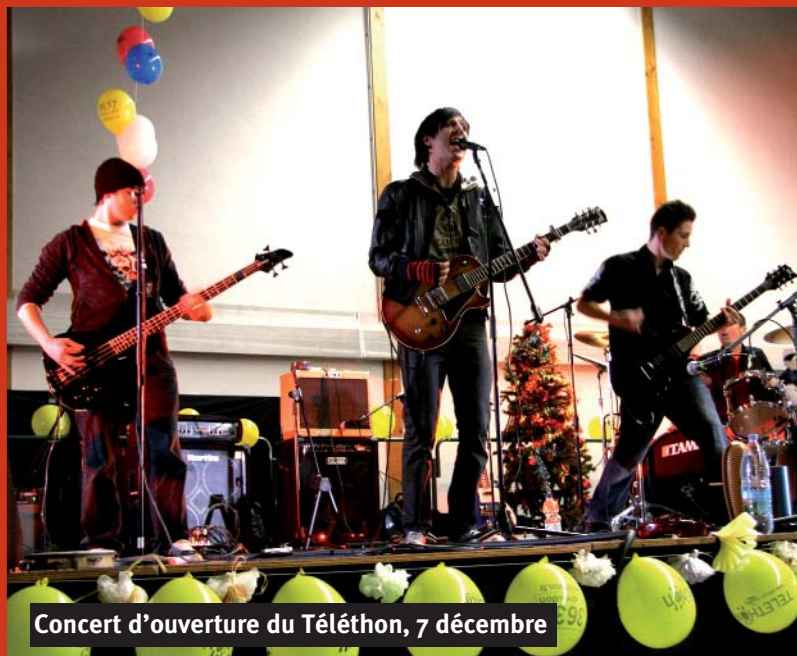
Concert d'ouverture du Téléthon, 7 décembre