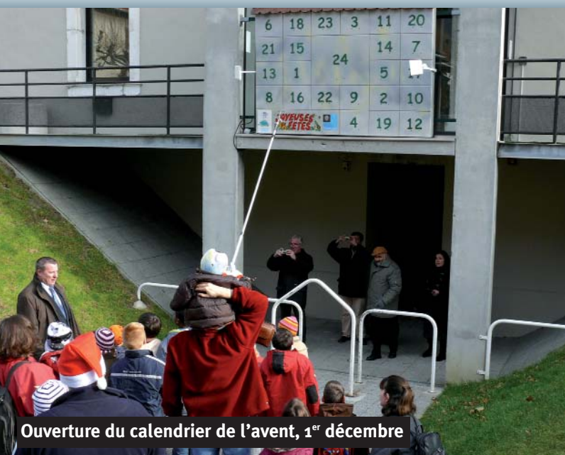
Ouverture du calendrier de l'avent, 1 er décembre