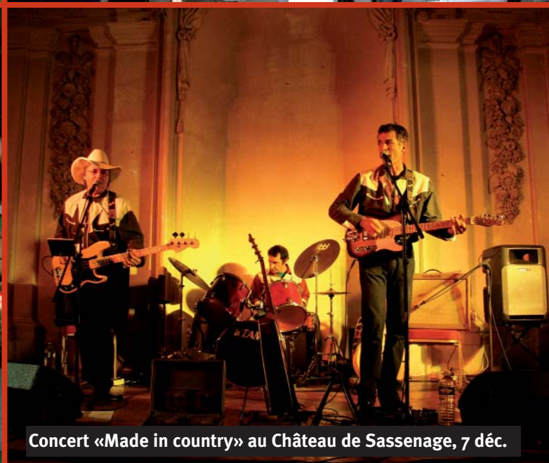
Concert «Made in country» au Château de Sassenage, 7 déc.