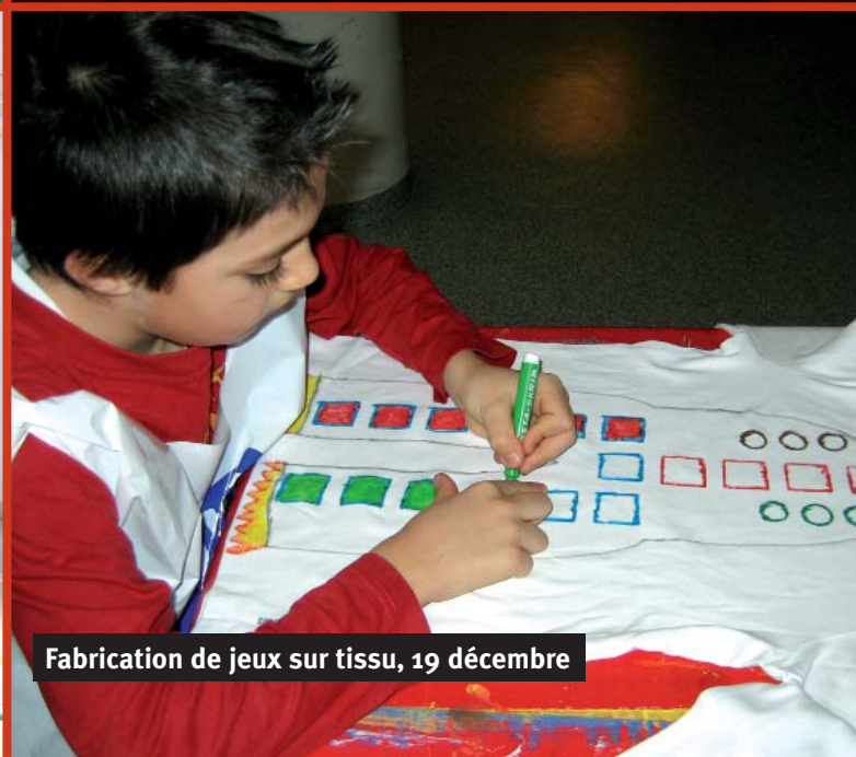
Fabrication de jeux sur tissu, 19 décembre