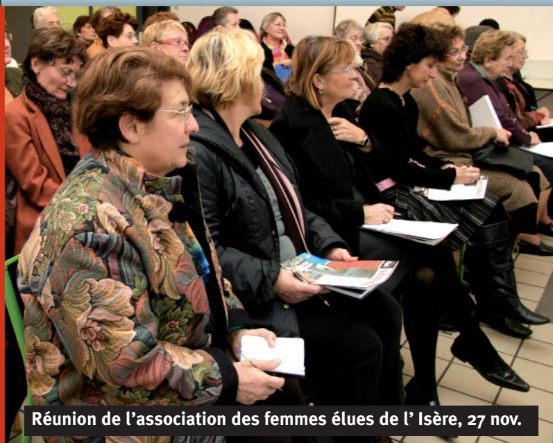
Réunion de l'association des femmes élues de l'Isère, 27 nov.