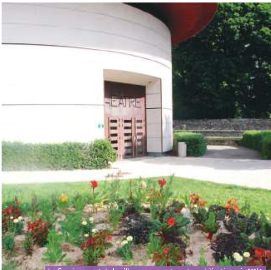
Le fleurissement de la ville comme vecteur de mobilisation générale