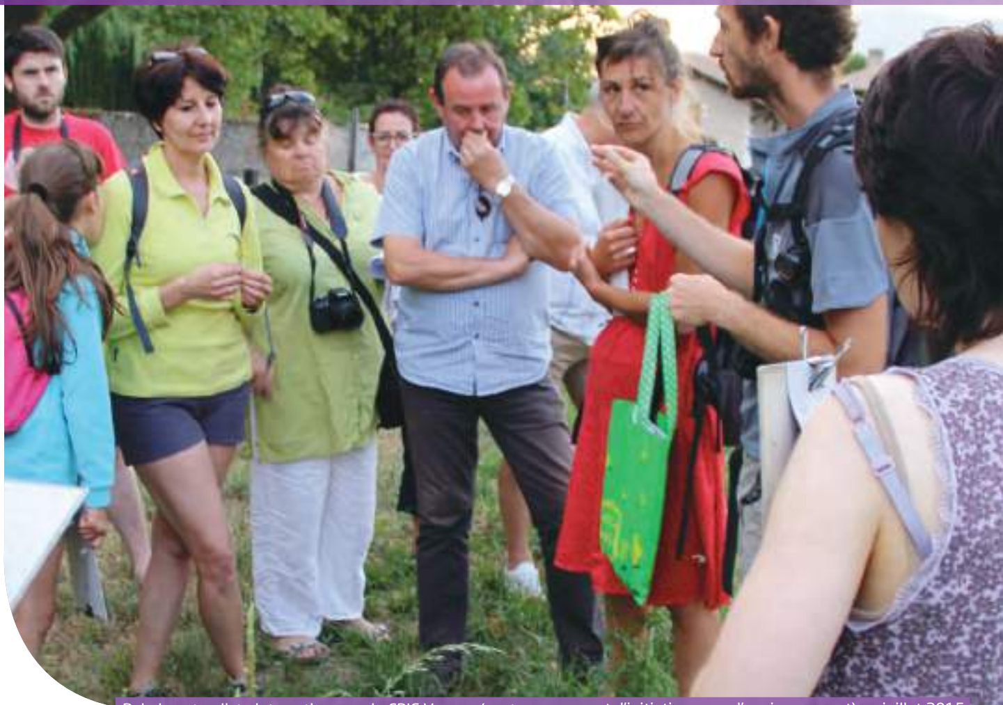
Balade naturaliste interactive avec le CPIE Vercors (centre permanent d'initiatives pour l'environnement) en juillet 2015

« Choisir une action, dans le périmètre de leurs délégations respectives et dans un champ temporel allant de la mémoire récente au futur proche », tel était le défi lancé aux adjoints (1) de la Ville pour illustrer leur implication en matière de développement durable.