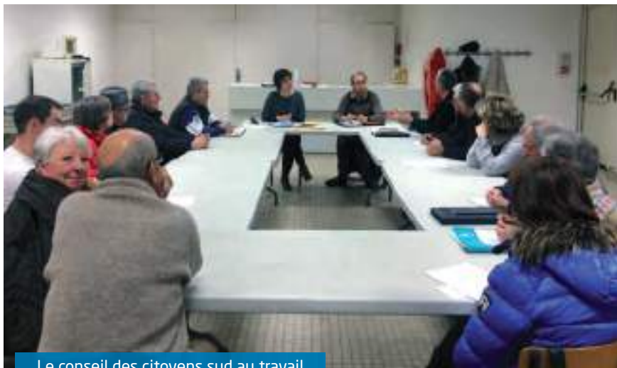
Le conseil des citoyens sud au travail

Après un retour sur les demandes formulées lors du dernier conseil des citoyens, les