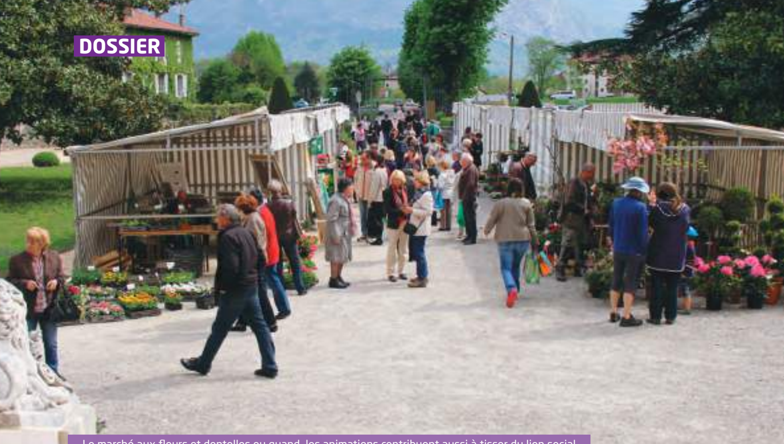
Le marché aux fleurs et dentelles ou quand les animations contribuent aussi à tisser du lien social