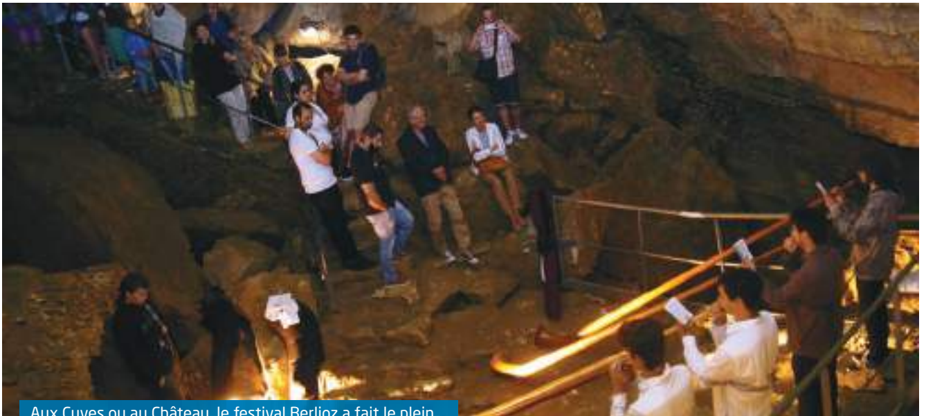
Aux Cuves ou au Château, le festival Berlioz a fait le plein

C omme chaque année à la même époque, il est d'usage de tirer le bilan de la saison touristique, et Sassenage ne déroge pas à la règle !