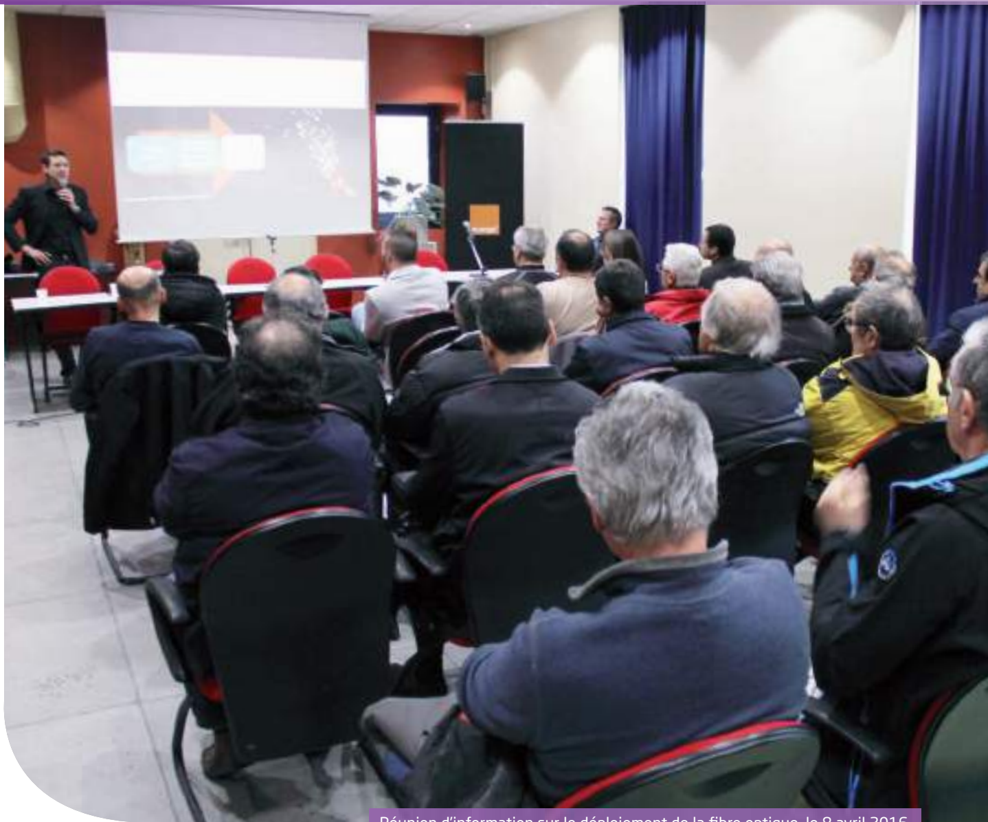
Réunion d'information sur le déploiement de la fibre optique, le 8 avril 2016

L e temps passe ! Cela fait maintenant huit ans que la Ville a mis officiellement en place des instances de démocratie participative et de proximité.