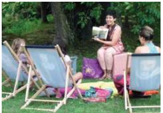
Lecture bucolique par la médiathèque dans le parc du Château