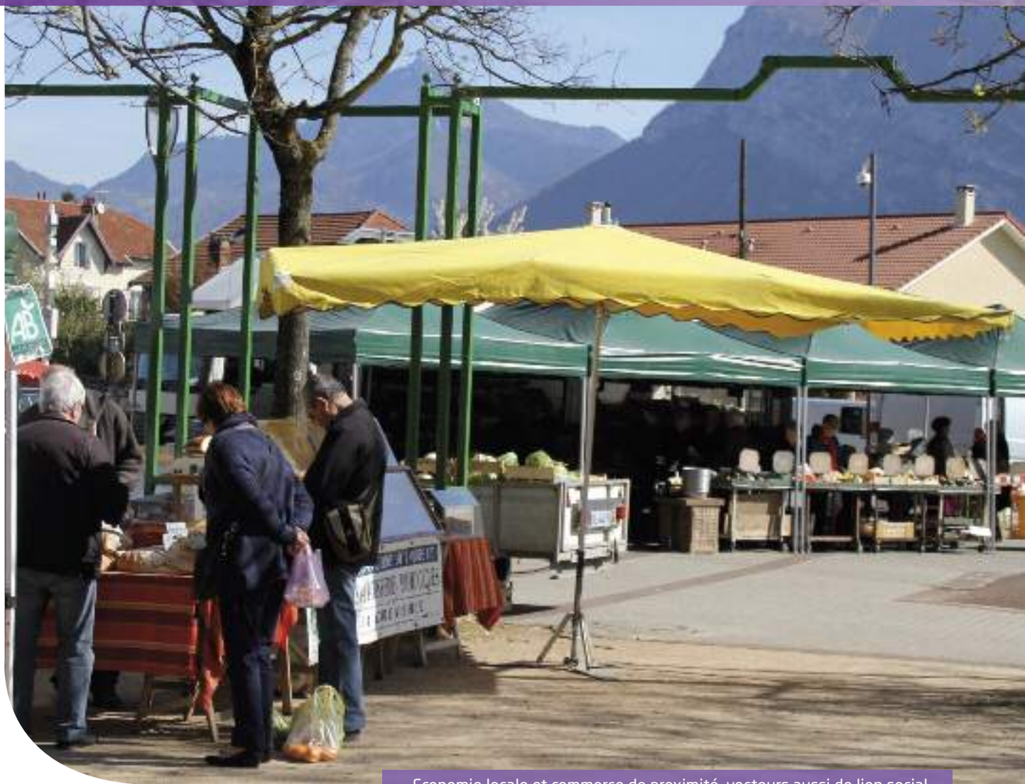
Economie locale et commerce de proximité, vecteurs aussi de lien social

Le développement économique figure au rang des compétences récemment transférées aux intercommunalités. Toutefois, il est resté à Sassenage une préoccupation majeure, illustrée notamment par l'élection d'un nouvel adjoint délégué à l'activité économique, au commerce et à l'artisanat, et par l'attention ainsi portée par l'équipe municipale à être un acteur clé de proximité en matière de vitalité économique, et par là même d'emploi.