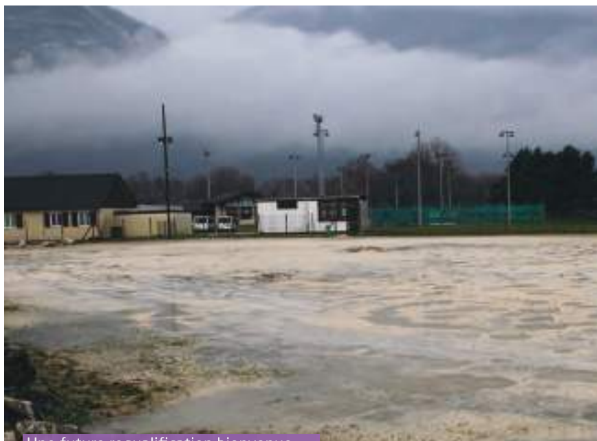
Une future requalification bienvenue...

Les abeilles y trouveront assurément leur bonheur, et pas seulement elles !