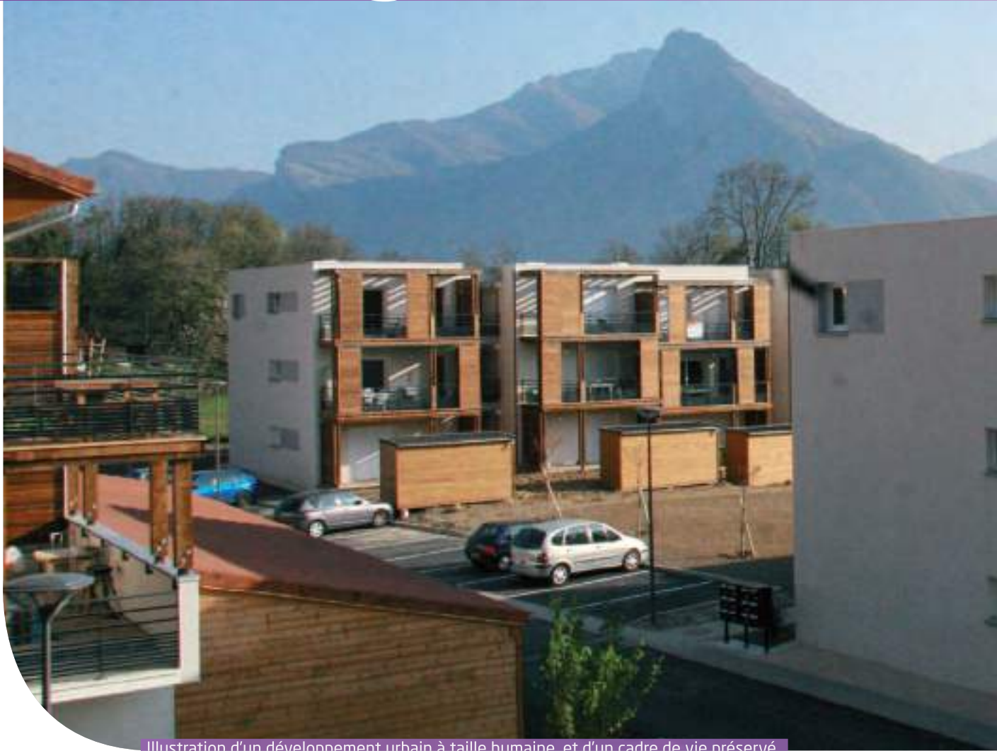
Illustration d'un développement urbain à taille humaine, et d'un cadre de vie préservé

avec un peu plus de 10 % de logements sociaux, Sassenage est loin du seuil des 25 % fixé par la loi SRU (loi relative à la solidarité et au renouvellement urbain), mais partant d'un taux de 6,60 % en 2001, la progression est bel et bien là, et appelée à se poursuivre.