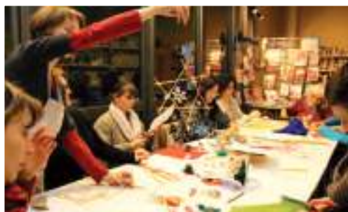
Atelier de décorations de Noël à l'Ellipse