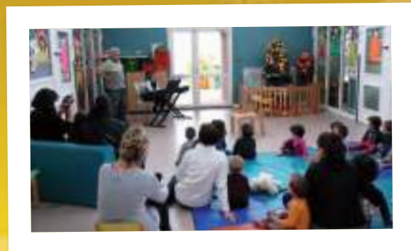
Mini-concert au multi-accueil