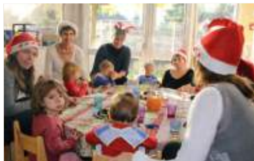
Goûter au Ram