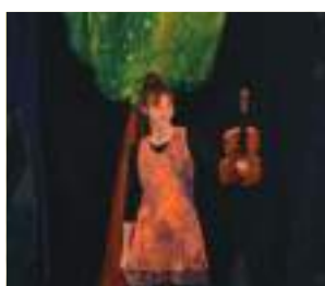
Spectacle à l'Ellipse