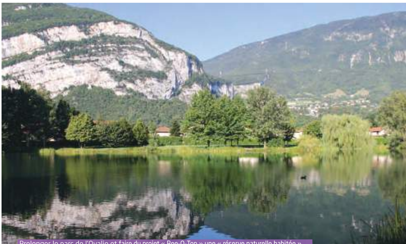
Prolonger le parc de l'Ovalie et faire du projet « Bee-O-Top » une « réserve naturelle habitée »

Créer des espaces extérieurs de rencontre et de partage pour favoriser le lien social de proximité