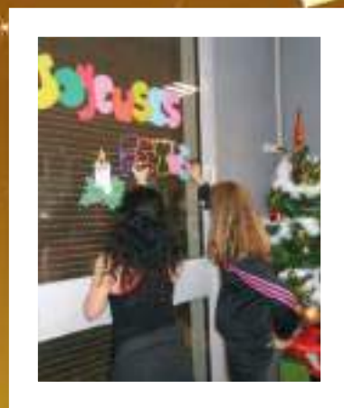
Atelier créatif Jeunesse