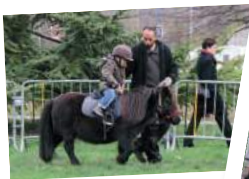
Grand jeu de Noël