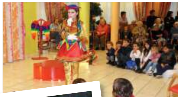
Le Noël de l'éhpap