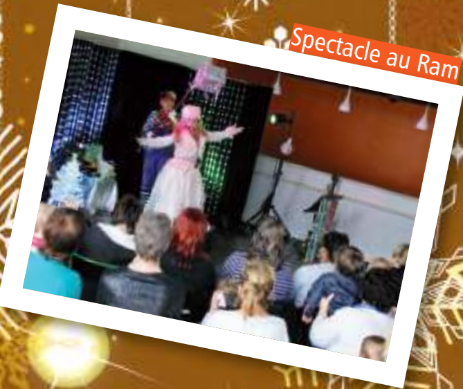
Spectacle au Ram