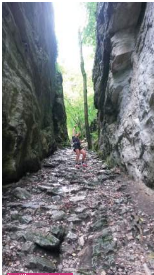
Le célèbre coup du sabre

INFOS ET INSCRIPTIONS : ACS, JEAN-PATRICK BOLF, 06 72 70 07 04 ET WWW.ACSASSENAGE.FR . TARIFS 10 KM : 10 € EN PRÉ-VENTE, ET 12 € SUR PLACE. TARIFS : 20 KM : 12 € EN PRÉ-VENTE ET 14 € SUR PLACE.