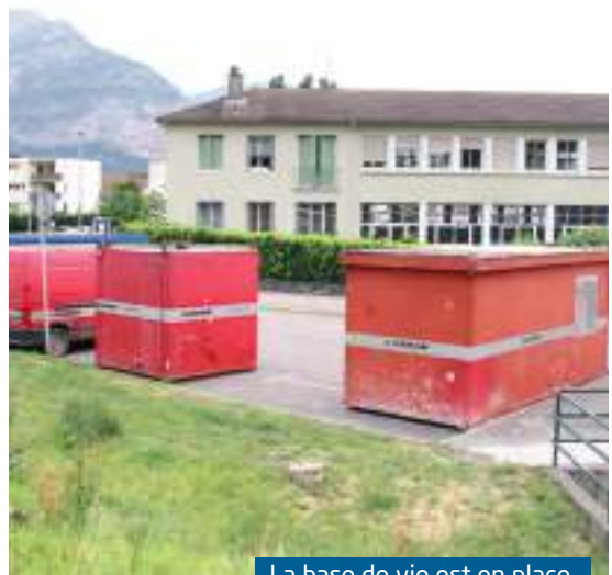
La base de vie est en place

3) La déconstruction et la reconstruction des digues interviendront entre la passerelle du lavoir et la confluence avec le canal de la petite Saône. Des aménagements de surface, paysagers, et l'amélioration de l'éclairage seront réalisés, le tout s'étalant jusqu'en 2017... ●