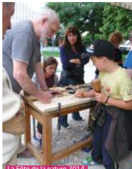
La Fête de la nature 2014

Rendez-vous est pris dimanche 4 octobre avec la nature ! ●