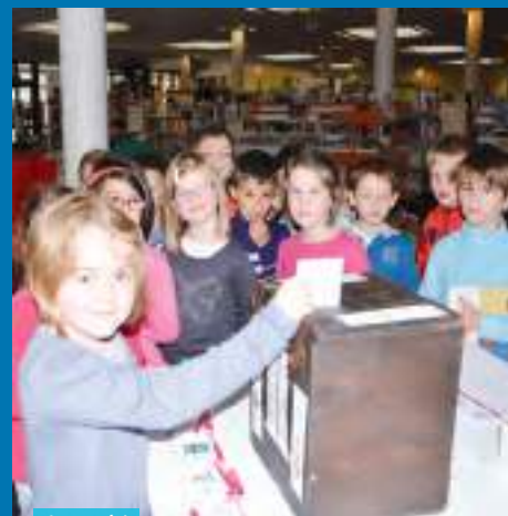
A voté !

Le moins que l'on puisse dire, c'est que le hasard fait bien les choses !