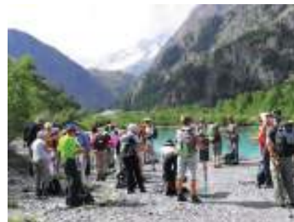
(1) gymnastique, yoga, country, acti-marche, randonnée pédestre

Bravo donc à cette association qui bouge pour vous faire bouger ! ●