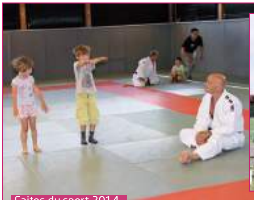
Faites du sport 2014