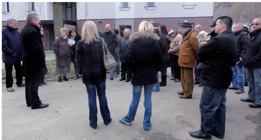
▲ Visite de quartier à Pra-Paris, samedi 7 janvier

Du côté des Platanes, le problème de boue sur les abords des immeubles préoccupe, ou de voitures épaves qui restent stationnées pendant des mois, mais aussi de connexion internet avec un débit faible qui ne permet pas l'accès aux chaînes de télévision. Le maire rassure les riverains en les informant qu'un programme de câblage permettra à tous les Sassenageois d'être raccordés au très haut débit.