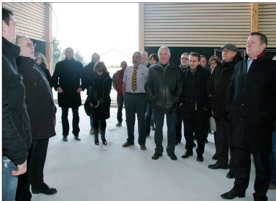
▲ L'auditoire est attentif aux explications données sur l'avancement du projet

Globalement, tous les acteurs s'accordent à dire que ce gymnase, le plus grand de la rive gauche du Drac, est un très bel outil au service du public. Les représentants des associations associés à la visite du 18 janvier sont impressionnés par le volume