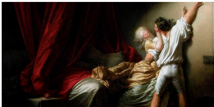
▲ Un conte libertin mettant en scène les jeux de la séduction

Imaginant que le marquis de Sassenage organise une soirée en souvenir de Déodat de Dolomieu, trois comédiens de la compagnie « Les pierres du ruisseau », accompagnés par le « Trio des menus plaisirs », vous invitent à basculer en 1817. Dans le grand salon du Château de Sassenage, les artistes interpréteront les personnages de