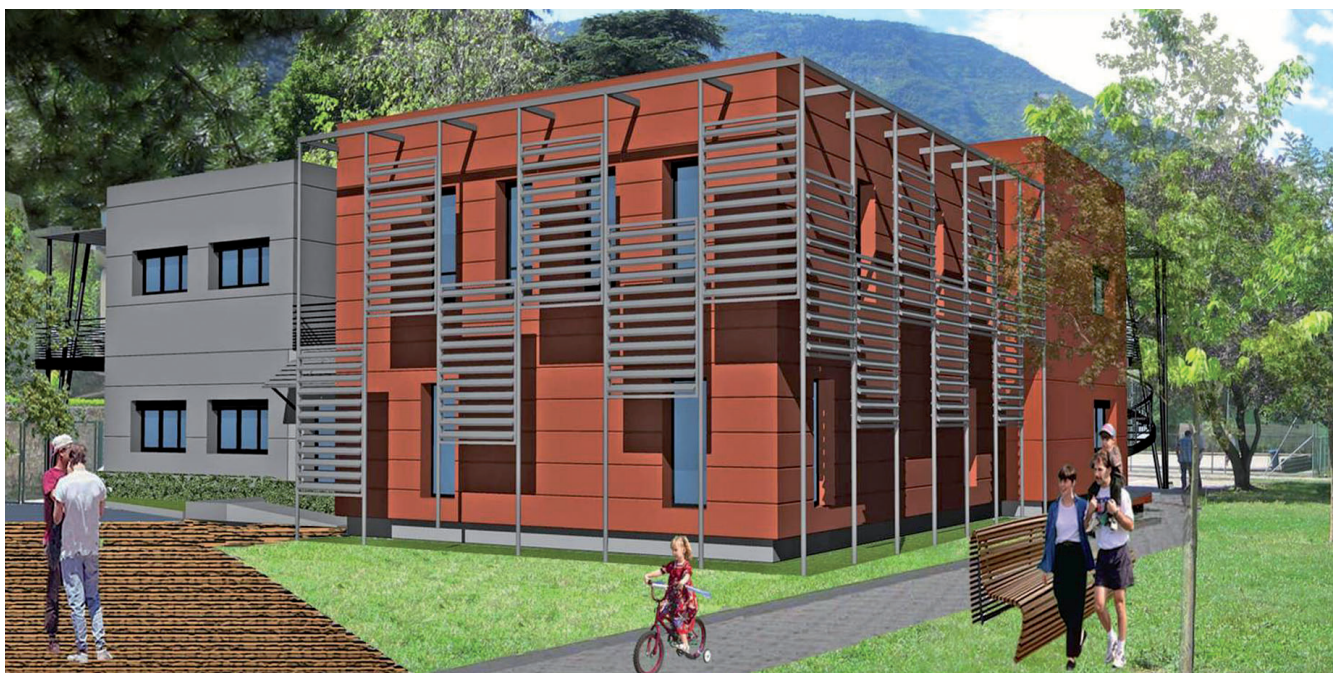
▲ Vue plein est du futur centre associatif

répondant aux critères d'insonorisation : 1 au rez-de-chaussée de 121 m 2 , et 2 au 1 er étage (56 m 2 et 37 m 2 ) pour l'accueil des activités associatives de groupe, notamment musicales - Création de vestiaires (1 par salle de danse) et de douches au 1 er étage. ■