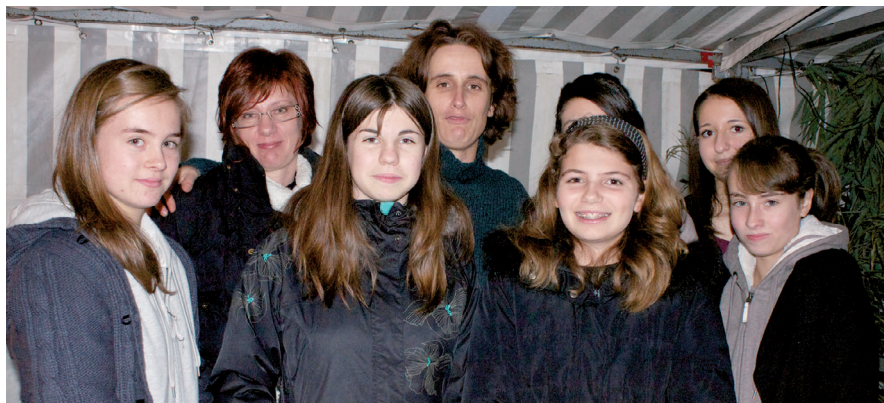
▲ Les élèves sont impatients de visiter Barcelone !

Cette action a permis de récolter 750 euros, mais au-delà de cette somme, c'est