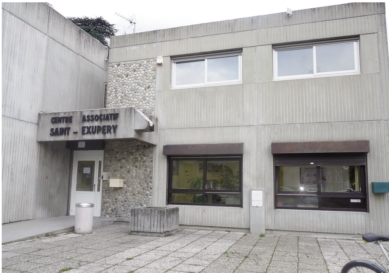
▲ Le centre associatif ne répond plus aujourd'hui aux normes en vigueur

S assenage peut s'enorgueillir de son tissu associatif riche et diversifié. Cette offre variée composée de soixante-dix-neuf associations à visée sportive, culturelle, artistique, informative, ou encore caritative, permet aux Sassenageois de pouvoir occuper une bonne partie de leur temps libre. Consciente du rôle prépondérant joué par les associations (renforcement de la cohésion sociale, animation de la vie de la cité...), la Ville les soutient en mettant à leur disposition gratuitement des salles, locaux administratifs ou autres équipements sportifs communaux. Un règlement de mise à disposition de ces biens vient d'ailleurs d'être présenté aux responsables associatifs.