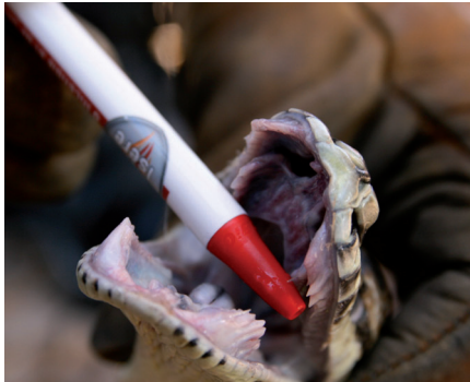
▲ Le serpent a été observé avant d'être emmené