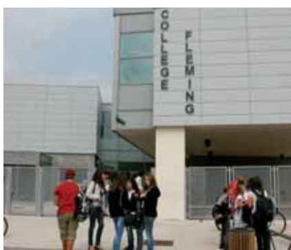
▲ Devant le collège Fleming