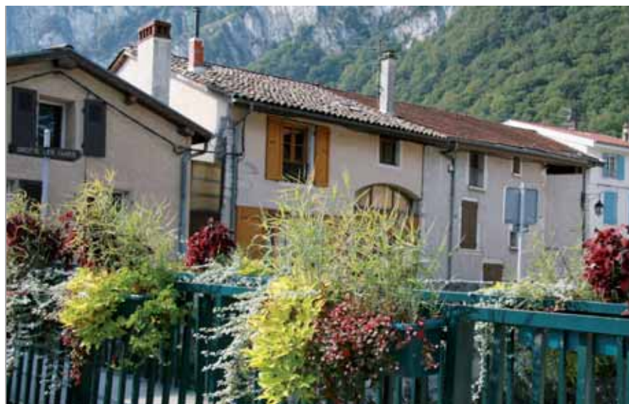
▲ Le vieux Bourg, un atout de Sassenage