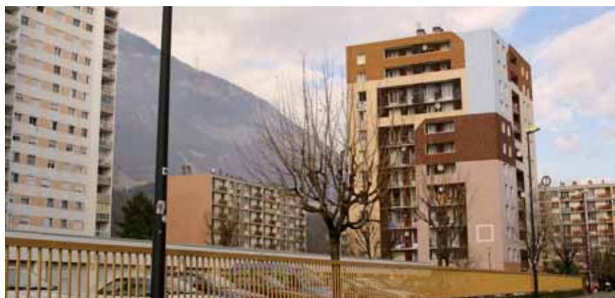
▲ Le hall et les paliers de la tour Vouillant vont faire peau neuve