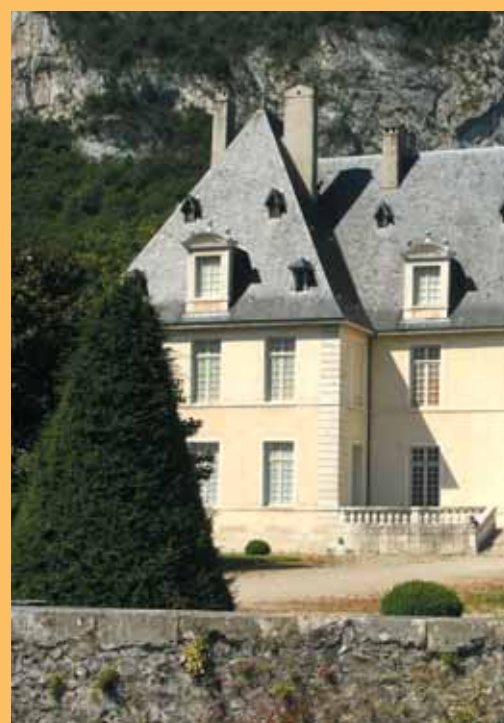
▲ Le Château

(1) Lire par ailleurs « Un hôtel en terre d'Ovalie »