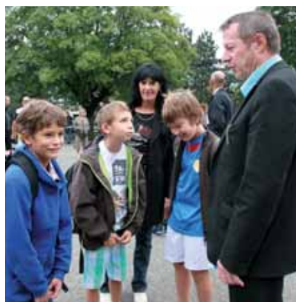
▲ Le maire et l'adjointe à l'école Vercors