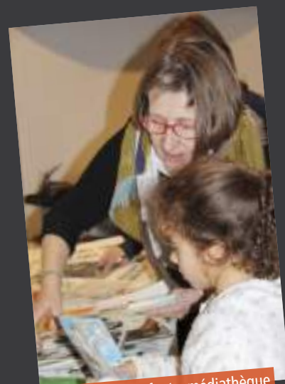
Atelier Noël enfants, médiathèque l'Ellipse, 13 décembre