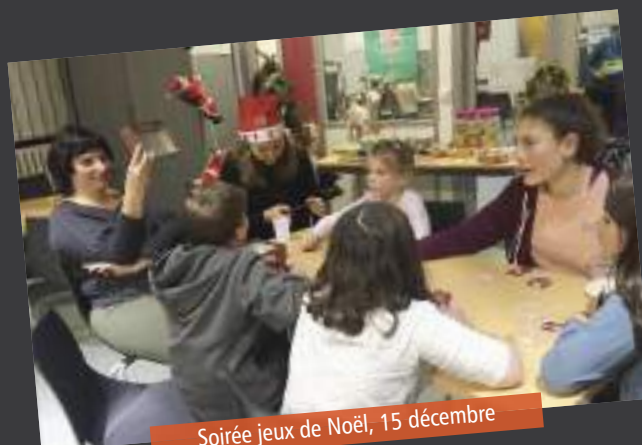
Soirée jeux de Noël, 15 décembre