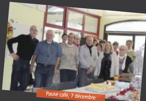
Pause café, 7 décembre