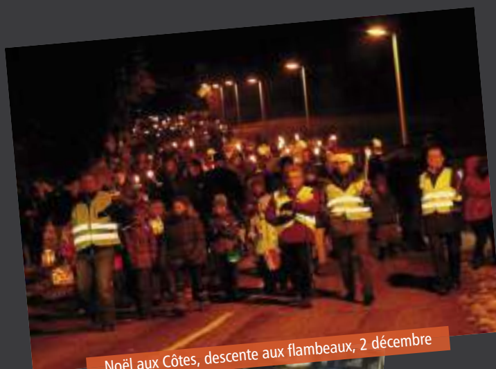
Noël aux Côtes, descente aux flambeaux, 2 décembre