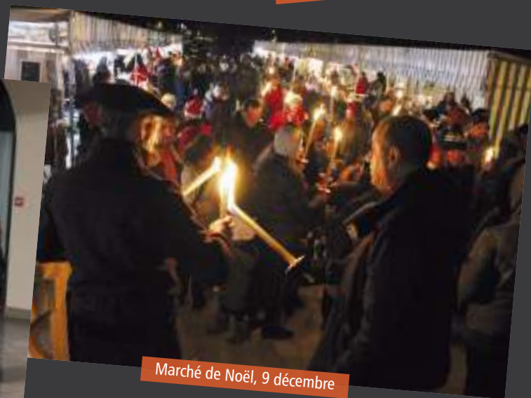
Marché de Noël, 9 décembre