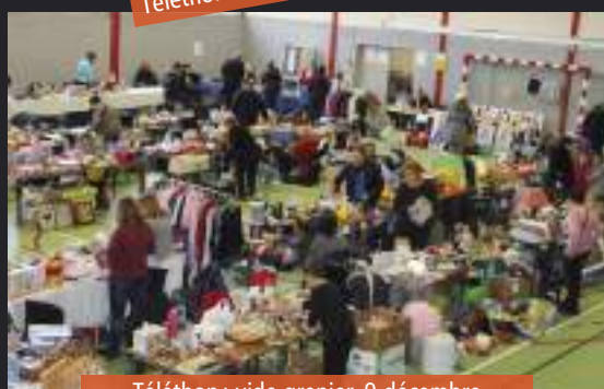
Téléthon : vide grenier, 9 décembre