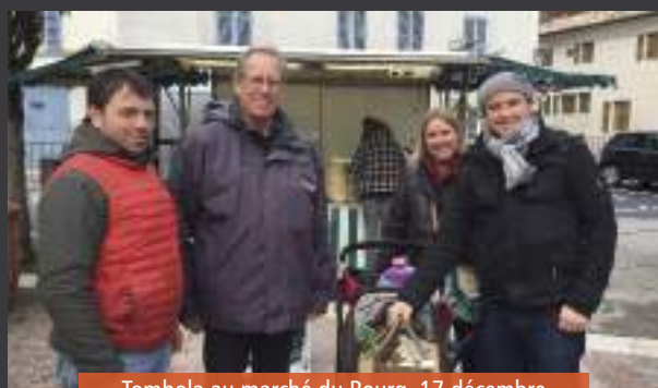
Tombola au marché du Bourg, 17 décembre