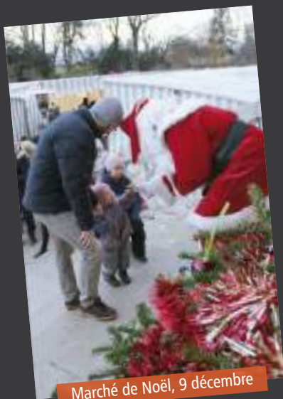
Marché de Noël, 9 décembre