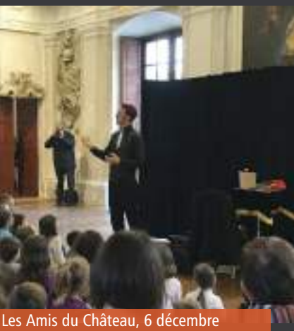
Les Amis du Château, 6 décembre