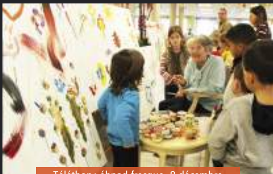
Téléthon : éhpad fresque, 8 décembre