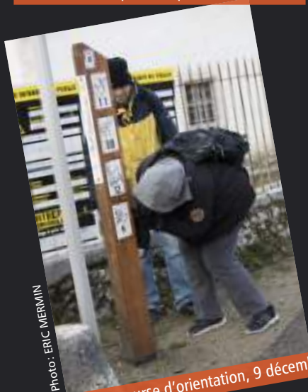
Téléthon : course d'orientation, 9 décembre