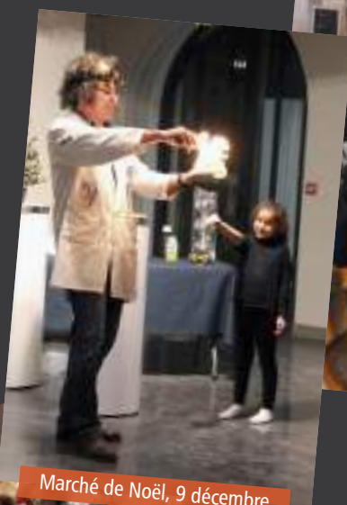
Marché de Noël, 9 décembre