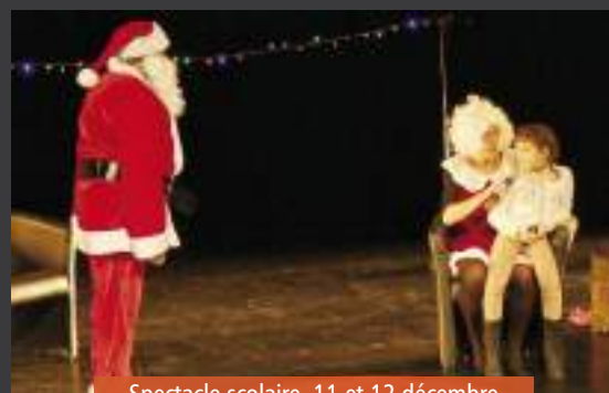
Spectacle scolaire, 11 et 12 décembre