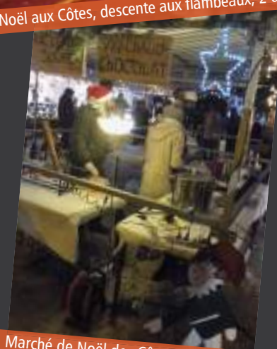
Marché de Noël des Côtes, 2 décembre