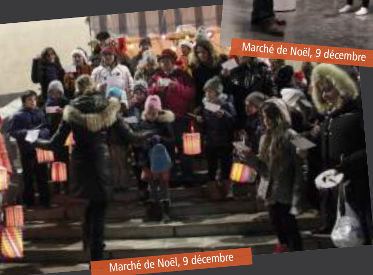
Marché de Noël, 9 décembre