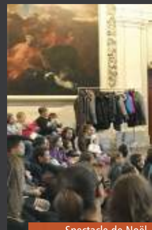
Spectacle de Noël,