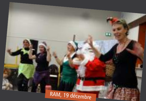
RAM, 19 décembre