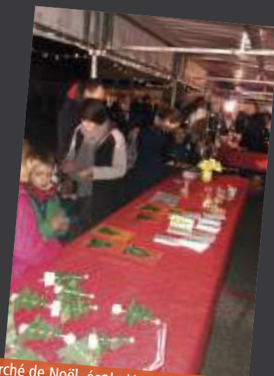
Marché de Noël, école Vercors, 24 novembre