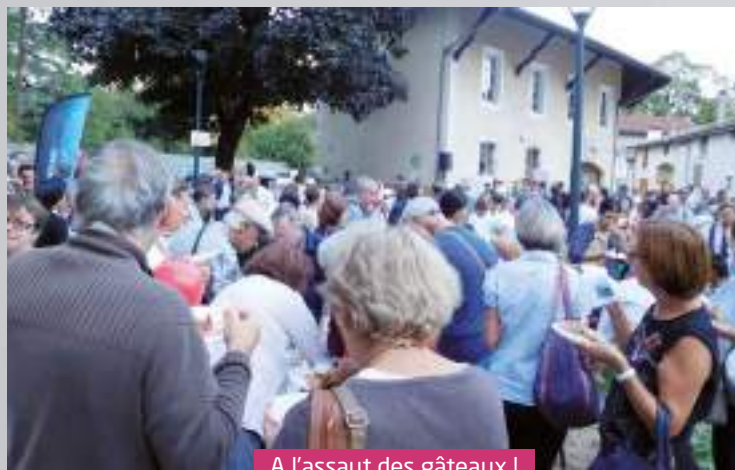
A l'assaut des gâteaux !