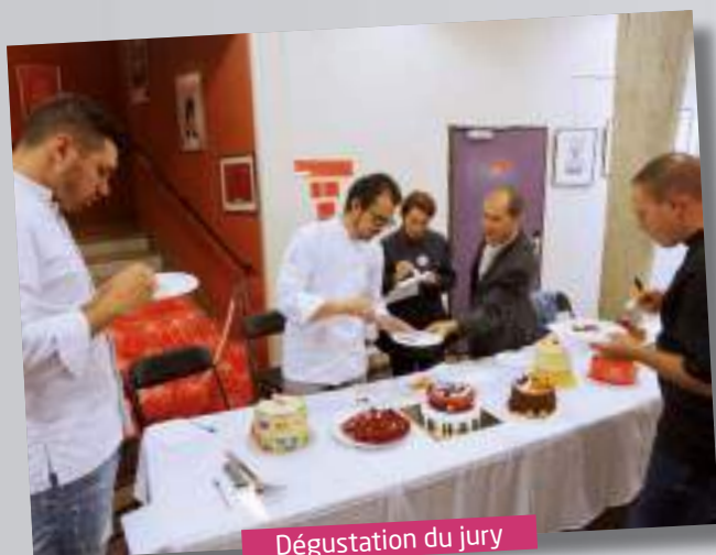
Dégustation du jury

Une journée placée sous le signe de la fête et de la gourmandise... Que rêver de mieux ! Samedi 29 septembre, le Théâtre en Rond célébrait les 60 ans de sa construction et les 10 ans de sa réouverture, faisant suite à l'incendie qui l'avait entièrement ravagé en 2004. Retour en images sur cette journée partagée avec des musiciens, des danseurs, des pâtissiers amateurs accompagnés d'un beau jury de connaisseurs, des gourmands, des curieux, des spectateurs... Et la liste n'est pas exhaustive ! A tous, un grand merci pour ce beau moment.