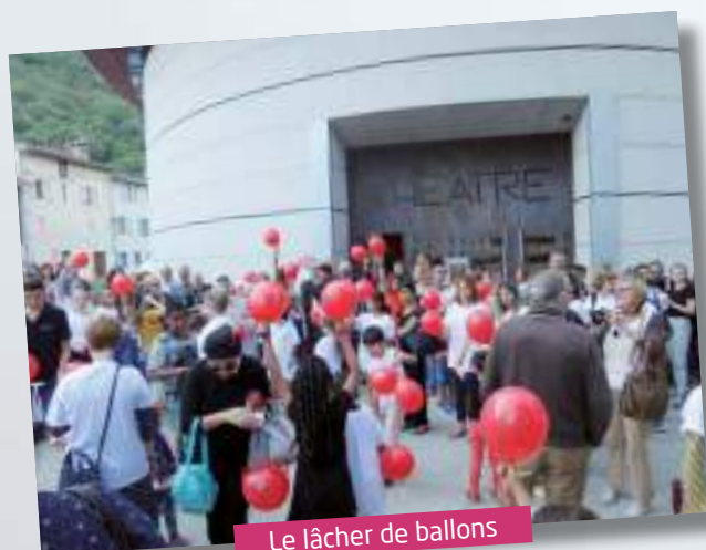
Le lâcher de ballons