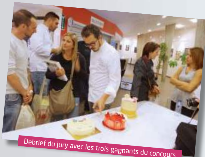
Debrief du jury avec les trois gagnants du concours