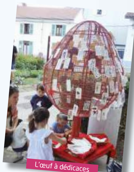
L'œuf à dédicaces