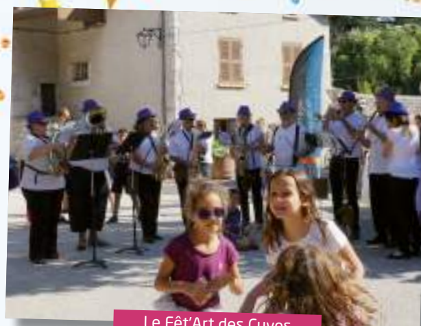
Le Fêt'Art des Cuves