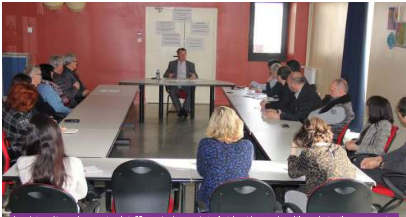
Lors de la conférence de presse donnée le 27 mars dernier pour alerter l'opinion et les pouvoirs publics sur la situation sassenageoise