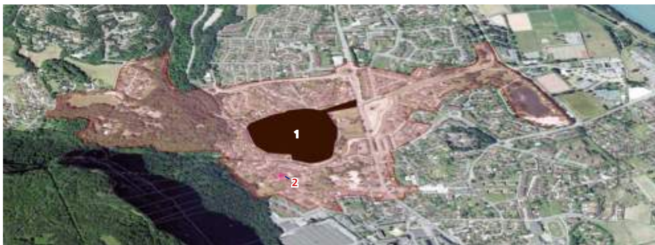
1 Le château de Sassenage