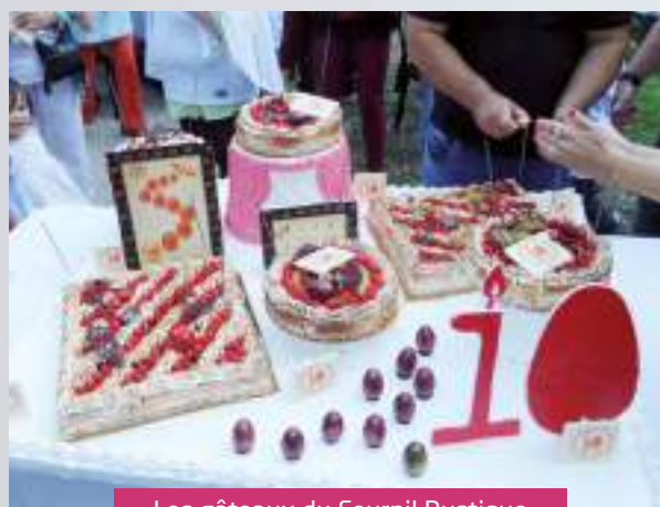
Les gâteaux du Fournil Rustique