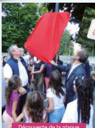
Découverte de la plaque Jean-Louis Trintignant