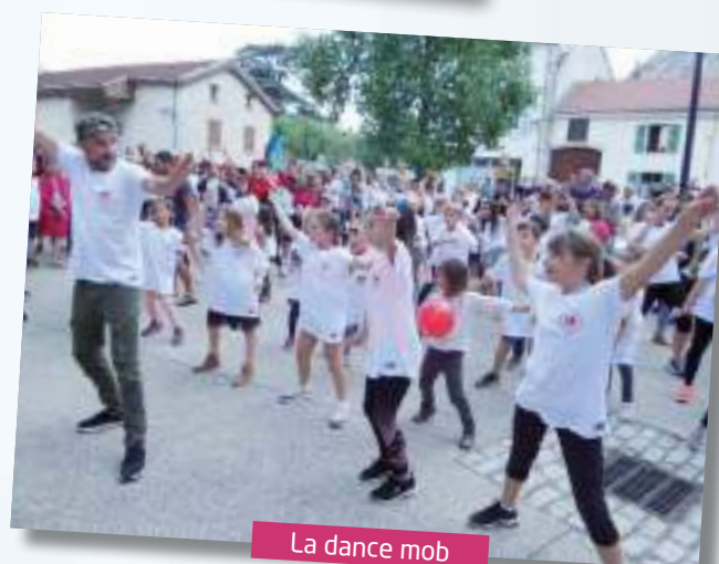
La dance mob