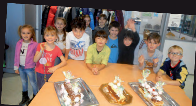
Atelier des arts « Bûches de Noël », 14/12 à l'Espace Familles