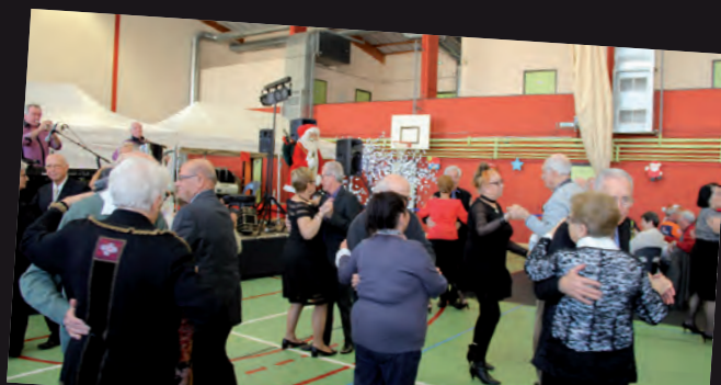
Repas de Noël des seniors, 7/12 au gymnase des Pies