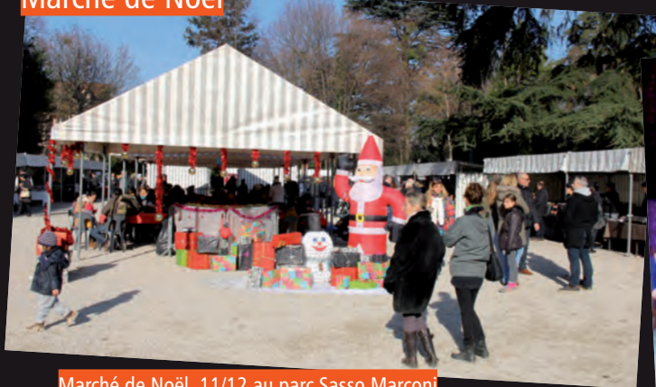
Marché de Noël, 11/12 au parc Sasso Marconi