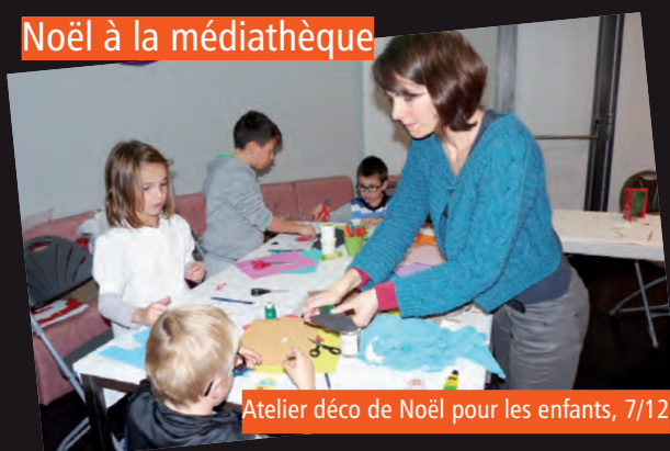
Atelier déco de Noël pour les enfants, 7/12