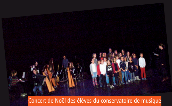
Concert de Noël des élèves du conservatoire de musique Alfred Gaillard, 16/12 au Théâtre en Rond