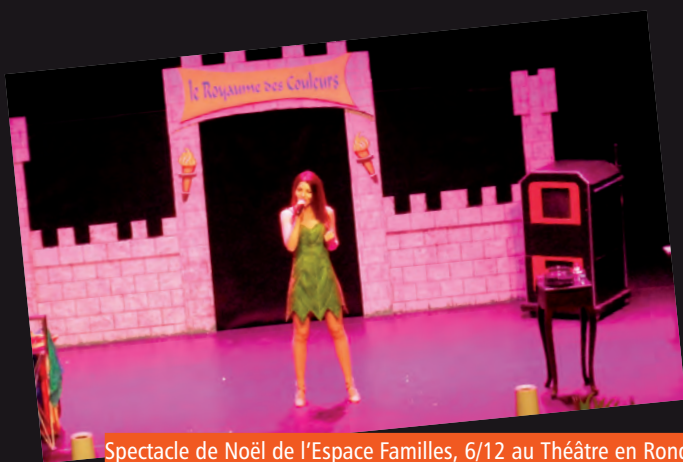
Spectacle de Noël de l'Espace Familles, 6/12 au Théâtre en Rond