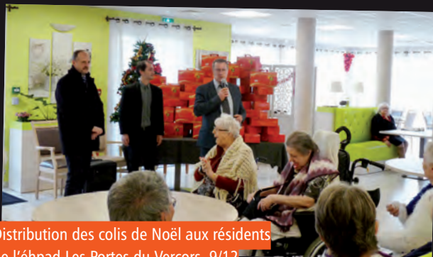
Distribution des colis de Noël aux résidents de l'éhpad Les Portes du Vercors, 9/12