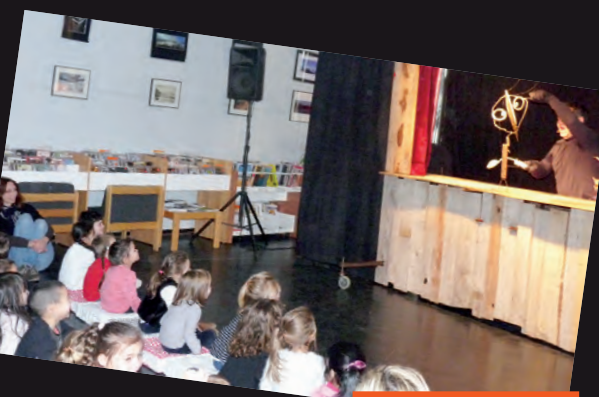
Spectacle de Noël, 14/12