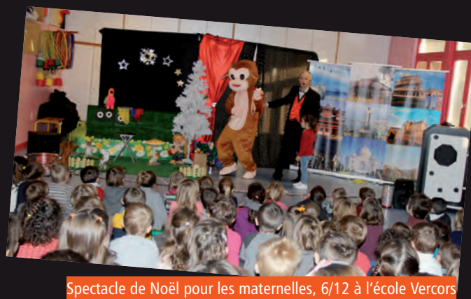
Spectacle de Noël pour les maternelles, 6/12 à l'école Vercors