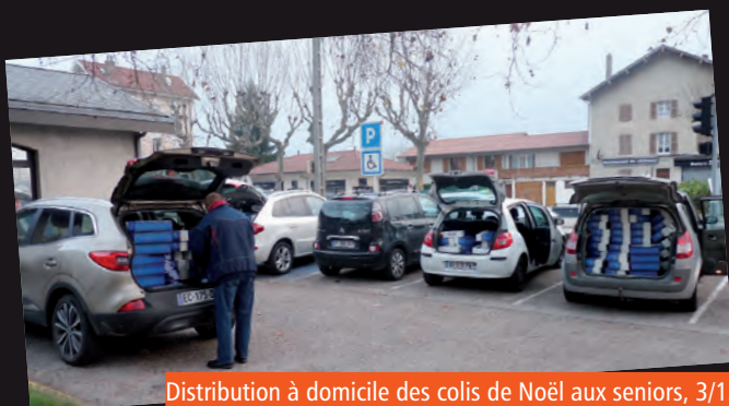
Distribution à domicile des colis de Noël aux seniors, 3/12

Décembre sonne l'heure des préparatifs de Noël. En attendant le grand jour, nombreuses étaient les animations organisées pour toutes les générations afin de rythmer le mois de manière festive.