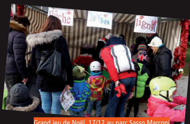
Grand jeu de Noël, 17/12 au parc Sasso Marconi