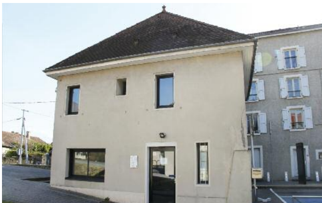
L'espace de coworking bientôt installé dans l'ancien office de tourisme

Comme relayé dans le dossier de Sassenage en pages en décembre 2016, la Ville travaillait sur l'accueil d'un espace de travail collaboratif dans la tourelle située devant la mairie, en lieu et place de l'office de tourisme fermé depuis le transfert de compétence à Grenoble-Alpes Métropole.