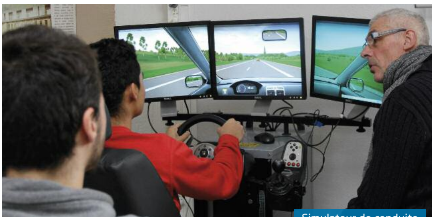
Simulateur de conduite

Dans ce cadre et afin d'amener les élèves à des actions altruistes et civiques, un appel au don du sang a également été lancé pour inviter les jeunes à donner leur sang mercredi 15 février au lycée, et des formations aux premiers secours sont également envisagées. ●