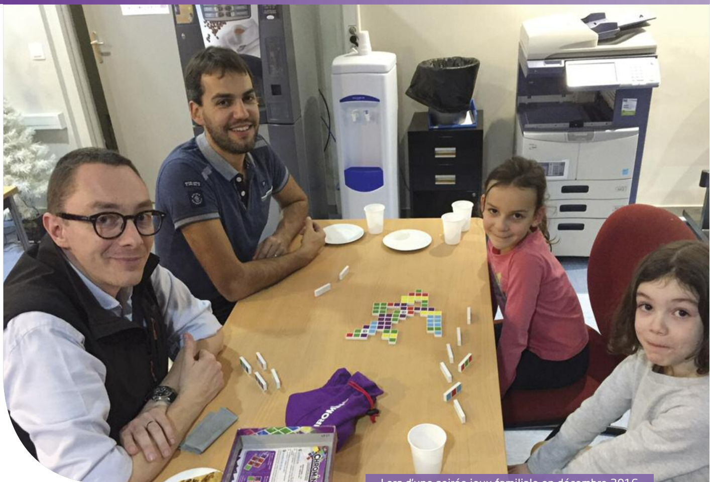
Lors d'une soirée jeux familiale en décembre 2016

C réé en 2008, l'Espace Familles, situé 1 avenue de Valence, vise à promouvoir le mieux vivre ensemble en étant un lieu de vie ouvert à tous (enfants, parents, personnes âgées, isolées ou non, avec ou sans difficultés sociales ou financières), facilitateur d'échange et créateur de lien.