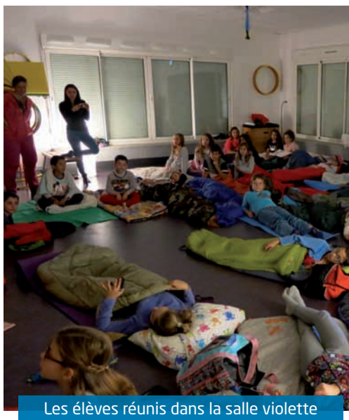
Les élèves réunis dans la salle violette

Au vu des mines réjouies et des commentaires des enfants, ils garderont longtemps en mémoire le souvenir de ces moments. D'ores et déjà, ils ont l'heureuse perspective de se retrouver à nouveau tous ensemble en mars pour un séjour de trois jours à Saint-Andéol, dans le cadre du thème «Conte» du projet de classe. ●