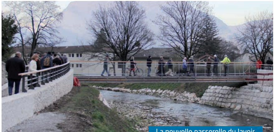
La nouvelle passerelle du lavoir