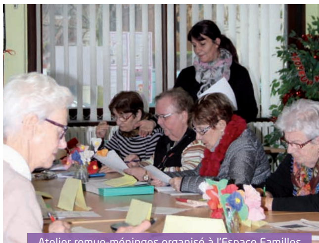
Atelier remue-ménages organisé à l'Espace Familles