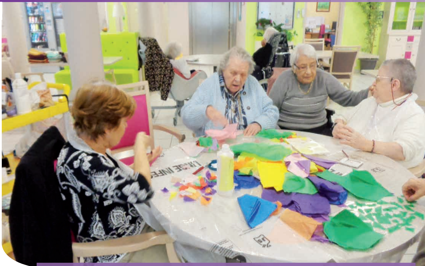
L'éhpad les Portes du Vercors permet aux seniors attachés à leur ville de rester à Sassenage malgré leur perte d'autonomie

avec le vieillissement de la population, la prise en charge des personnes âgées dépendantes constitue un enjeu majeur. La dépendance se définit comme un état durable de la personne entraînant des incapacités et requérant des aides pour réaliser des actes de la vie.