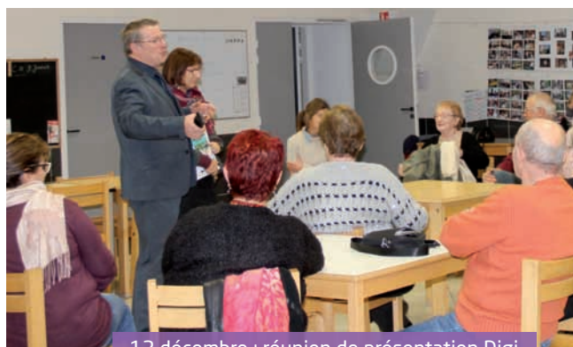
13 décembre : réunion de présentation Digi