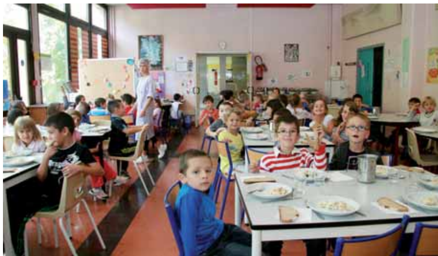
▲ Le temps de cantine