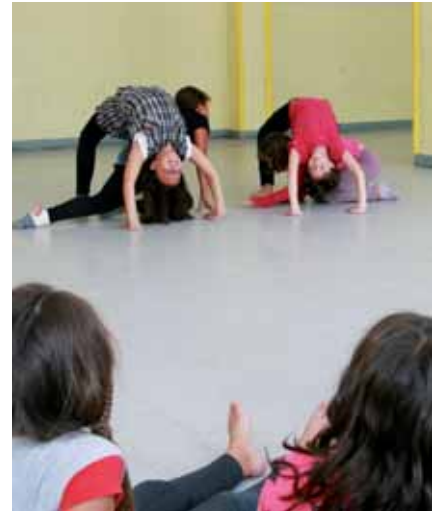
▲ Temps périscolaire, pause méridienne

pourraient avoir lieu soit de 13h30 à 14h15 soit de 15h45 à 16h30, je pense que cela peut être une réelle plus-value pour les élèves, à condition que les activités proposées soient adaptées et diversifiées. Si par contre elles sont assimilées à de la simple garderie, cela risque juste de fatiguer davantage les enfants. Aujourd'hui, un large consensus — parents, enseignants — se prononce contre un allongement de la pause méridienne, le but de la réforme étant de réduire les journées des enfants. Donc terminer plus tôt serait à mon sens bénéfique pour bon nombre d'enfants ».