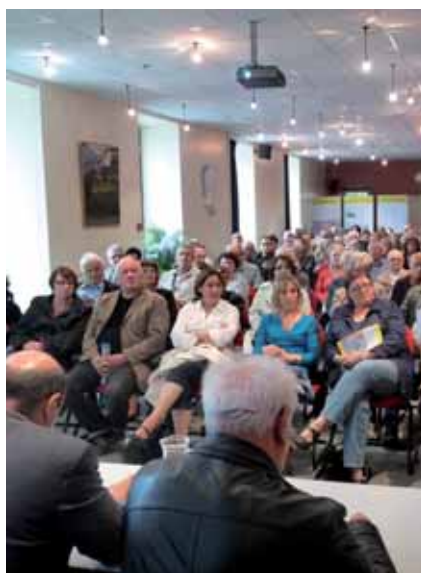
▲ Lors de la réunion publique en mai 2012

Ces temps de travail permettront une mise