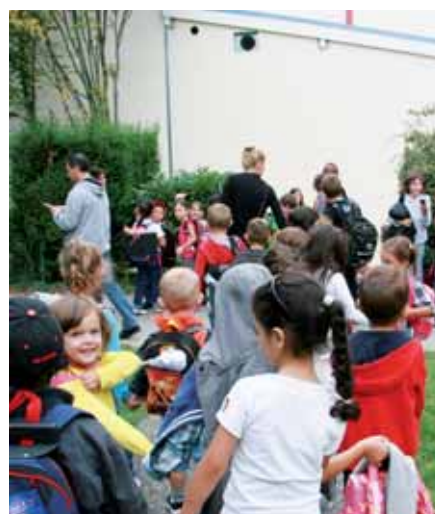
▲ L'heure de sortie le soir ne changerait pas