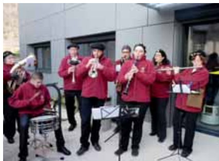
▲ Accueil en musique avec l'orchestre d'harmonie l'Echo des Cuves