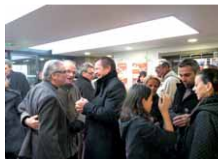
▲ Une bonne humeur communicative !