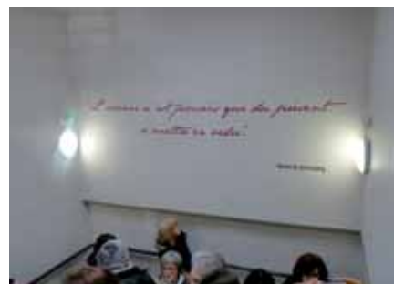
▲ Ici et là dans l'équipement, on peut lire des citations d'Antoine de Saint-Exupéry, écrivain et aviateur. Les salles portent en outre des noms de ville ou pays qu'il a visités.

* Orchestre d'harmonie l'Echo des Cuves, Environnement et Nature à Sassenage, La Cité, Corps et Graphie, Hype in style, Groupe italianisant de Sassenage, Les Chœurs de Sassenage, Art et poterie de Mélusine, Les amis d'in your brass, La route de la soie, La Gérina Sassenage Folk.