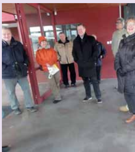
▲ Visite de quartier le 9 février