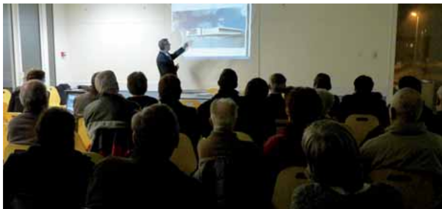
▲ Des riverains attentifs à la présentation du maire

P rés de trente-cinq Sassenageois sont présents pour découvrir le projet de développement de la zone d'activités de Clémencière, située à proximité d'Air Liquide ; un projet que la Ville gère aujourd'hui en régie, favorisant ainsi l'émergence de propositions pour ce secteur d'une surface de 24 000 m 2 environ.