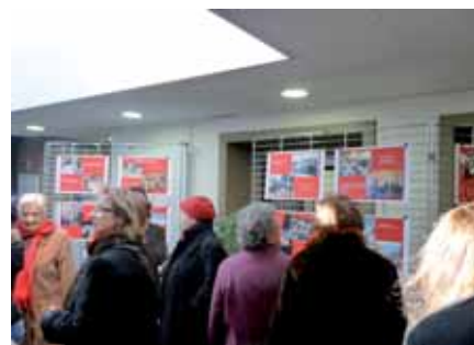
▲ Un panorama des activités du centre associatif Saint-Exupéry en frise dans le hall du nouveau centre associatif