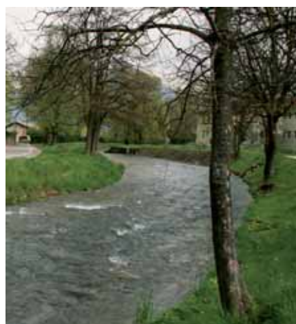
▲ Le Furon traversant la plaine de Sassenage

du Furon) à la confluence avec la grande Saône (chemin du Bac) en juin 2014, pour une durée d'environ sept à huit mois. Après un certain nombre de travaux préparatoires, il sera procédé au rehaussement et au renforcement d'une grande partie des digues du Furon, voire leur démolition ponctuelle et leur reconstruction, et à la mise à une côte plus élevée de certains ouvrages d'art (passerelles...) afin