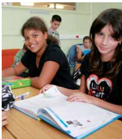
▲ Étude à l'école Vercors

La classe le mercredi matin allège le temps d'apprentissage de 45 minutes par jour pour le remplacer par des activités périscolaires. Il convient de décider à quel moment il est plus opportun de placer ces activités : en début ou en fin d'après-midi.