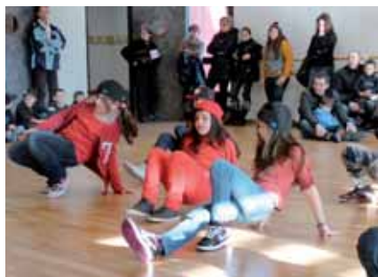
▲ Visite d'une salle de danse. Leçon de hip-hop avec des jeunes danseurs très appliqués