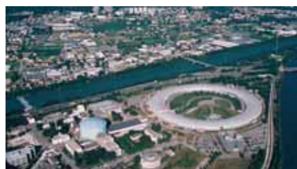
▲ Un territoire en mouvement

Polarité Nord-ouest est le nom du grand projet d'aménagement urbain qui implique quatre communes de l'agglomération : Grenoble avec la Presqu'île scientifique, Saint-Martin-le-Vinoux et son