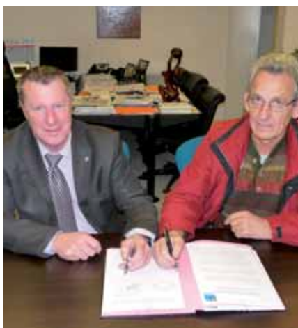
▲ Signature de la convention

La première phase des travaux est prévue sur le périmètre qui s'étend du lavoir (quai