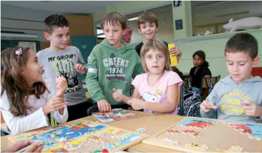
▲ Temps périscolaire, fin d'après-midi