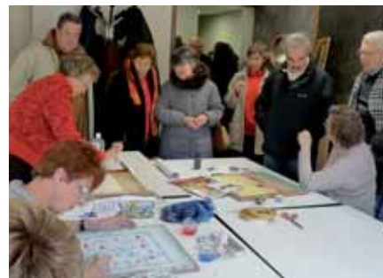
▲ Visite des salles d'activités. Ici, l'association la Route de la soie