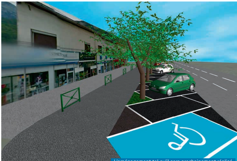
L'aménagement tel qu'il sera prochainement réalisé

Oui lors de la phase d'enfouissement des réseaux aériens, non pour les aménagements de surface. Toutefois, le stationnement pourra