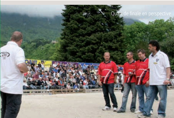
Quart de finale en perspective.