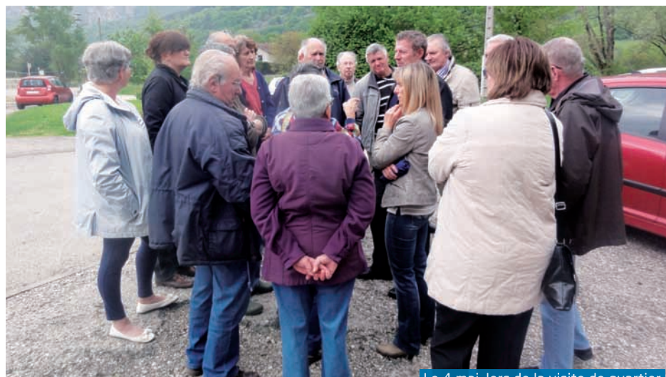
Le 4 mai, lors de la visite de quartier

les quatre secteurs, avec diffusion d'un diaporama reprenant toutes les réalisations.