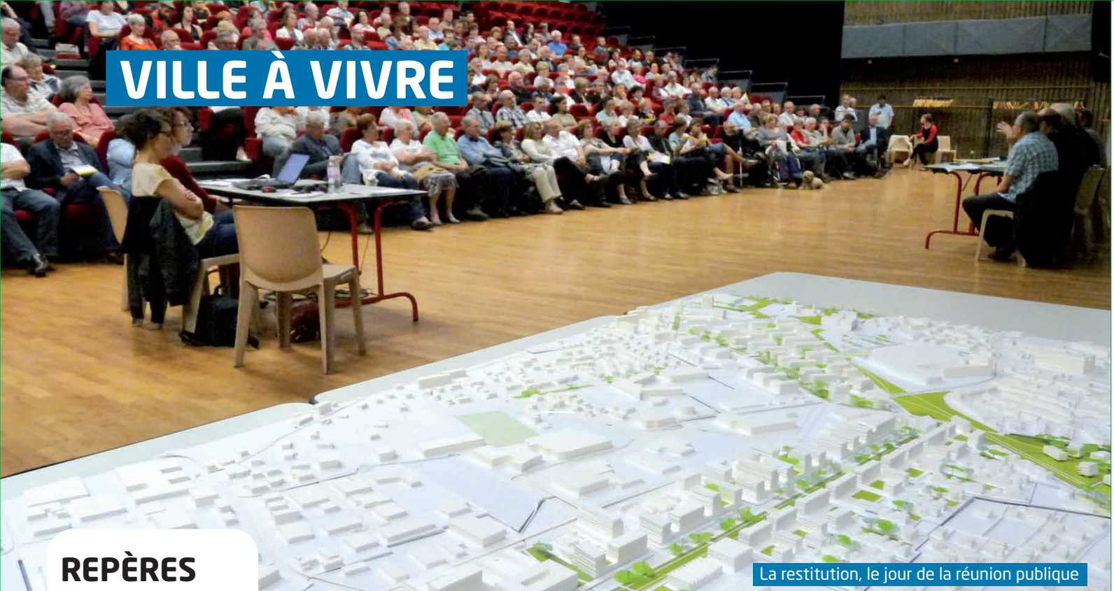
La restitution, le jour de la réunion publique