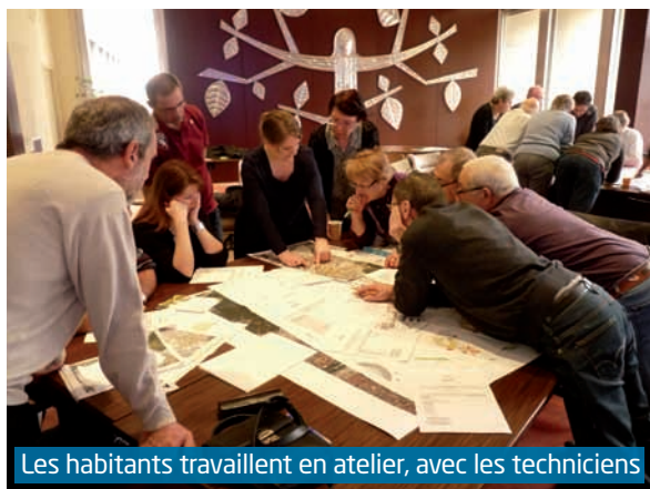
Les habitants travaillent en atelier, avec les techniciens

A l'issue de ces débats, trois points d'information — maquette du projet, transport par câble et gestion des risques — permettaient à ceux qui le souhaitaient d'obtenir des réponses plus précises. ●