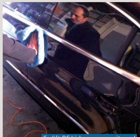
Carlift-DF bichonne vos voitures !

Une peinture ternie, des sièges tâchés ? N'ayez plus honte de votre véhicule ! Carlift-DF vous le rendra comme neuf ! ●