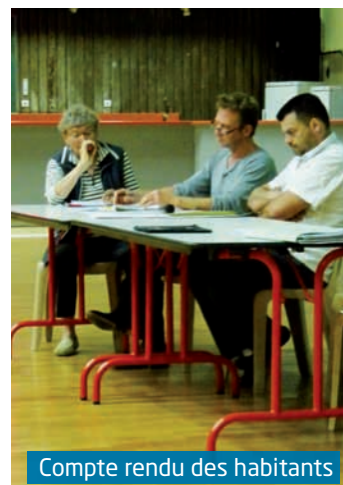
Compte rendu des habitants

ensuite avec les élus sur les intangibles, points de vigilance et autres questions qu'un tel projet engendre.