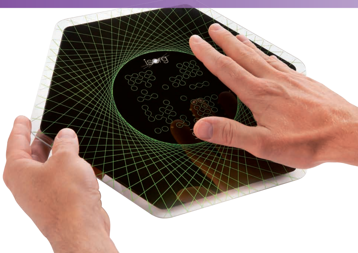
Le magic Pad d'Isorg, une tablette interactive révolutionnaire sans contact