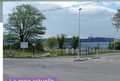
La zone actuelle