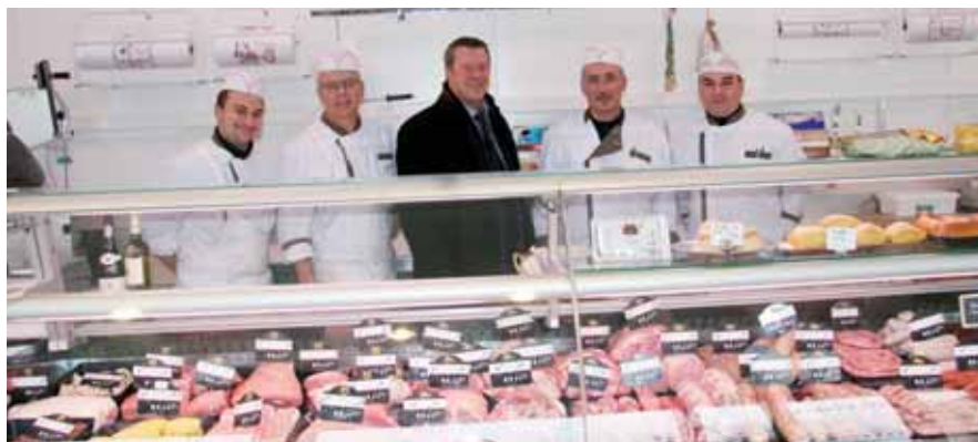
▲ Le maire en visite à la nouvelle boucherie

Aujourd'hui, c'est une équipe de quatre à cinq personnes qui vous accueille, toujours avec le sourire et dans une ambiance conviviale. Hormis la traçabilité et la qualité