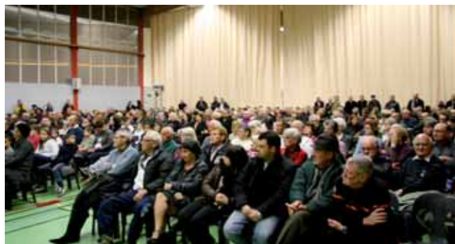
◀ ▲ Le public était nombreux à ce rendez-vous annuel