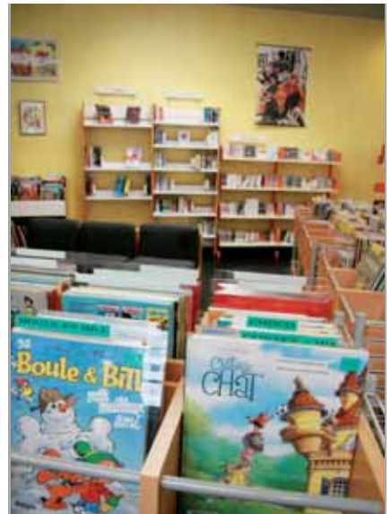
▲ Le secteur de la bande dessinée

Le secteur bandes dessinées s'adresse autant aux adultes qu'à la jeunesse. Pour satisfaire la demande, l'acquisition de ces documents est influencée par les récompenses des différents festivals comme ceux d'Angoulême, de Saint-