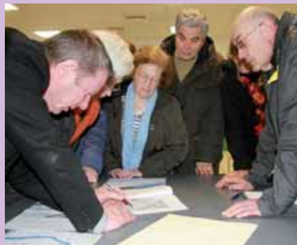
▲ Un plan d'implantation regardé de près

En matière de téléphonie mobile, la négociation est toujours plus porteuse que le tribunal.