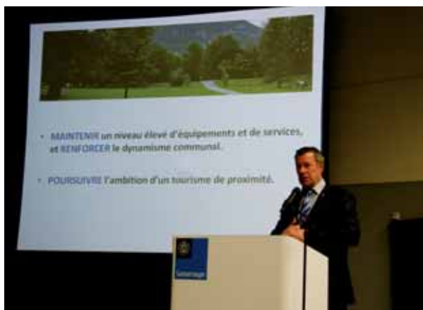
▲ Le maire présente le projet de ville