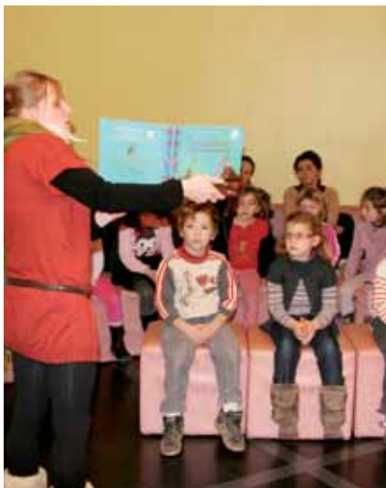
▲ Lors de l'animation mensuelle Croq'Livres

Un poste multimédia, sur les quatre mis à disposition des usagers, est dédié à la recherche de ces fonds. ■