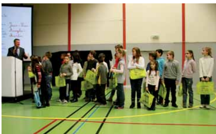
▲ Les enfants Sassenageois qui ont réalisé les dessins et les textes