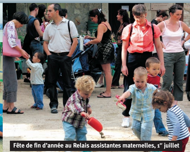
Fête de fin d'année au Relais assistantes maternelles, 1 er juillet