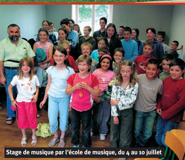
Stage de musique par l'école de musique, du 4 au 10 juillet