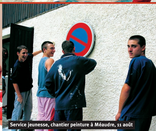
Service jeunesse, chantier peinture à Méaudre, 11 août