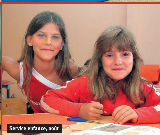
Service enfance, août