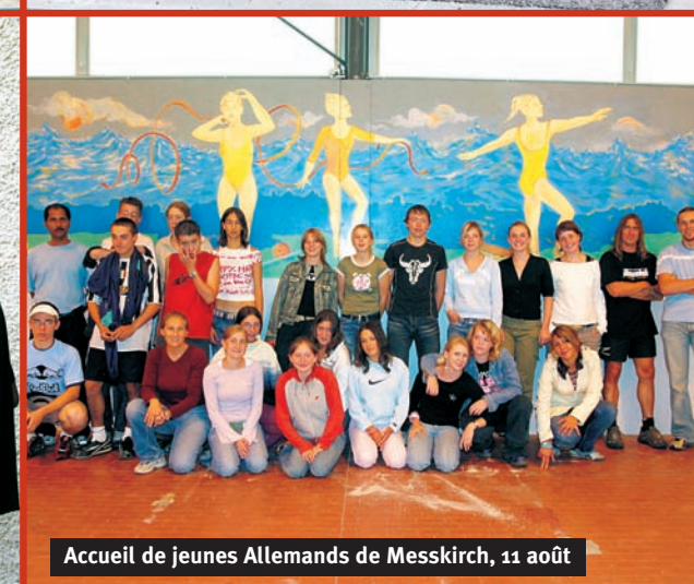
Accueil de jeunes Allemands de Messkirch, 11 août