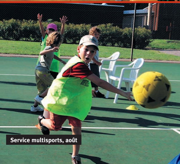
Service multisports, août