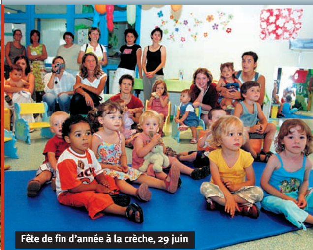
Fête de fin d'année à la crèche, 29 juin