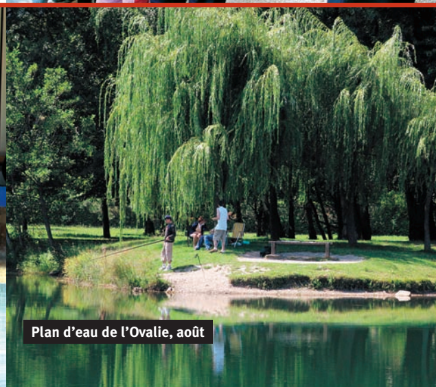
Plan d'eau de l'Ovalie, août