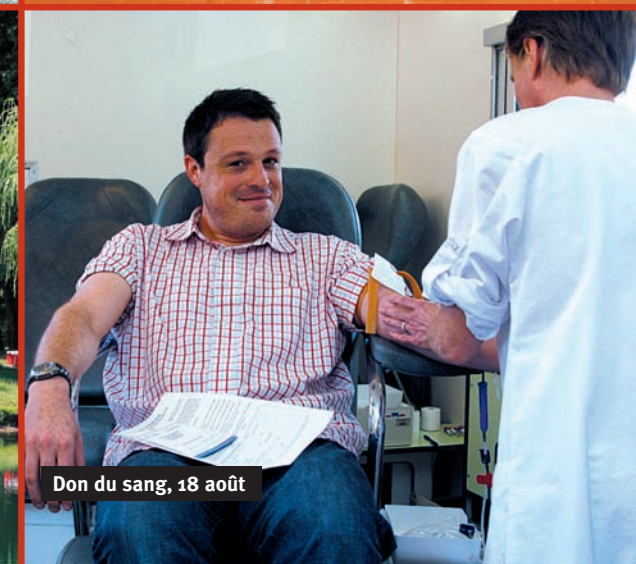
Don du sang, 18 août