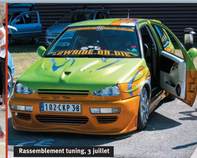
Rassemblement tuning, 3 juillet