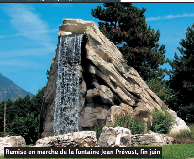
Remise en marche de la fontaine Jean Prévost, fin juin