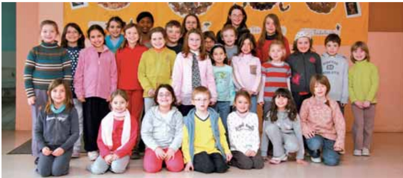
▲ Les élèves ayant contribué au projet des cartes de vœux

(1) établissement d'hébergement pour personnes âgées dépendantes.