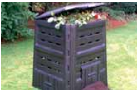
▲ Un composteur