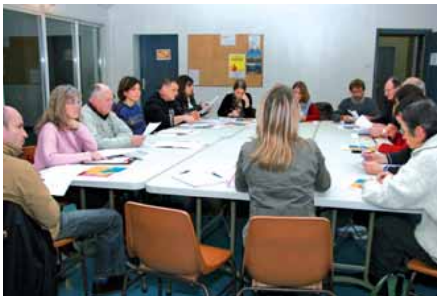
▲ Réunion du conseil de secteur Nord