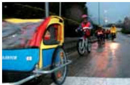
▲ Vélobus de l'école du Hameau du Château

La démarche d'Agenda 21 étant un processus long — en moyenne deux à trois ans — il apparaissait nécessaire à Sassenage d'engager d'ores et déjà des actions et animations favorisant la prise de conscience des citoyens. « En effet, la réflexion, longue, de la mise en place de l'Agenda 21, n'empêche pas d'agir sur le terrain à partir d'actions vertueuses et peu coûteuses, et cela dès aujourd'hui », explique le chargé de mission environnement. « Ces actions vont dans le sens du développement