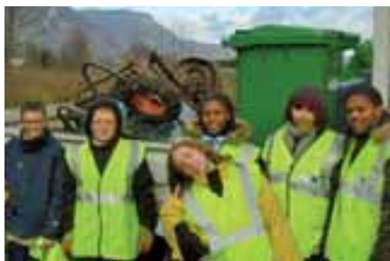
▲ Nettoyage du marais des Engenières en 2008