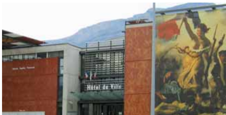
▲ La mairie d'Echirolles, exemple de construction intégrant les principes de développement durable