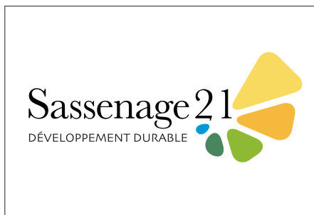
▲ Logo identifiant l'Agenda 21 de la Ville

La Ville a d'ores et déjà planché sur une identité graphique de l'Agenda 21. Dorénavant, lorsque nous évoquerons un sujet en lien direct avec cette thématique sur les différents supports que vous avez l'habitude de recevoir, nous vous le ferons savoir en apposant le logo ci-contre. Épuré, il est aux couleurs de la Terre, et est symbolique de l'évolution des changements culturels qui devrait nous amener progressivement à réfléchir aux conséquences de nos actes. ■