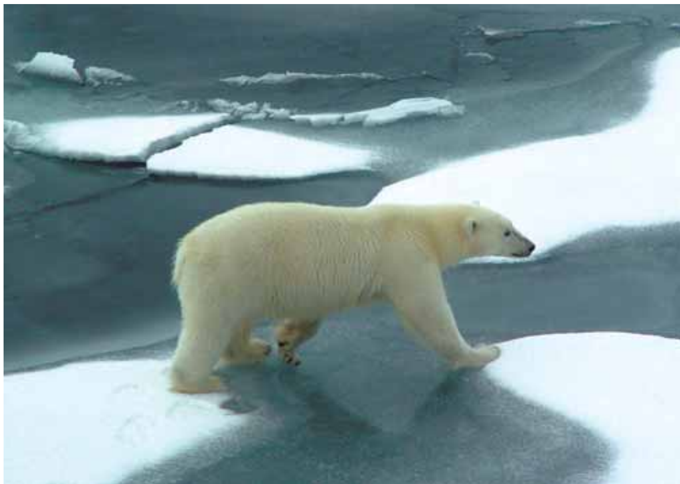
▲ L'ours polaire officiellement érigé en symbole du combat contre le réchauffement global

L a terre est malade des excès humains. De nombreux signaux d'alerte sont donnés depuis des décennies. Sans adopter un ton alarmiste, la déforestation constante de la forêt amazonienne, poumon vert de la Terre, la disparition progressive de la biodiversité ou le recul des glaciers alpins sont devenus des sujets plus que préoccupants. La liste est longue. Les liens qui existent entre le changement climatique, la consommation d'énergie, la pollution atmosphérique et le développement industriel sont indéniables. La dégradation de la qualité de l'air et de l'eau, ou encore la montée des océans ne sont que des conséquences visibles qui accélèrent la fracture entre les pays riches et les pays pauvres. Le ton monte en 2008, aggravé par une triple crise, énergétique, économique et alimentaire.