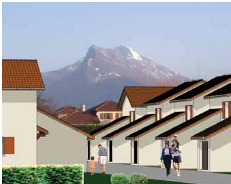
▲ Le Clos Symphonie : dix maisons rue du Vinay