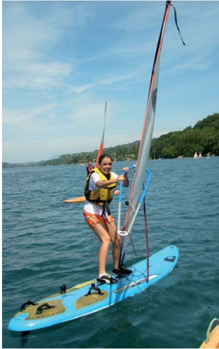
▲ Initiation à la planche à voile