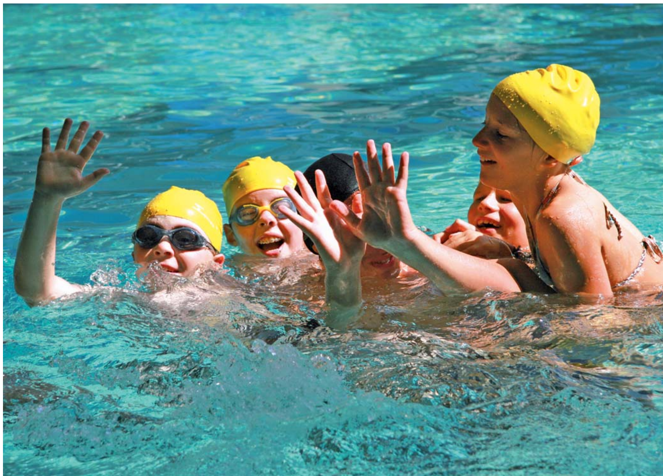
▲ Activité piscine proposée par le multisports tous les après-midi

S assenage a pris à bras le corps les problématiques liées à la jeunesse. Les services qui leur sont proposés sont mûrement réfléchis par des élus et des professionnels attentifs à leurs besoins, à commencer par le Forum job étudiants qui a permis à certains jeunes (18-25 ans) de trouver un emploi ou un stage pour l'été.