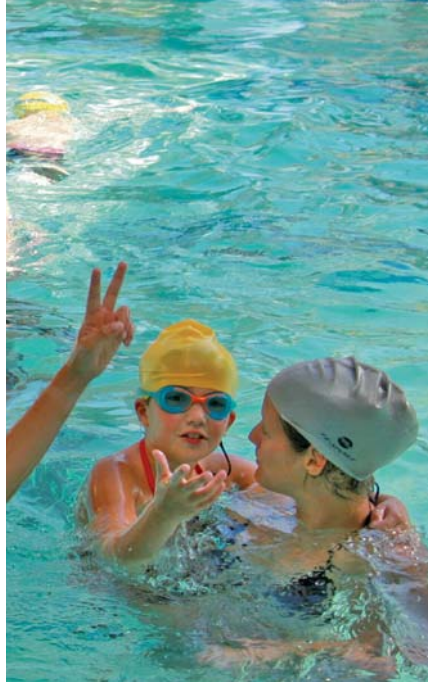
▲ Moment privilégié dans l'eau