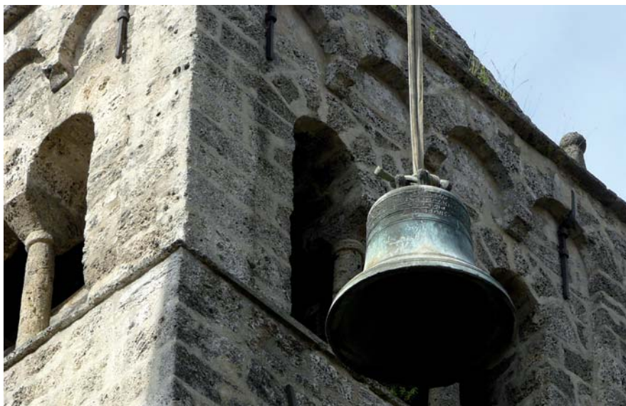
▲ Mercredi 8 juillet lors de l'enlèvement par l'entreprise Bodet du Maine et Loire

Là, le métal tassé est ôté à la disqueuse, et la cloche chauffée dans un four dont la