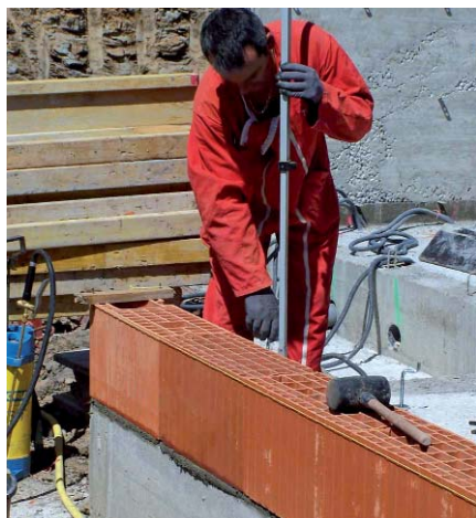
▲ Les travailleurs modestes sont les premiers bénéficiaires du RSA

Ainsi, lors d'une reprise d'emploi, une personne pourra percevoir son salaire et 62 % de l'ancienne allocation : une mesure incitative, pour les ex-allocataires, à renouer avec le marché de l'emploi.