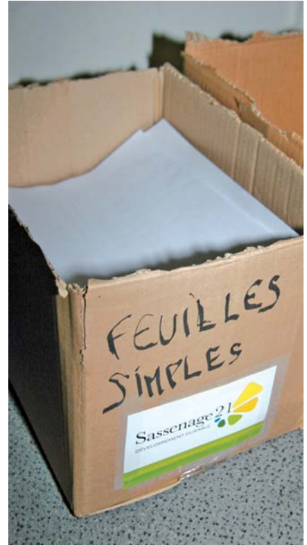
▲ Une manière simple de récupérer les feuilles imprimées

Les groupes scolaires participant à l'opération arboreront une affiche stipulant : « Cette école s'engage à trier et à diminuer sa consommation de papier », en guise de « label environnemental ». Vous saurez ainsi si l'école de vos p'tits bouts s'est mobilisée ou non ! ■