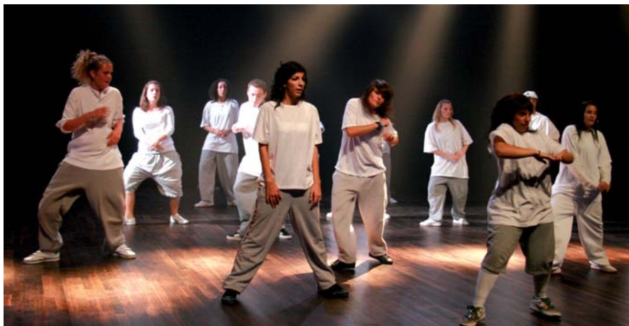
▲ Une démonstration d'Hype in Style lors de la soirée d'ouverture le 12 septembre 2008

Gageons qu'elle renouvellera le pari d'enfiévrer la salle comme elle a su le faire l'an dernier lors d'un duo improvisé avec les danseurs d'Hype in Style.