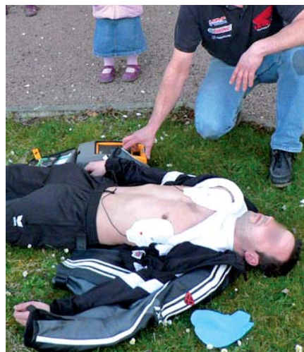
▲ Des vies peuvent être sauvées grâce à un geste technique

Une démarche qui, en plus d'être citoyenne, est économique puisque la Ville n'a rien déboursé ! « Il s'agit en fait d'une mise à disposition de défibrillateurs en contrepartie d'espaces publicitaires sur la commune (face publicitaire au verso des douze panneaux). » Quand économie est susceptible de rimer avec sauvetage de vie... ■