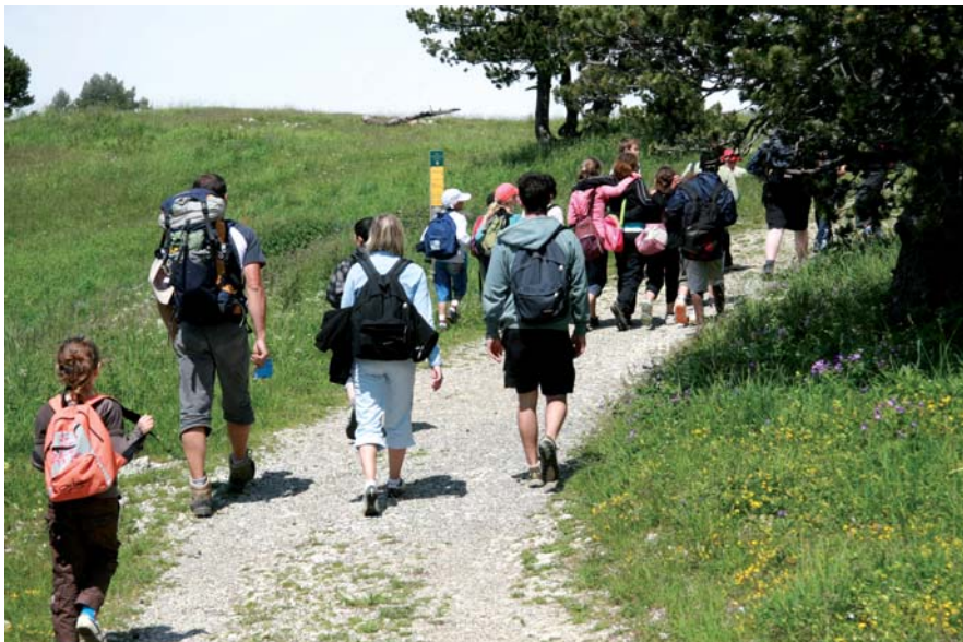
▲ Le centre de loisirs de Méaudre en expédition dans le Vercors

Le responsable du service jeunesse insiste sur l'importance des valeurs et des règles apportées par chaque activité : « Le fair-play avec le laser game , la sécurité avec le kayak, la rigueur et l'écoute à travers le ski nautique, ou le courage lors d'un saut en canyoning. Le jeune apprend toujours quelque chose lors de ces temps de loisirs ». De même, les animateurs du multisports peuvent s'enorgueillir des vertus sociales véhiculées par le sport, ou de l'apport de valeurs comme le respect des règles, le sens de l'effort ou encore l'esprit d'équipe. Les animateurs sont très motivés par la soif de connaissances des enfants, par leur envie de se dépasser et d'apprendre : « On se fait tous plaisir », conclut la responsable du service enfance-éducation. ■