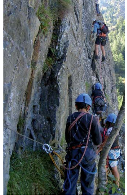
▲ Via ferrata pour le groupe du centre Évasion

Cet été, les centres de loisirs ont connu une large affluence. Il faut dire que tout avait été mis en œuvre pour offrir des vacances au goût de chacun. Les centres de Méaudre et Rivoire de la Dame, le multisports et le centre Évasion proposaient en effet de nombreuses activités sportives, d'éveil, culturelles, mais également des sorties et des créneaux piscine aux enfants et adolescents. Les activités du service enfance-éducation