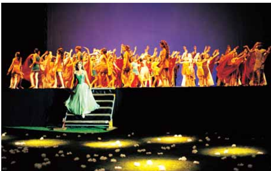
▲ Photo prise à l'occasion des dix ans de Corps et Graphie, en 1999