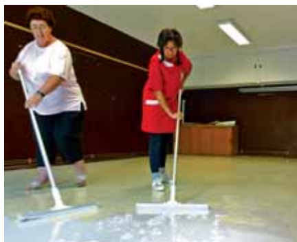
▲ Grand nettoyage d'été, école Rivoire de la Dame