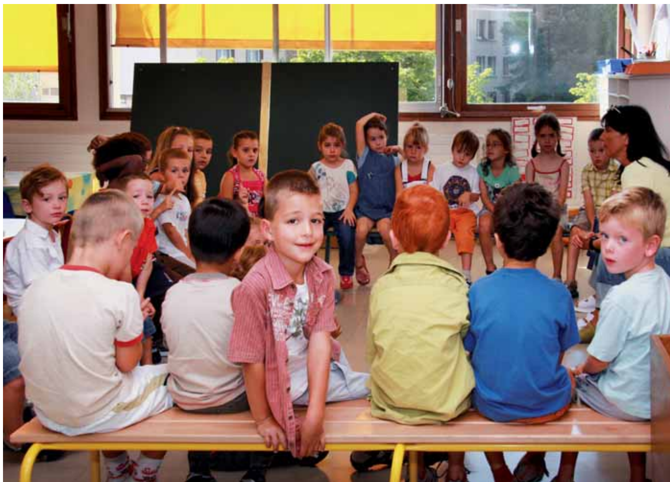
▲ Rentrée des classes 2008

1 092 enfants sont inscrits dans les écoles maternelles et élémentaires de la commune. Les enseignants, premiers sur le front de l'éducation, font un travail remarquable au quotidien. L'implication des professionnels de l'éducation dans la relation avec l'enfant est primordiale dans la réussite de la scolarité et la prise de confiance. Toutefois, pour gagner la bataille de l'éducation, toujours plus rude, de nombreux critères entrent en ligne de compte, comme la nécessité de travailler, pour les enseignants comme pour les enfants, dans des locaux agréables, avec du matériel et des équipements toujours à la pointe. Les compétences en matière pédagogique sont ainsi distribuées par