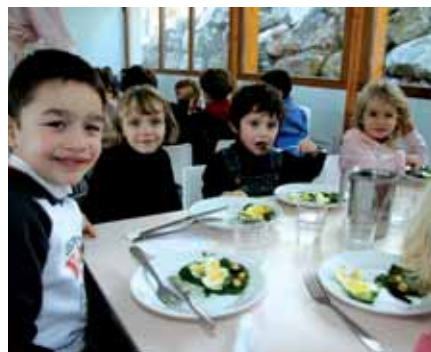
▲ Quand il fait bon manger équilibré...

U ne école où il fait bon travailler, où chaque enfant trouve confort et sécurité est un lieu propice à l'apprentissage. La Ville s'implique chaque année pour la remise en état des locaux. En 2008, ce ne sont pas moins de 85 000 euros qui ont été consacrés uniquement aux économies d'énergie, avec le remplacement des fenêtres des groupes scolaires Vercors et des classes