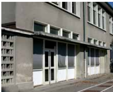
▲ Nouvelles fenêtres dans toutes les écoles