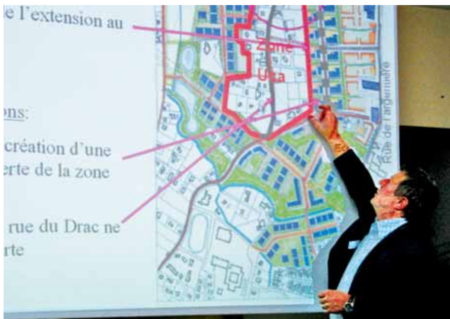
▲ Le maire, lors de la réunion publique d'information sur la zone de l'Argentièrre

Il faut dire que les contraintes induites par les nouvelles normes de sécurité concernant le pipeline, ainsi que l'amorce des projets à l'échelle de l'agglomération (Rocade nord et Giant) et de la commune (extension de la ligne A du tramway, ouverture du pont-barrage et voie de contournement) devaient absolument être prises en compte. Sans oublier le projet « Portes du Vercors », élaboré en collaboration avec la Ville de Fontaine et La Métro, et la prochaine modification