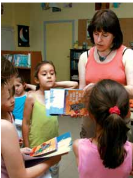
▲ L'atelier Coup de pouce clé réunit cinq enfants

Une initiative qui témoigne de l'investissement conjoint de la Ville et de l'Éducation nationale pour garantir à