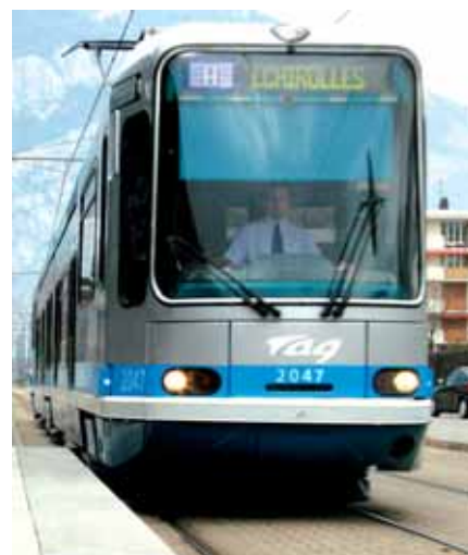
▲ Le prolongement du tramway s'accompagnerait de cinq nouveaux arrêts sur Sassenage

« Il faut repenser notre rapport à la vitesse »