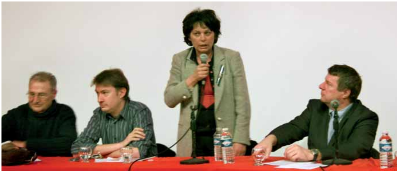
▲ Michèle Rivasi, vice-présidente du Criirem, évoquant les risques liés aux antennes-relais