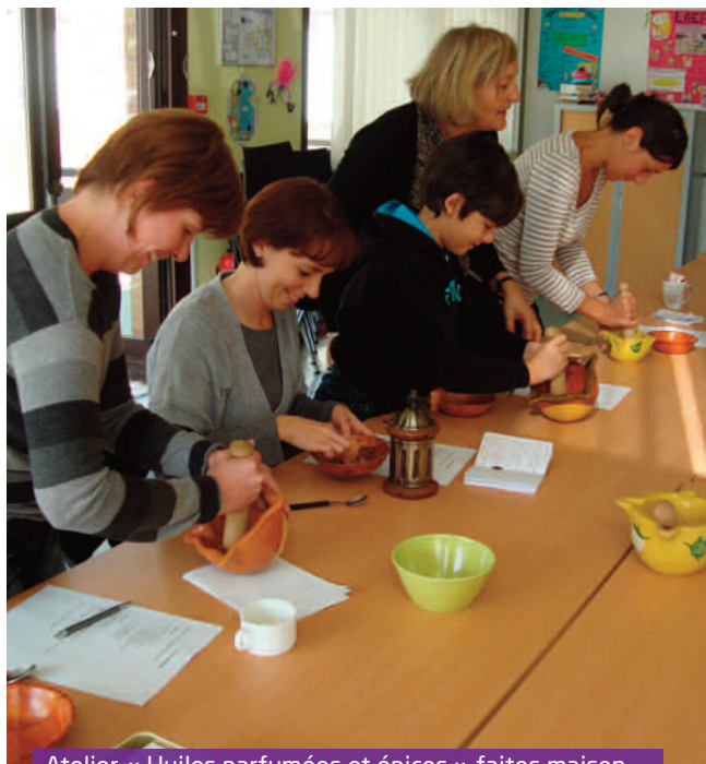
Atelier « Huiles parfumées et épices » faites maison