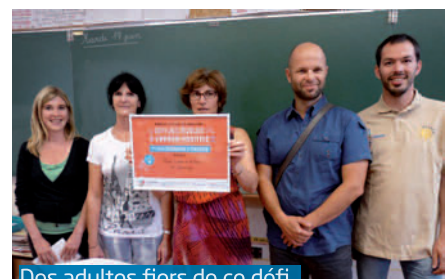
Des adultes fiers de ce défi