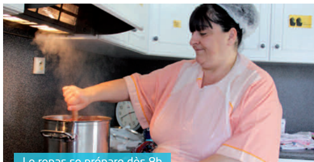
Le repas se prépare dès 8h

(1) Le repas est organisé par le CCAS à l'Espace Familles