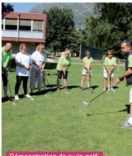
Démonstration de swin golf