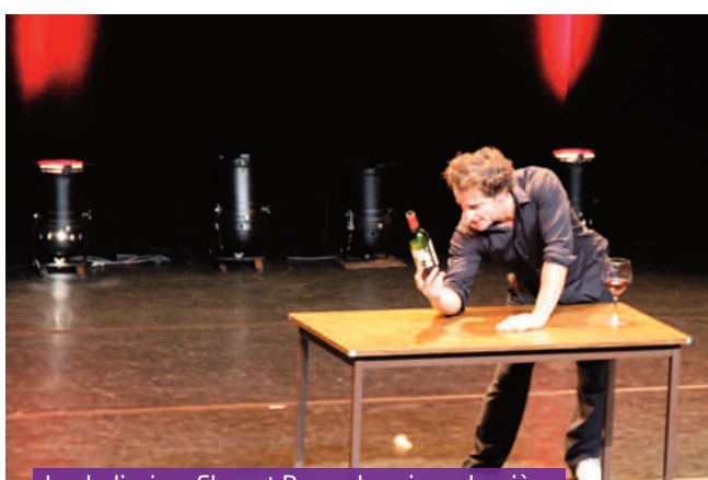
Le drolissime Florent Peyre, la saison dernière