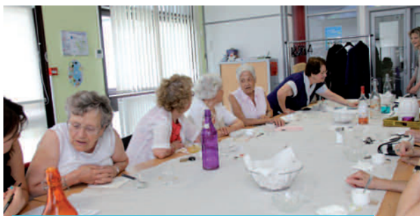
Une grande tablée pour accueillir tout le monde...