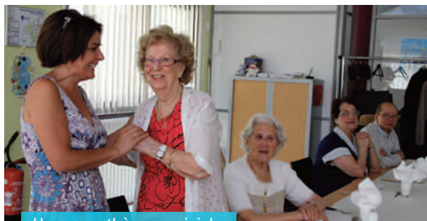
Une parenthèse conviviale