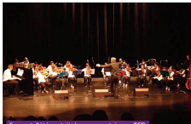
Concert d'été gratuit du conservatoire au TER

30 heures d'intervention musicale en milieu scolaire dans les écoles de la commune, soit 763 élèves bénéficiant d'un enseignement musical de qualité Des interventions régulières au multi-accueil et au Ram pour les tout-petits