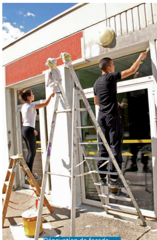
Rénovation de façade

Dans l'animation (centres de loisirs ou multisports), à la piscine (caisse, entretien, surveillance du bassin) ou aux Cuves (guides bilingues), ce sont finalement 39 jeunes majeurs ayant entre 18 et 25 ans qui ont été recrutés par la Ville pour les mois de juillet et août. Tenteras-tu ta chance l'année prochaine ? ●