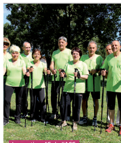
La section 4S de l'ACS

J eudi 5 juin, l'animation « Mé'mé tes baskets ! » (1) , organisée par la fédération française de la retraite sportive (FFRS), faisait escale à Sassenage pour promouvoir le sport et ses bienfaits auprès des plus de 50 ans, et plus particulièrement auprès des femmes. L'après-midi était donc rythmé par des démonstrations de nombreuses activités sportives telles que le bungy pump (bâton dynamique), do-in (gym douce), swin golf, et autre zumba, que les