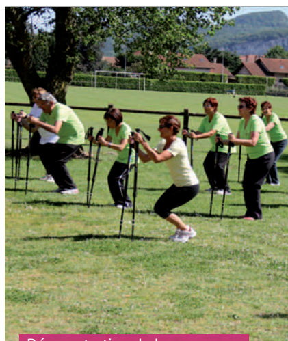
Démonstration de bungy pump