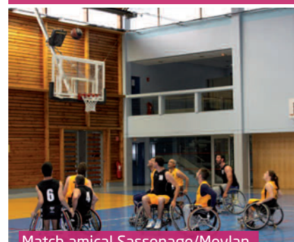
Match amical Sassenage/Meylan Grenoble handibasket