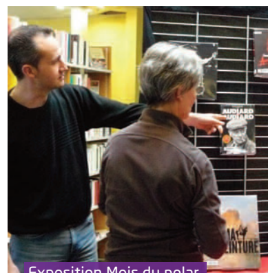
Exposition Mois du polar