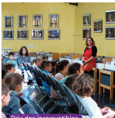
Prix des incorruptibles