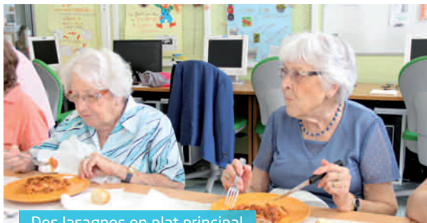
Des lasagnes en plat principal