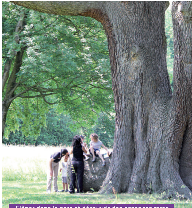
Flâner dans le parc et découvrir des essences rares