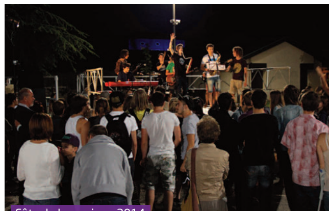
Fête de la musique 2014