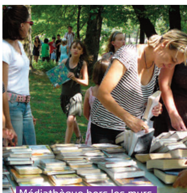
Médiathèque hors les murs