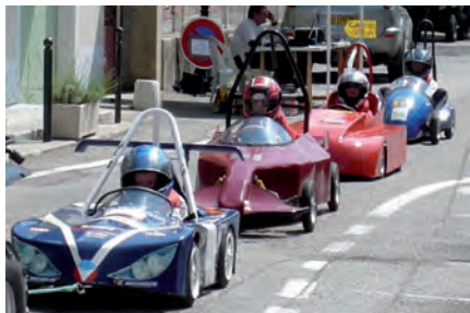
▲ Une animation organisée par la commission