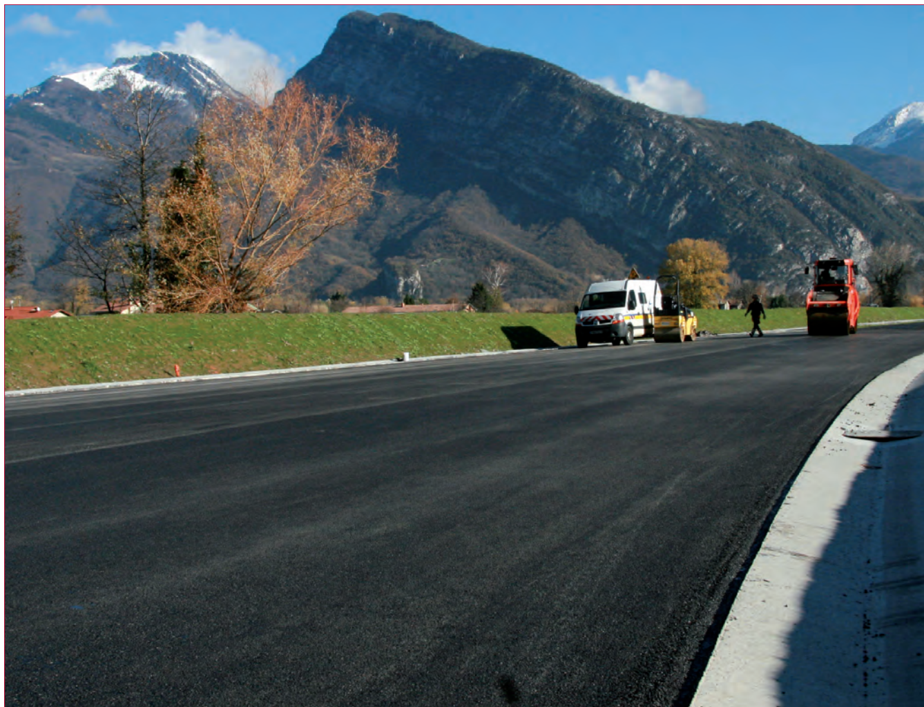
▲ Des travaux en cours d'achèvement pour accéder au pont-barrage attendu le 13 décembre