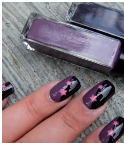
▲ Pour des ongles très glamour !