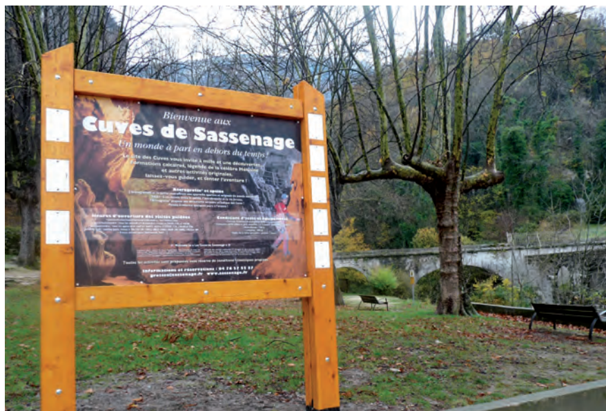
▲ Développer le site du Pré des Cuves et l'associer pleinement à la vie du Bourg

« Attachés à la préservation et à la valorisation du Pré des Cuves, il nous a semblé intéressant d'envisager l'exploitation de l'ancienne centrale EDF à des fins de lieu de réception et d'information des visiteurs sur les activités, de petite restauration type snack, mais aussi de point de vente des produits proposés par le Parc naturel régional du Vercors et Tourisme Sassenage. En intégrant ce bâtiment dans le périmètre du projet, nous nous