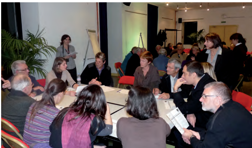
▲ Réflexions et échanges ont animé les ateliers

d'un marché accessible aux personnes actives, ou de lieux conviviaux dans les quartiers...).