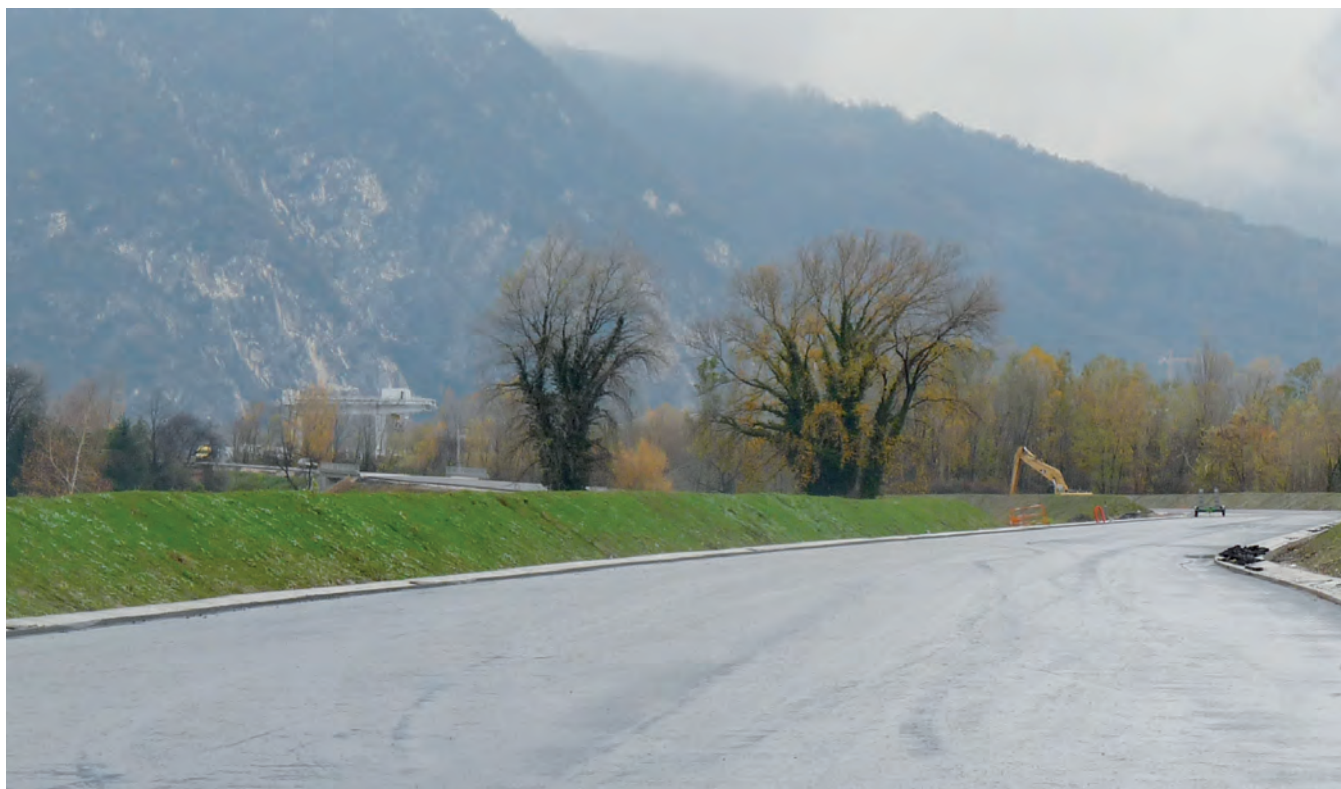
▲ Les usagers des transports en commun devront attendre mars 2011 pour emprunter le pont-barrage