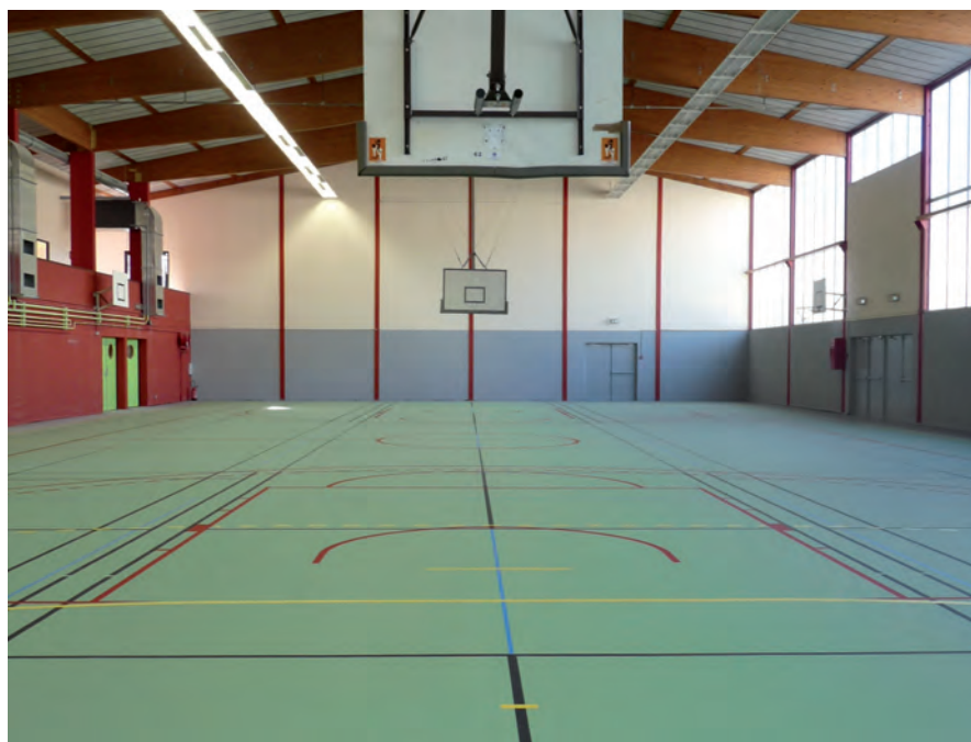
▲ Le gymnase des Pies répond désormais complètement aux attentes en matière de salle festive

L'espace festif socioculturel (1) ne prendra pas la forme annoncée, mais verra néanmoins le jour, différemment ; l'objectif demeurant en effet de répondre aux besoins de la vie associative, le tout avec raison et rigueur.