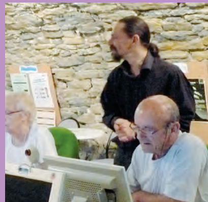
▲ Atelier informatique au cyber espace

La décision a ainsi été prise de reconsidérer ce service pour mieux cibler l'offre, notamment selon les profils des utilisateurs. Le matériel va donc être redéployé entre l'Espace Familles et le centre Evasion pour la poursuite des ateliers d'initiation à l'informatique, et à des fins pédagogiques pour les jeunes. En lieu et place du cyber espace, c'est une salle de réunion dédiée à la vie associative qui verra le jour dès le printemps. Sur cette base, le cyber espace fermera définitivement ses portes au public jeudi 16 décembre 2010 à 19h. ■