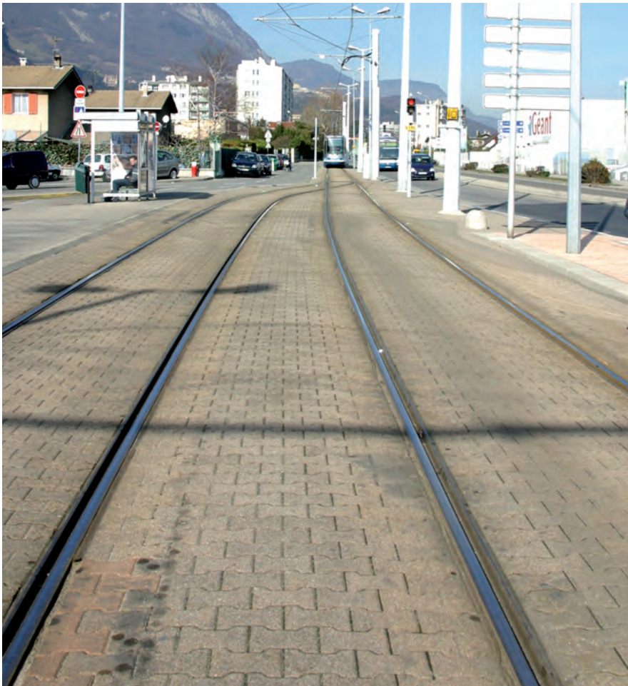
▲ Sassenage n'est toujours pas fixée sur la date de réalisation des travaux du tram