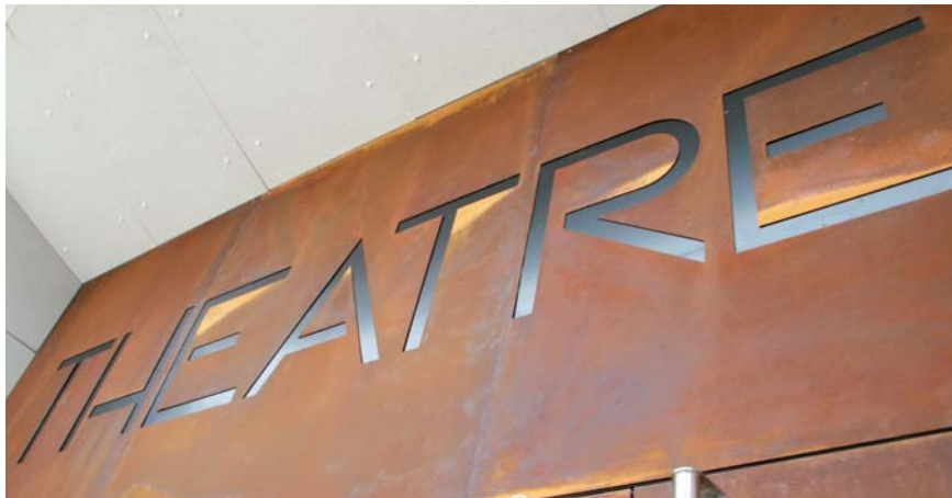
▲ Le Théâtre en Rond rencontre une forte adhésion du public

De fin juin à mi-juillet, une enquête de satisfaction a été réalisée pour faire un bilan du Théâtre en Rond, deux ans après sa réouverture.