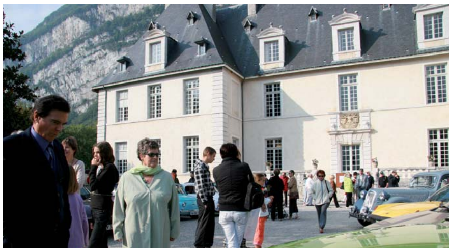
▲ Les belles voitures anciennes seront présentes dans la cour du Château dimanche 19, de 8h30 à 10h30

Enfin, les visites du Bourg s'effectueront