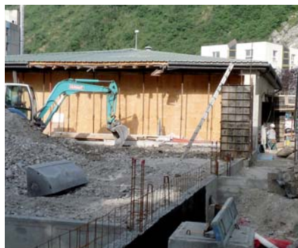
▲ Le gymnase des Pies sera métamorphosé pour sa mise en service

Les travaux de mise aux normes du complexe Paul Vieux-Melchior en vue d'accueillir les matches du GF38 en championnat de football amateur 2 (CFA2) sont désormais terminés.