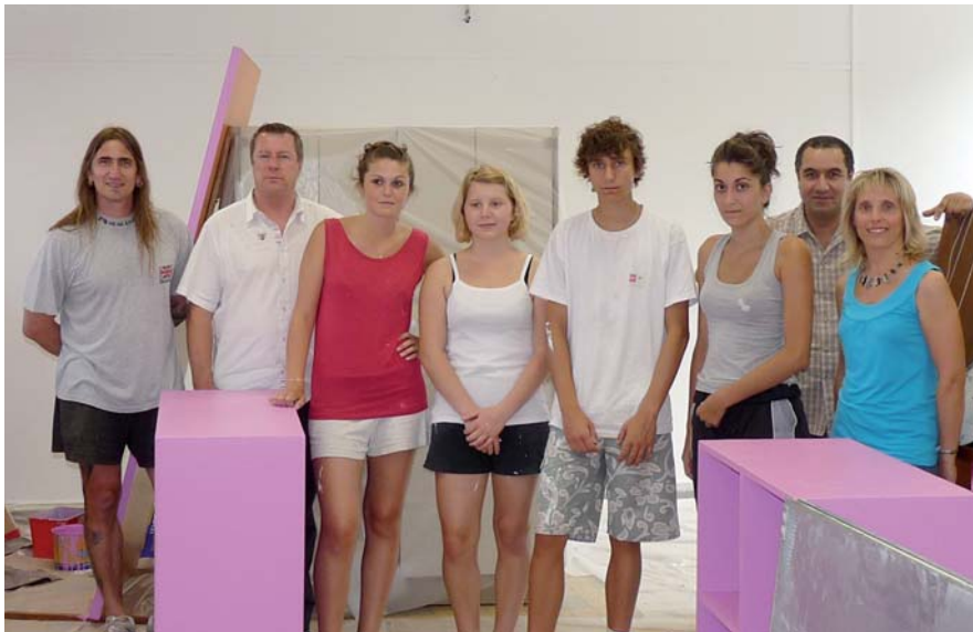
▲ Les chantiers jeune ont mobilisé vingt-huit adolescents pour rénover des bâtiments municipaux