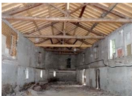
Table rase pour « Fibac »

Les Communs du Château de Sassenage sont, depuis janvier 2010, en cours de transformation. La toiture a été entièrement refaite, et la partie intérieure intégralement démolie pour créer deux salles de réception, sur 370 m 2 répartis sur deux niveaux. Grâce à ces aménagements, la surface commerciale du Château de Sassenage va être doublée à l'horizon 2012, ce qui lui permettra de renforcer son activité tourisme d'affaires.