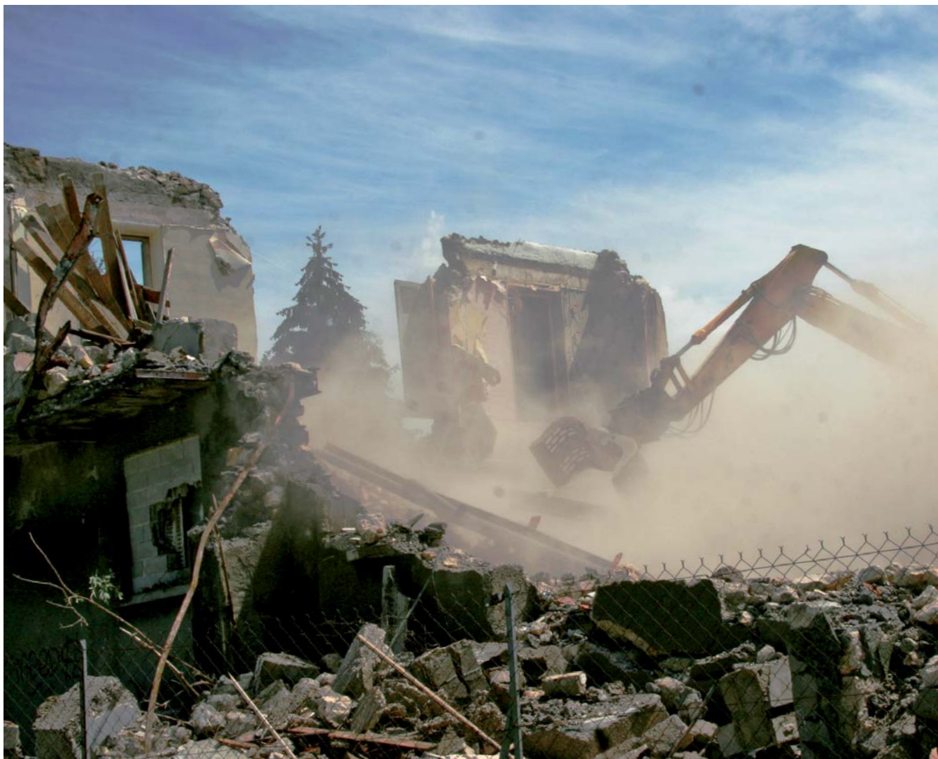
▲ La démolition du bâtiment ex-Fibac a été spectaculaire

La période estivale est propice à l'engagement de travaux, notamment pour minimiser l'impact sur les riverains, mais également sur les usagers, a priori moins nombreux, vacances obligent. C'est la raison pour laquelle un programme ambitieux de travaux a été lancé sur le territoire communal, le tout pour poursuivre l'amélioration du cadre de vie des Sassenageois.