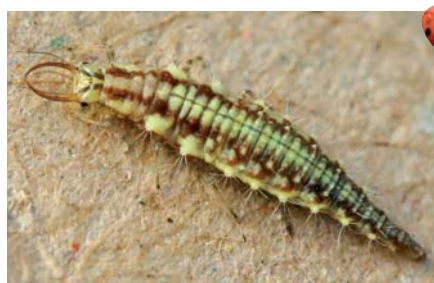
▲ Larve du chrysopé

C ette année, deux types de « bestioles » sont dans la ligne de mire du service espaces verts de la Ville : une toute petite, le puceron, et une autre plus impressionnante, la chenille processionnaire.