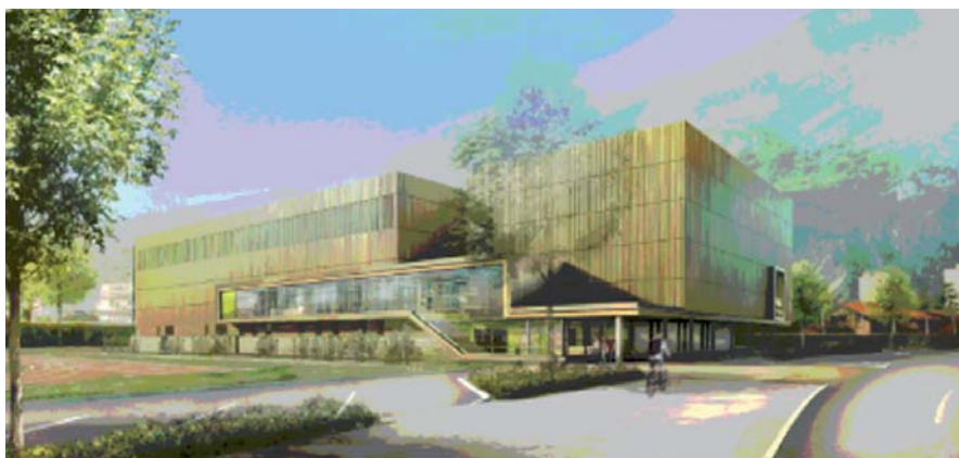
▲ Vue du futur gymnase (document non contractuel)

Ce nouveau gymnase, d'une superficie de 2 972 m 2 (contre 1 263 m 2 aujourd'hui), disposera d'un plateau omnisports de 1 200 m 2 pour accueillir des compétitions régionales, et d'une salle polyvalente de 345 m 2 équipée d'un mur d'escalade homologué au niveau départemental, de