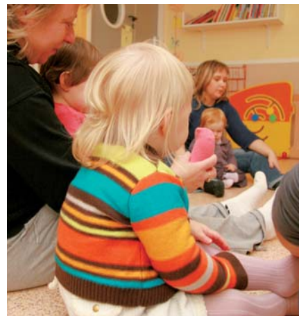
▲ Pendant un temps collectif

Infos : Espace Familles (pôle Famille Enfance Education), 1 avenue de Valence, 04 76 26 90 90.