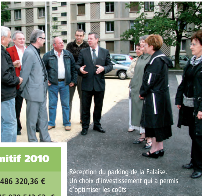
Réception du parking de la Falaise. Un choix d'investissement qui a permis d'optimiser les coûts.

A la clôture de l'exercice budgétaire, qui intervient au 31 janvier de l'année N+1, est établi le CA. • Il rapproche les prévisions ou autorisations inscrites au budget et les réalisations effectives en dépenses (mandats) et en recettes (titres) ; • Il présente les résultats comptables de l'exercice ; • Il est soumis par l'ordonnateur, pour approbation, au conseil municipal qui l'arrête définitivement par un vote avant le 30 juin de l'année qui suit la clôture de l'exercice.