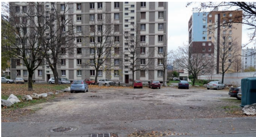
▲ L'espace au pied des immeubles, avenue de la Falaise, ressemblera bientôt à un parking

Les riverains du secteur de la Falaise présents à la réunion publique du jeudi 26 novembre découvraient l'aménagement prévu pour le parking de la Falaise. Retour sur la présentation du projet.