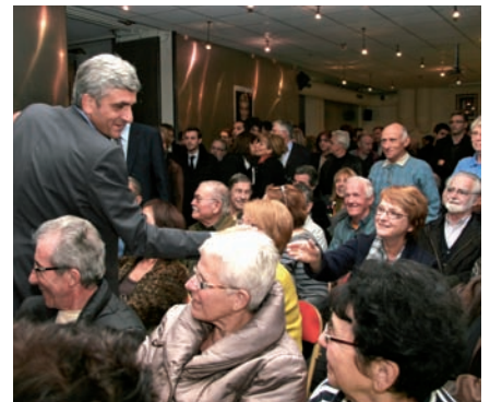
▲ Une salle comble pour le ministre

n'en fut rien, en tout cas en public ; Hervé Morin s'étant en effet prêté volontiers au jeu des questions/réponses, aux sollicitations photos et au traditionnel verre de l'amitié. Par contre, en coulisses, son service de sécurité et son équipe s'affairaient discrètement pour tout caler ; le ministre étant attendu sur le Charles-de-Gaulle... ■