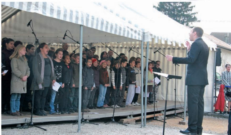
▲ Une quarantaine d'enfants ont chanté « La Marseillaise sassenageoise »

« Cette commémoration était exceptionnelle et très émouvante. Les enfants se sont sentis concernés. Ils étaient respectueux lors des silences imposés par la cérémonie, et semblaient même impressionnés par ce moment solennel. Tout cela a donné du sens à leur participation, au-delà même du fait de chanter. La contribution des écoliers à la commémoration n'est pas anodine. Le devoir de mémoire fait partie du programme pédagogique dispensé en classe. Cette cérémonie en est une application sur le terrain. »