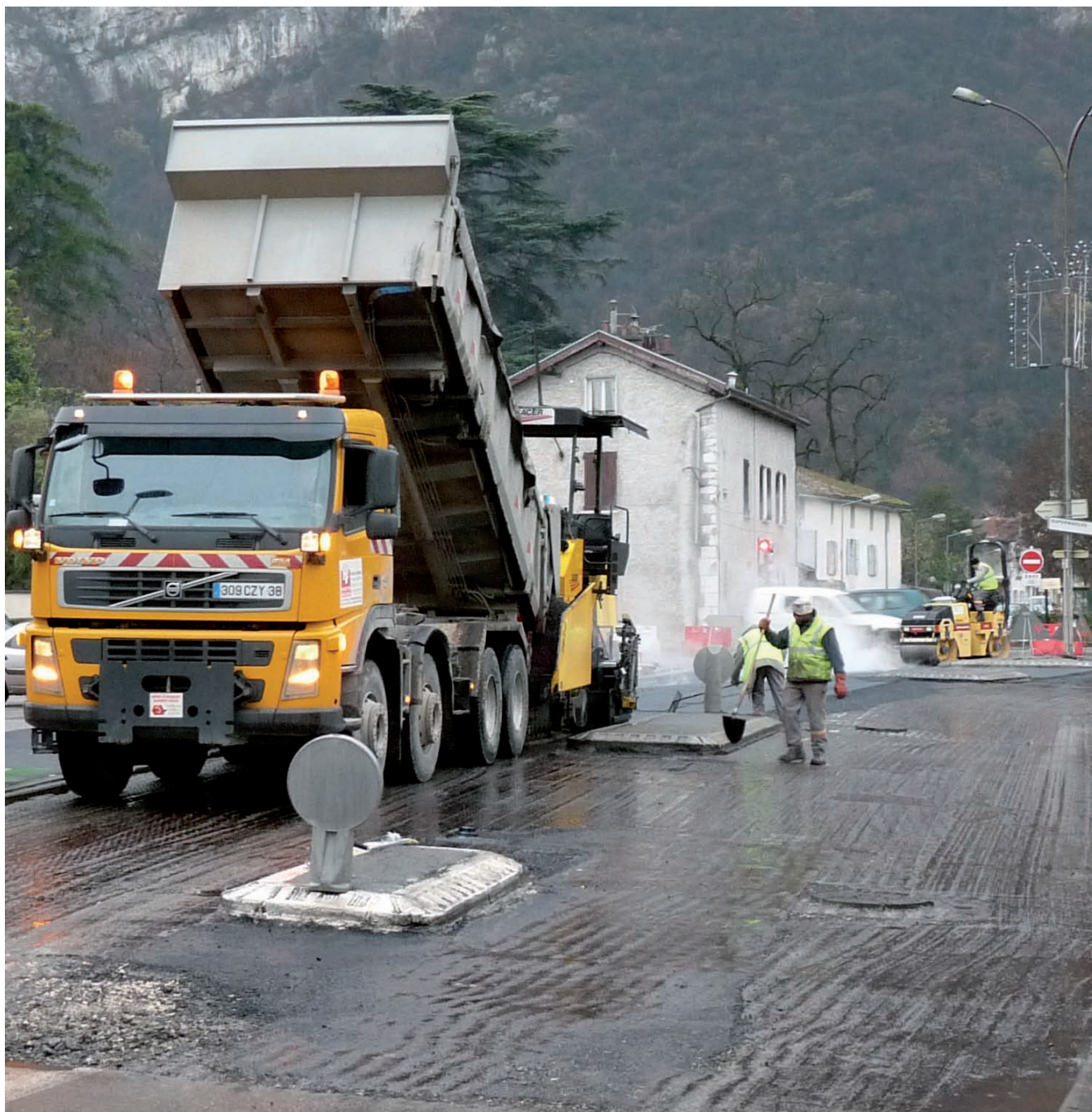
▲ La rue du Gua a fait l'objet du renouvellement de son enrobé

S assenage est traversée par un flux important de véhicules. Les chiffres parlent effectivement d'eux-mêmes : plus de 16 700 véhicules empruntent l'avenue de Valence quotidiennement, 10 000 la rue de l'Argentière, plus de 7 000 la rue du Gua, près de 8 000 la rue du 8 mai 1945, plus de 9 700 la rue François Blumet, et près de 12 000 la rue de Maladière. Ce trafic routier, conjugué aux