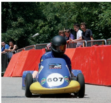
▲ Un exemple de manifestation réussie : la course de caisses à savon en juin 2009

Pour l'heure, place à l'imagination, puisque le comité a des idées qui viennent en complémentarité des animations existantes, telles que la course de caisses à savon, la fête des communautés, le calendrier de l'Avent... ■