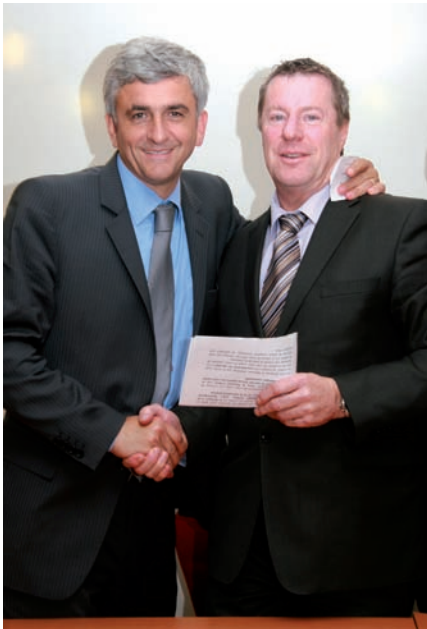
▲ Une chaleureuse poignée de mains avant de rejoindre le public