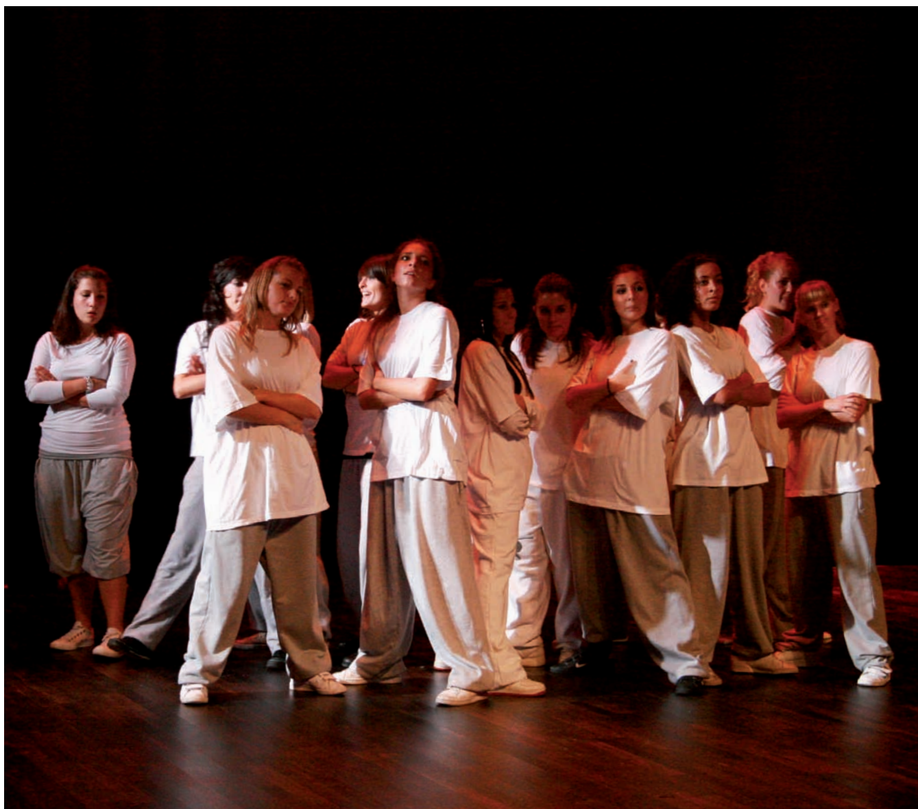
▲ L'association Hype in style lors de l'inauguration du Théâtre en Rond, 12 septembre 2008

L e tissu associatif sassenageois est composé de plus de soixante-dix associations sportives, culturelles, artistiques, et proposant de nombreuses activités dans tous les domaines (solidarité, formation, détente, environnement et cadre de vie...). Avec cette offre riche et diversifiée permettant de satisfaire une grande majorité de personnes, Sassenage peut s'enorgueillir de son paysage associatif. L'équipe municipale lui accorde d'ailleurs une grande importance car il contribue à renforcer la cohésion sociale et à apporter de l'entraide à la vie communale. Tout est donc fait pour que les associations sassenageoises et leurs adhérents se