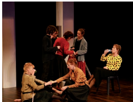
▲ La Cité joue Goldoni, 2008