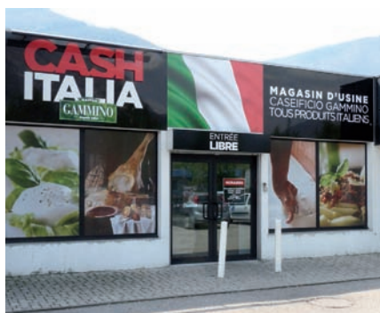
▲ Une enseigne aux couleurs de l'Italie

Infos : www.maison-gammino.com ou 04 76 26 78 19. Horaires d'ouverture : du lundi au vendredi de 7h30 à 12h30 et de 14h à 18h, et le samedi de 9h à 13h.