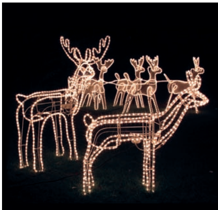
▲ Des idées... lumineuses !

Sollicités en février dernier par le maire et les élus de secteur sur la question des illuminations de Noël, les quatre conseils de secteur ont désormais rendu leur copie.