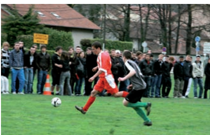
▲ Mercredi 31 mars lors de la finale régionale

Côté sport, l'équipe de football de l'union nationale du sport scolaire (UNSS) est, quant à elle, championne de l'académie de Grenoble. Les élèves se sont inclinés lors des phases finales régionales, face aux champions de l'académie de Lyon. Un beau parcours qui mérite d'être souligné. ■