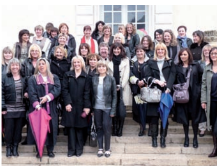
▲ Réunies pour immortaliser leurs retrouvailles

Suite à cette séance photo, les anciennes Mélusines se rejoignent pour un repas. Très vite, les souvenirs résonnent autour de la table, des photos de l'époque circulent... L'une se souvient des trajets en car où « elles chantaient et se changeaient avant les défilés ». Une autre évoque les garçons