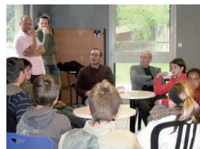
▲ Les jeunes prennent le développement durable très au sérieux