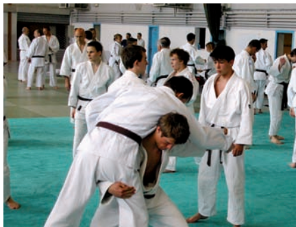
▲ Rencontre de judo

une salle de six cents mètres carrés et une autre destinée aux répétitions, de cent cinquante mètres carrés, seront mis à disposition du tissu associatif. Le planning de ce projet a été revu afin de faire face aux dépenses sans recourir à une augmentation d'impôts ; le coût total de ce projet étant estimé à plus de trois millions d'euros. L'espace festif socioculturel sera opérationnel en 2012. Encore un peu de patience, donc ! ■