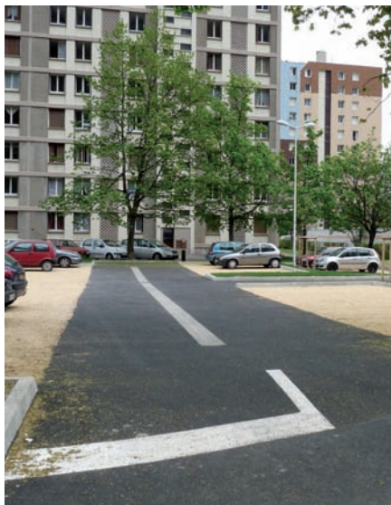
▲ Le parking avenue de la Falaise a été refait à neuf. Une réception de chantier est prévue avec les riverains mardi 18 mai à 19h.

Par ailleurs, un faux plafond a été posé au rez-de-chaussée de l'école Vercors côté Furon, en vue de la préparation des chantiers jeunes de cet été. ■