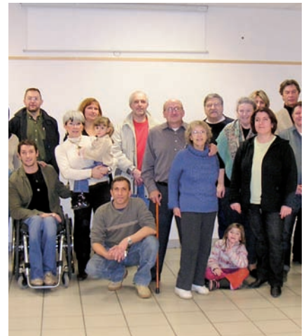
▲ Les bénévoles du Téléthon, 2008

Attachée par ailleurs à diversifier l'offre de loisirs et de découverte, notamment pour les enfants sassenageois de cours moyen, la Commune permet chaque année à 250 élèves d'assister aux matchs à domicile des Brûleurs de loups, dans le cadre du