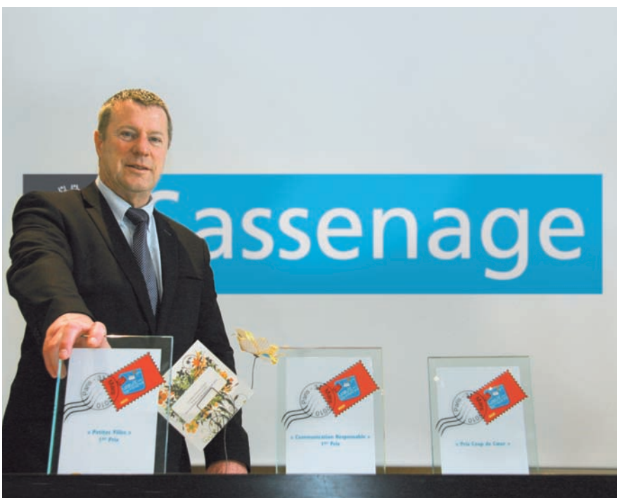
▲ Trois prix d'excellence, une reconnaissance nationale et une première pour le concours !