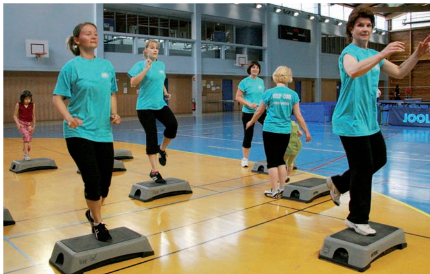
▲ Pendant le Fête du sport en 2009, l'association Keep Cool fitness