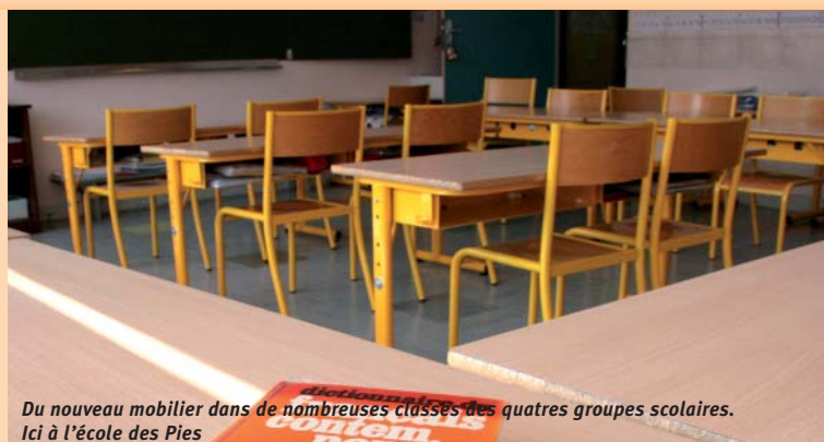
Du nouveau mobilier dans de nombreuses classes des quatre groupes scolaires. Ici à l'école des Pies

Je tiens d'ailleurs à remercier l'ensemble du personnel de la direction des affaires scolaires qui fait un travail remarquable au quotidien. Enfin, un grand merci et un grand bravo à tous les enseignants, parents et surtout enfants qui se sont portés volontaires pour créer l'événement les 21 et 22 juin à l'occasion de «La fête à Mélusine».