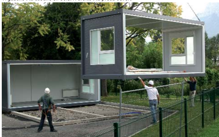
Installation de la classe provisoire