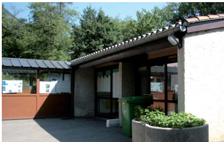
La classe supplémentaire