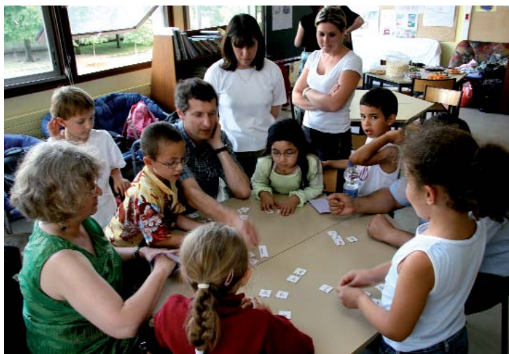
Soirée de remise de diplômes de fin d'année du Coup de pouce Clé