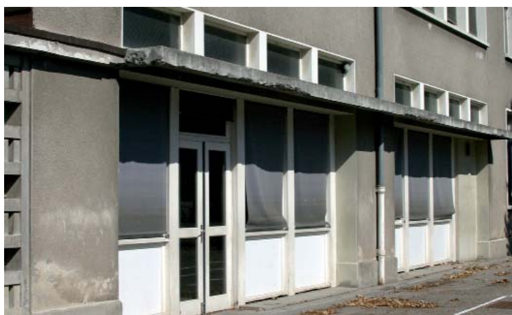
De nouvelles fenêtres qui isolent davantage (avant le ravalement)