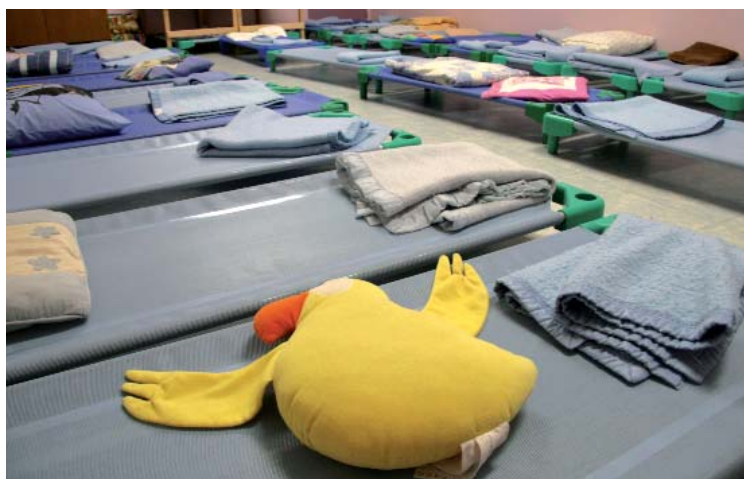
De nouvelles couchettes pour toutes les écoles