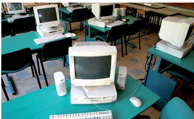
Toutes les écoles ont été équipées d'ordinateurs et d'internet. Ici à l'école Vercors