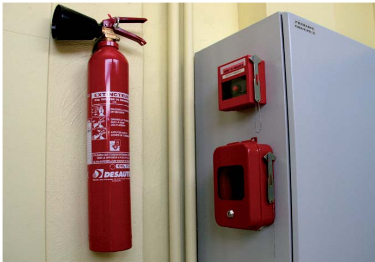
Installation d'alarmes à incendie dans tous les groupes scolaires