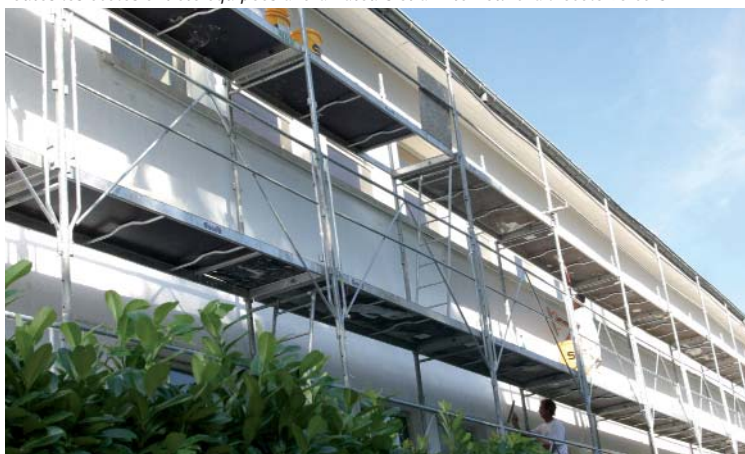
Lors des travaux de ravalement de façade