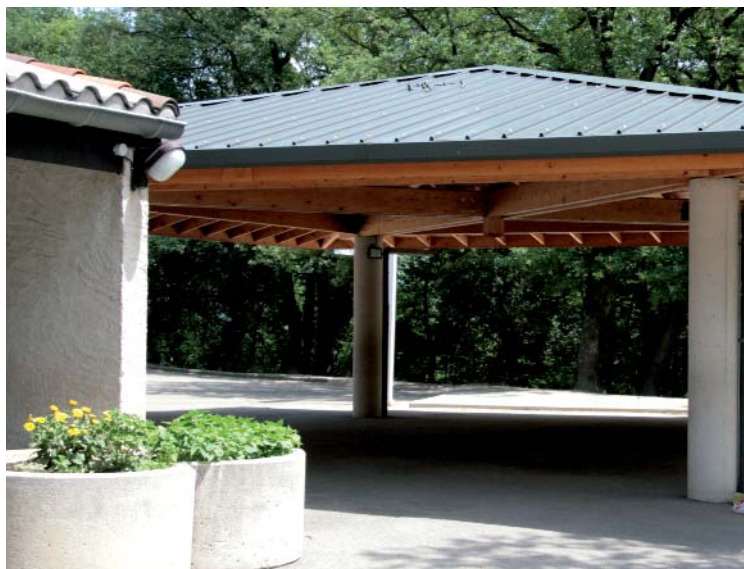
Le préau ouvert