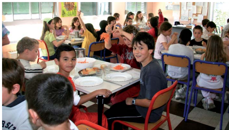
La cantine de l'école du Hameau du Château

Pas facile de réunir tous les éléments concernant les réalisations dans les quatre groupes scolaires sassenageois. Il faut dire que le champ d'action est vaste. Entre les bâtiments, la cantine, le périscolaire ou encore les aménagements de voirie, la transversalité entre services municipaux fonctionne à plein régime !