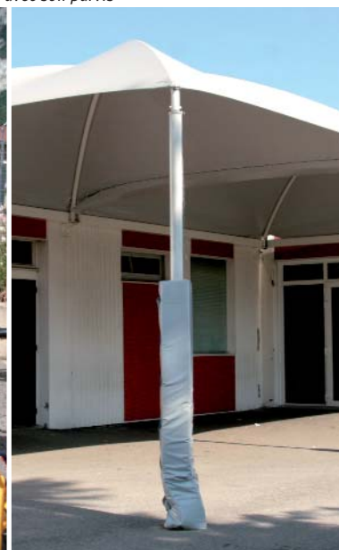
A gauche : la cabane en bois. A droite : le préau ouvert