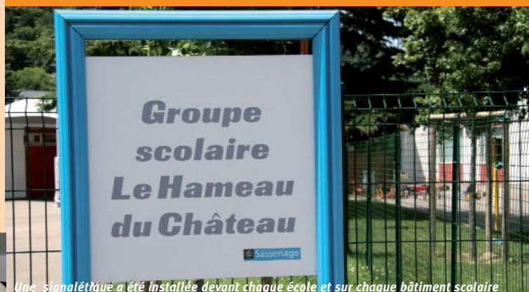
Une signalétique a été installée devant chaque école et sur chaque bâtiment scolaire

(1) A ce sujet, lire dans le prochain Sassenage en Pages n° 118 — été 2007, l'article «Savoir agir et réagir», en page 6.