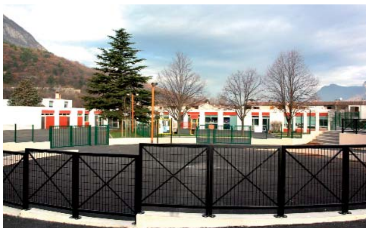
L'école du Hameau du Château aujourd'hui, avec son parvis