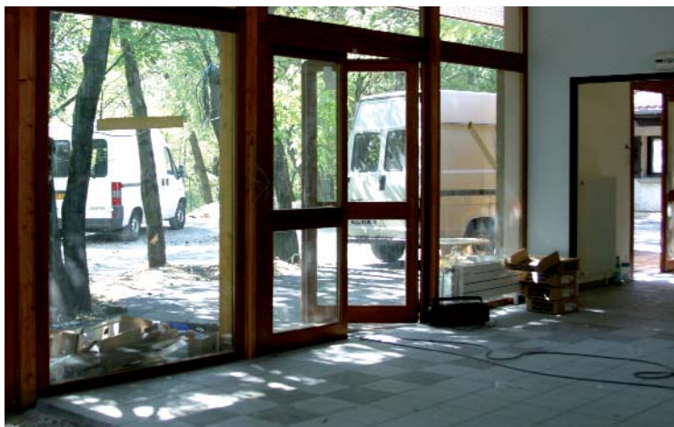
Construction du restaurant scolaire