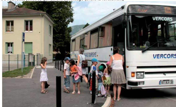
Ramassage scolaire, ici à 16h35