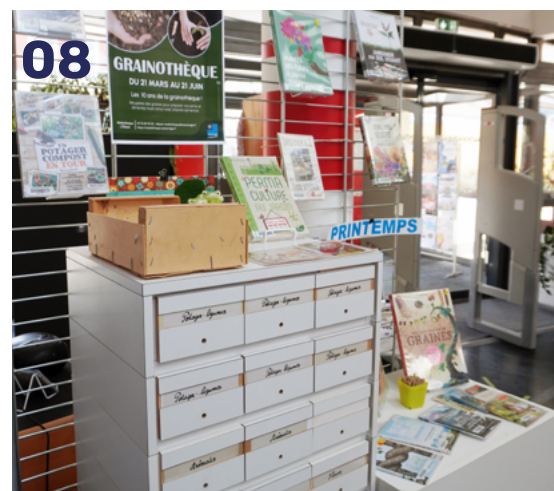
01 Atelier décorations chinoises pour le nouvel an lunaire au CCAS, mercredi 18 février // 02 et 03 Le Relais Petite Enfance « Les p'tits choux » et le Multi-Accueil « Les Lucioles » ont fêté le carnaval, mardi 24 février // 04 Course d'orientation à l'Ovalie pour évoquer les droits des femmes avec le CCAS à l'occasion de la Journée Internationale des Droits des Femmes, samedi 7 mars // 05 Le massif de la rue du Moucherotte a été créé avec de nouvelles plantations, jeudi 12 et vendredi 13 mars // 06 Concert des classes de piano par les élèves du CRC Alfred Gaillard, mercredi 18 mars // 07 Commémoration du cessez-le-feu en Algérie, jeudi 19 mars // 08 Démarrage de la Grainothèque à la Médiathèque l'Ellipse, samedi 21 mars