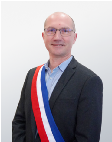
Michel VENDRA Maire de Sassenage